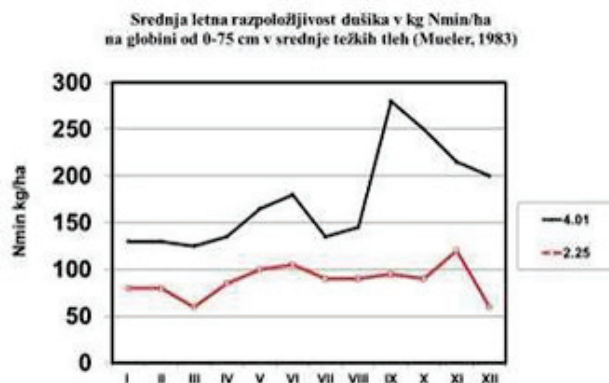
Slika 2: Prikaz srednje letne razpoložljivosti dušika v kg/ha v srednje težkih tleh glede na odstotek organske snovi v tleh

Ponudbo dušika lahko v veliki meri uravnavamo tudi z ustrežno oskrbo tal. To pomeni, da v času manjših potreb vinske trte po dušiku z ozelenitvijo zmanjšamo izgube dušika iz padavin in mineralizacije z ozelenitvijo. Ko pa nastopijo večje potrebe po dušiku, pa konkurenco podrasti zmanjšamo na minimum z mulčenjem, spomladi celo v kombinaciji z grobim rahljanjem. Na ta način so izgube dušika manjše, ponudba dušika pa prilagojena potrebam vinske trte. Zato se pri pomanjkanju dušika v tleh najprej vpeljejo ukrepi za povečanje organske snovi v tleh. To so setev rastlin za kratkotrajno ozelenitev tal (podorine, slika 1) in rastlin za trajno ozelenitev ter pokrivanje tal (zastiranje) z organsko snovjo (slama).