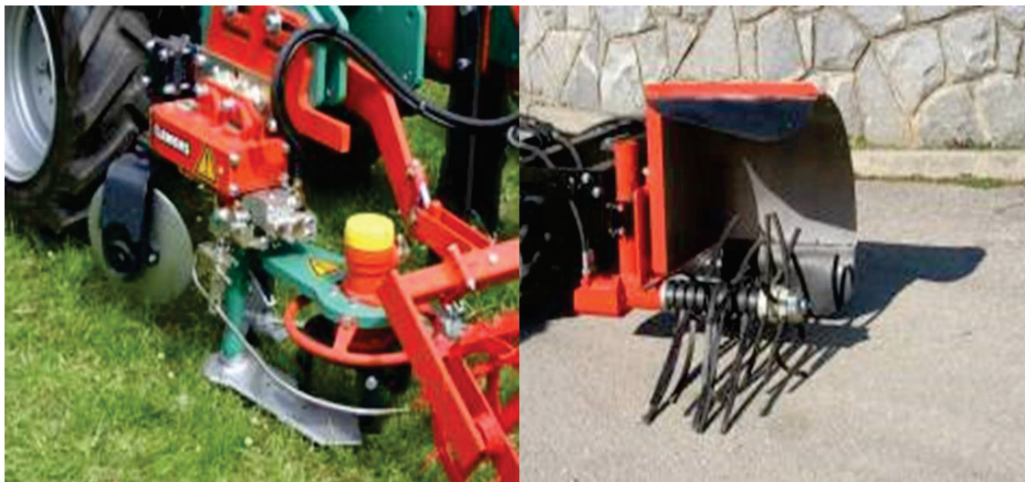
Slika 5: Podrezovalnik plevelov (slika levo) in prirejen pletvenik (slika desno) za mehansko zatiranje plevelov v vrsti