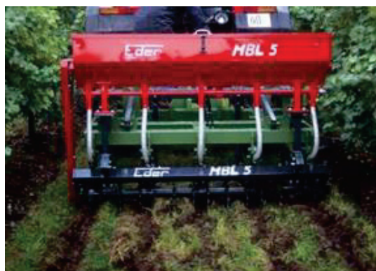
Slika 4: Grobo rahljanje tal oskrbovanih z negovano ledino in dodajanje gnojil z »odlagalcem« za izboljšanje založenosti tal s hranili v drugem horizontu tal

Za razliko od dušika, gnojenje s fosforjem in kalijem ni vezano na določen čas. Glede na njuno slabo gibljivost v tleh jih je najprimerneje dodati v jeseni, čeprav je največja poraba hranil spomladi, po brstenju, med intenzivno rastjo mladik. Pri ozelenitvi moramo gnojila raztrositi po celi površini. Vnos hranil v nižje plasti tal opravijo tudi rastline za zeleno gnojenje. V primerih, ko je v rodnih vinogradih zgornji horizont (0 do 25 cm) dobro založen s hranili spodnji (25 do 50 cm) pa slabo, ne moremo premešati tal, predvsem ne na večjih strminah. V taki situaciji lahko uporabimo stroje, s katerimi dodamo gnojila na željeno globino (slika 2). Da omogočimo regeneracijo ob tem poškodovanih korenin, tega ukrepa ne smemo izvajati v času glavne rasti trte. Primeren čas za to je od oktobra do novembra in od marca do maja. Dognojevanje mora biti izvedeno na tak način, da se čim prej regenerira tudi travna ruša.