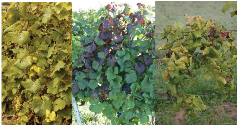
Slika 7: Splošna bledikavost, rumenenje listov pri belih sortah, rdečenje pri rdečih sortah, zvijanje listnih robov navzdol.

Imetniki vinogradov naj pozorno pregledujejo vinograde v času po cvetenju trte, predvsem pa v juliju, avgustu in septembru. V primeru suma je treba poklicati lokalnega fitosanitarnega inšpektorja ali strokovnjaka za varstvo rastlin na lokalnem kmetijsko gozdarskem zavodu ali inštitutu ali UVHVVR. Pozornost je potrebna predvsem v primeru, če se v vinogradu povečuje število simptomatičnih trt!