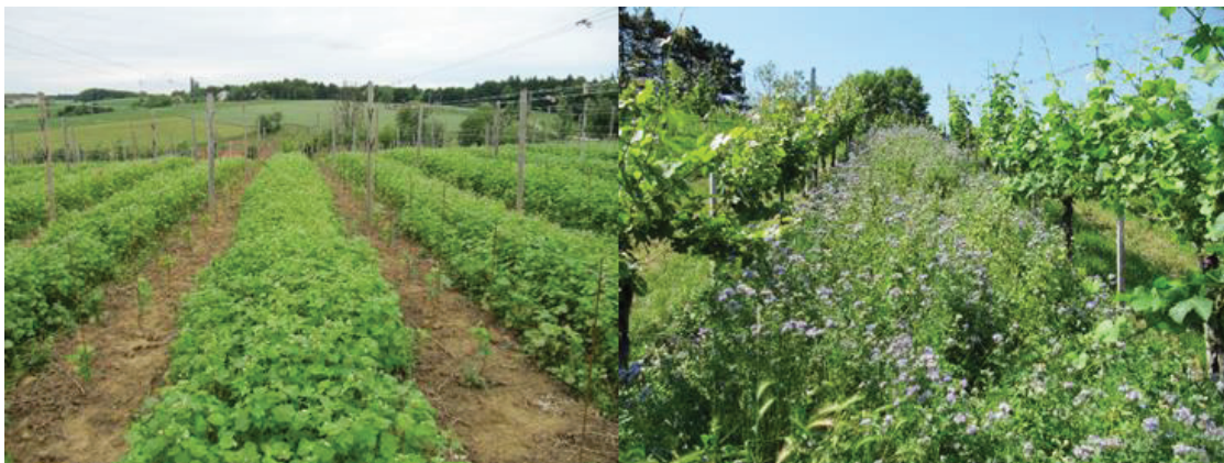
Slika 3 Zaščita tal pred erozijo in obogatitev tal z organsko snovjo s setvijo podorin. Na sliki levo ajda v mladem vinogradu, desno facelija v starem vinogradu.

rastlinsko maso pograbi z brežin v medvrstni prostor ali pod trte. Z načrtnim rahljanjem tal (groba obdelava) od zadnje dekade aprila do prve dekade maja pospešimo mineralizacijo dušika, da je trti na voljo do cvetenja in v juliju za rast mladik in jagod.