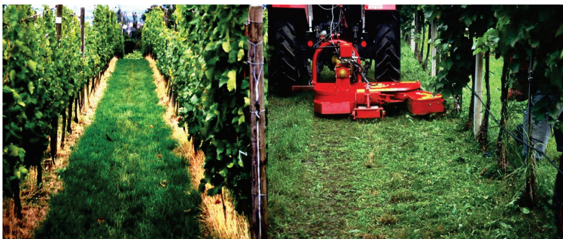
Slika 6: Zatiranje plevelov z uporabo herbicidov v vrsti pod trsi (levo) in mehansko zatiranje plevelov z odmičnim mulčerjem

Oskrba tal v vrsti je usmerjena v zaviranje razvoja močno rastočih plevelov in trav. Cilj oskrbe je usmerjanje razvoja plevelov in trav in ne uničevanje zelenega pokrova, zato se mora herbicid vedno aplicirati samo na rastline in ne na gola tla. Z na hitro odmrliimi rastlinskimi deli se poveča količina organske snovi, kar zmanjša negativne učinke herbicidov na življenje v tleh. Uporabimo lahko le herbicide, ki so navedeni v smernicah za integrirano varstvo vinogradov.