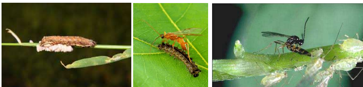
Slike vir internet

Parazitoidi so organizmi, katerih odrasli osebki parazitirajo različne razvojne stadije gostiteljev, največkrat žuželk in drugih členonožcev in da je končni rezultat parazitiranja smrt njihovega gostitelja.