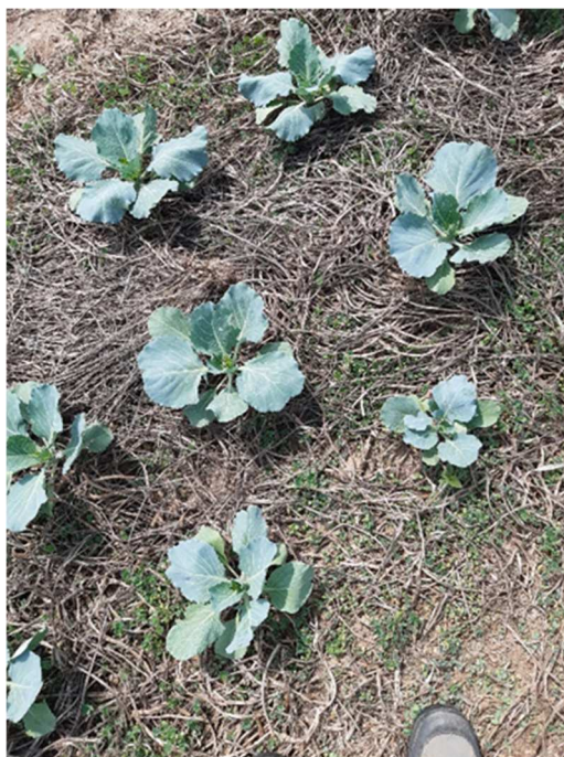
Saditev zelja v mrtvi mulč, valjana inkarnatka

Plevele lahko medvrstno uravnavamo mehansko (z branami, okopalniki, krtačami, strgali ali ročnimi orodji). Ob tem tla rahljamo, pospešujemo prezračevanje tal, pospešujemo mineralizacijo dušika in zmanjšujemo izhlapevanje vode iz tal. Pri mehanskem obvladovanju plevelov je pomembno, da opazujemo vznik plevelov in kultiviramo, ko ima plevel 2 do 4 liste. Velja pravilo: »Manjši kot je plevel, večji je učinek.«. Okopavanje oziroma obdelava je odvisna od kulture in fenofaze te kulture, saj so posamezne vrste vrtnin in poljščin različno občutljive za mehansko obdelavo in moramo vedeti, kdaj lahko uporabimo česala, nogače, okopalnike ali krtače in kakšno globino obdelave lahko izvajamo v posamezni fenofazi.