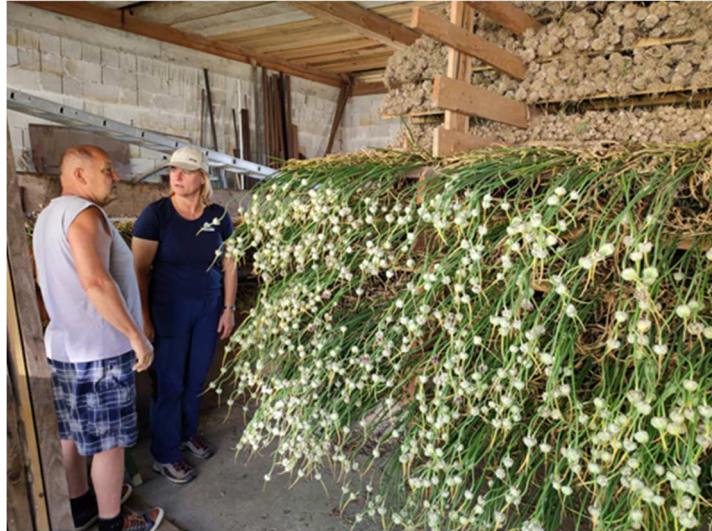
Sušenje semenskega česna in zračnih stročkov česna