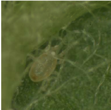
Slika: Plenilska pršica ( Typhlodromus pyri ), (Foto: Jože Miklavc)