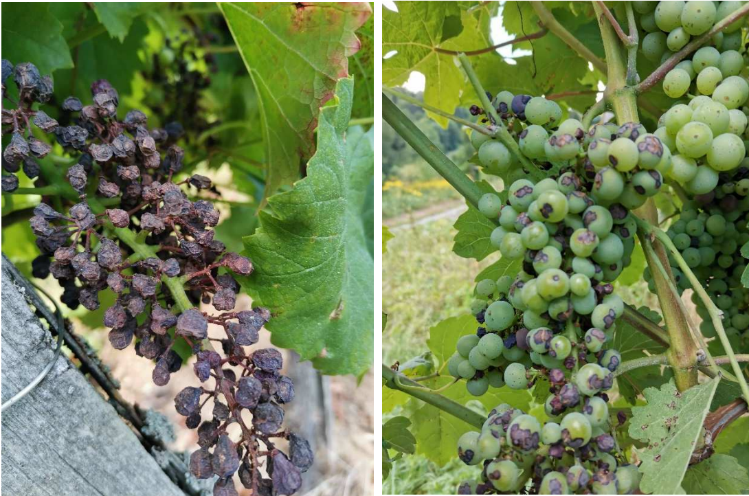
grozdna gniloba gvinardija (Guignardia bidwelli (Ell.) Vial & Ravaz) levo, črni pikec ali antraknozo (Elsinoë ampelina Shear) desno