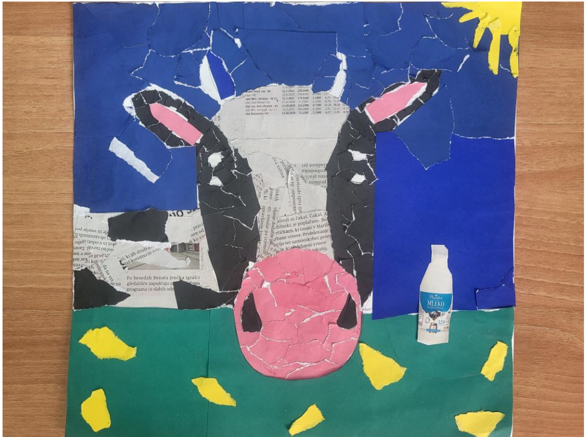
NEJA HROVAT, 5.a, OŠ MOKRONOG