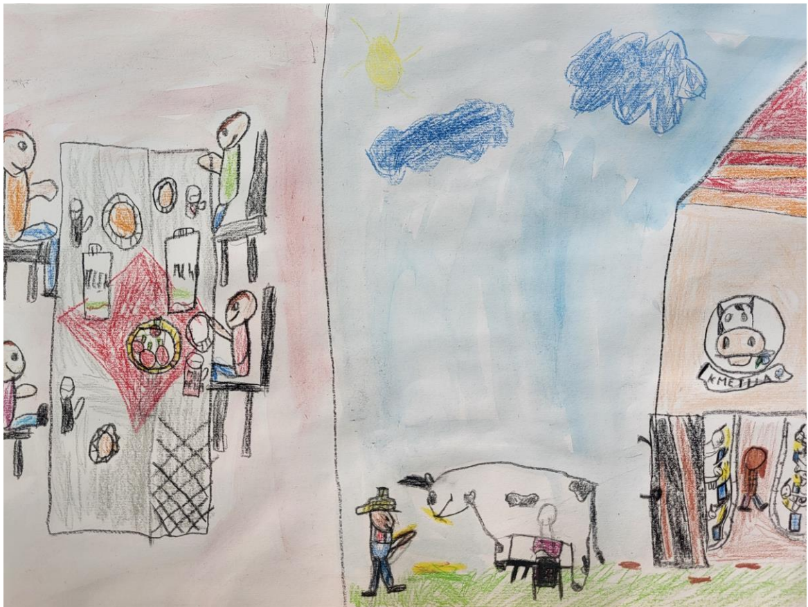
SERGEJ PRISTAVNIK, 3. razred, OŠ MOKRONOG