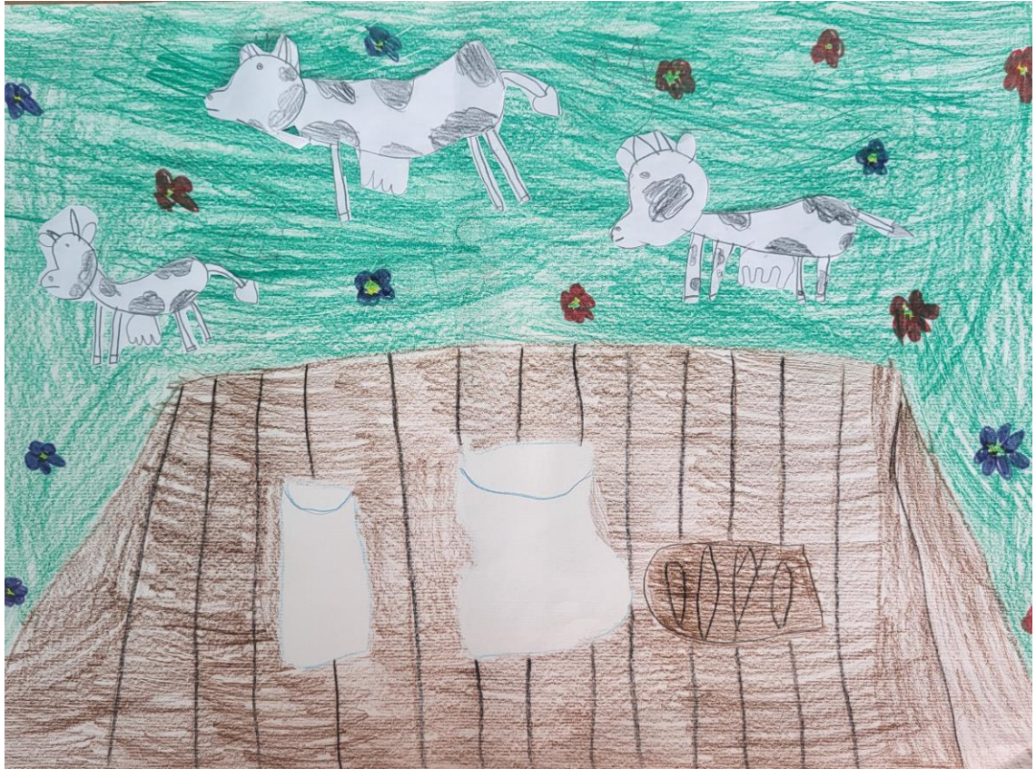
ALJA MIKLIČ, 1. razred, OŠMOKRONOG, PŠ TREBELNO