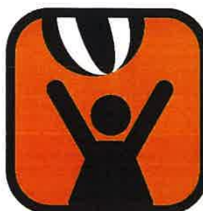
Otrokom prijazna turistična kmetija