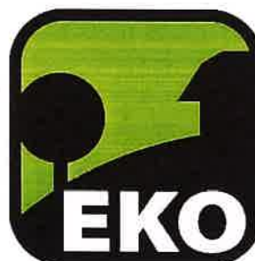
Turizem na ekološki kmetiji