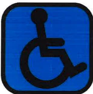
Gibalno oviranim osebam prijazna turistična kmetija