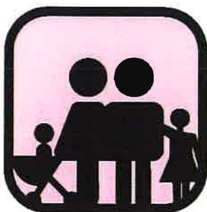
Družinam z otroki prijazna turistična kmetija