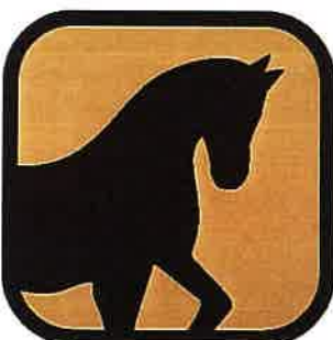
Ljubiteljem konj in jahanja prijazna turistična kmetija