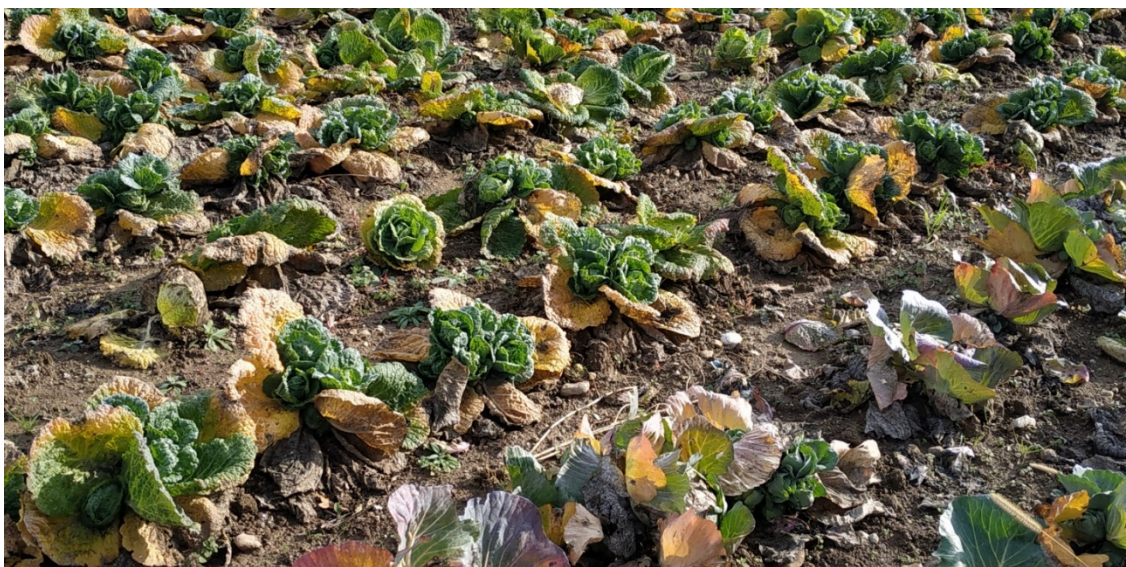
Slika 3: Črna žilavka na listih glavnatega ohrovta in zelja po spravilu glav.