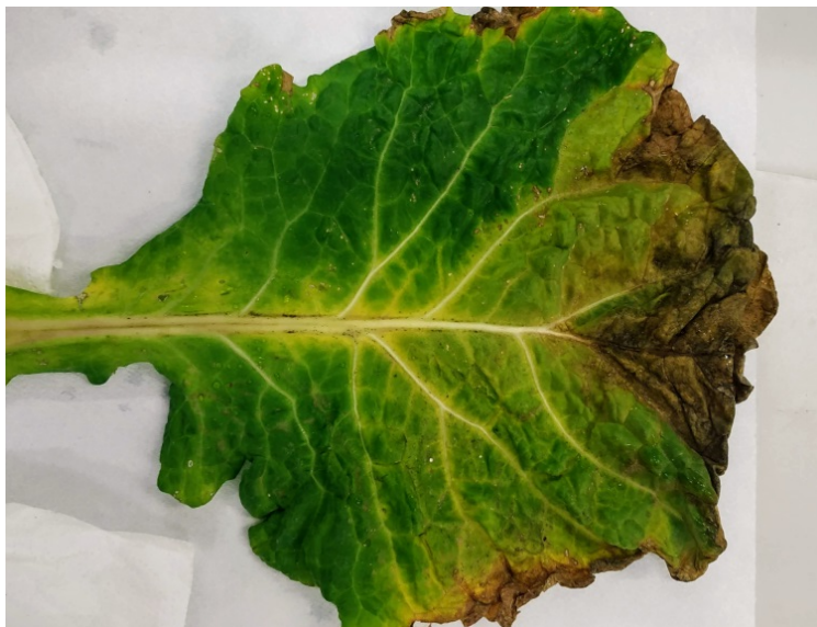
Slika 2: Črna žilavka na listu glavnatega ohrovta.