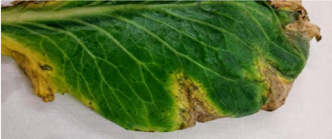
Slika 1: Bolezenska znamenja črne žilavke na listu zelja (J. Lamovšek, 2021).