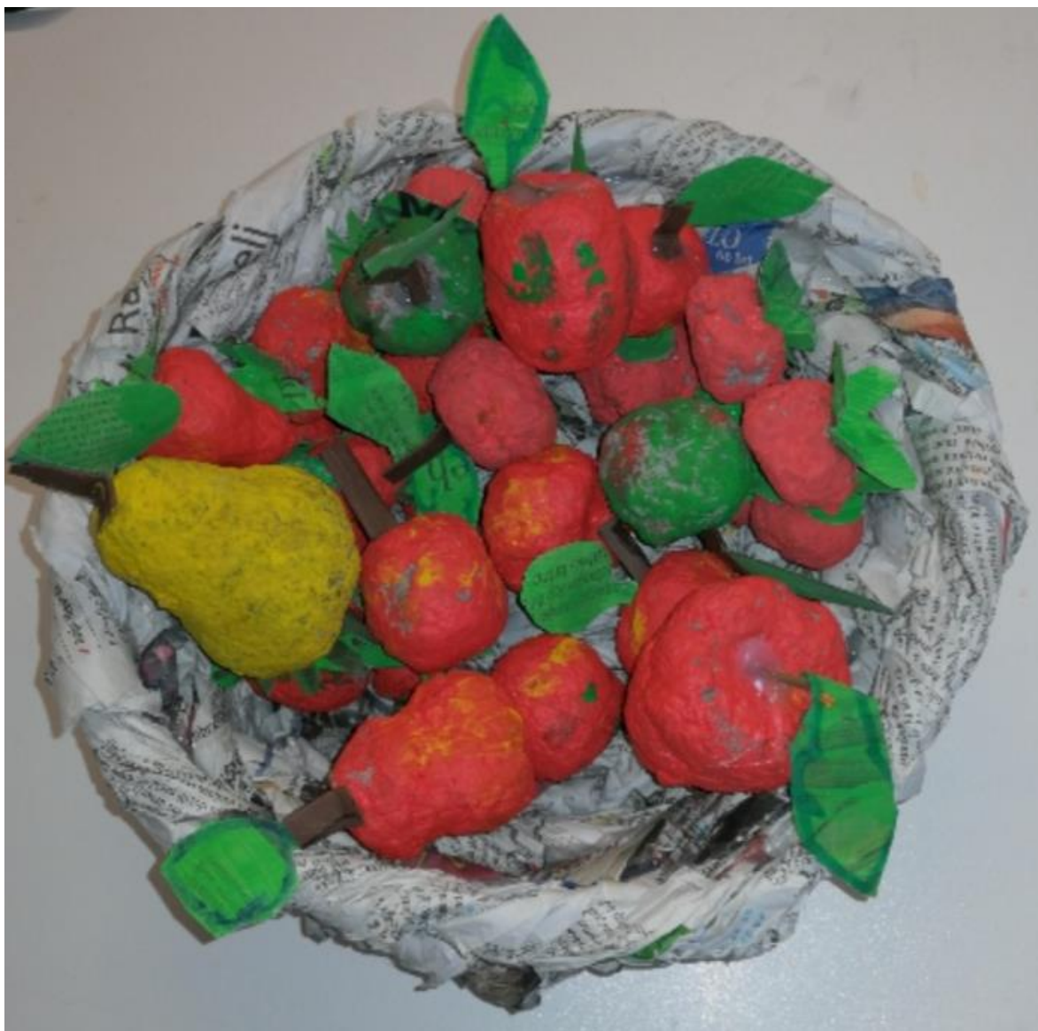
VRTEC CEPETAČEK MIRNA PEČ, oddelek STRELE, 5 let