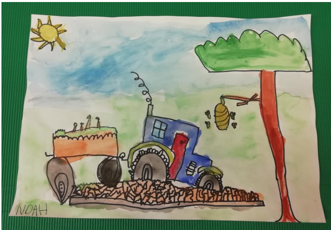
VRTEC RINGA RAJA ARTIČE, NAVIHANČKI, 5-6 let