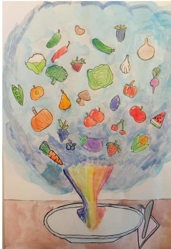
MANCA SKUBIC, 5. razred, OŠ MOKRONOG-TREBELNO