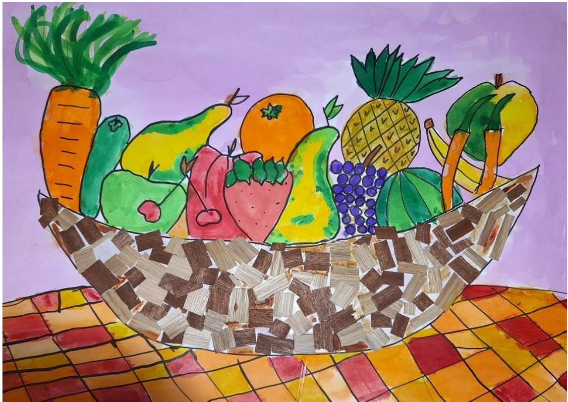
PIA FIRANT, 3.razred, OŠ KALOBJE