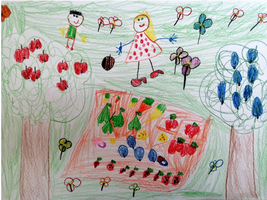
VRTEC STARI TRG OB KOLPI, 5-6 let