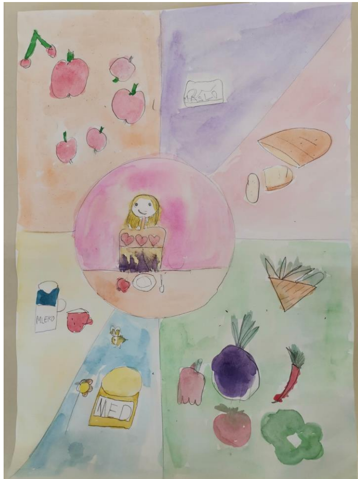
LARA NOVAK, 1. razred, OŠ BIZELJSKO