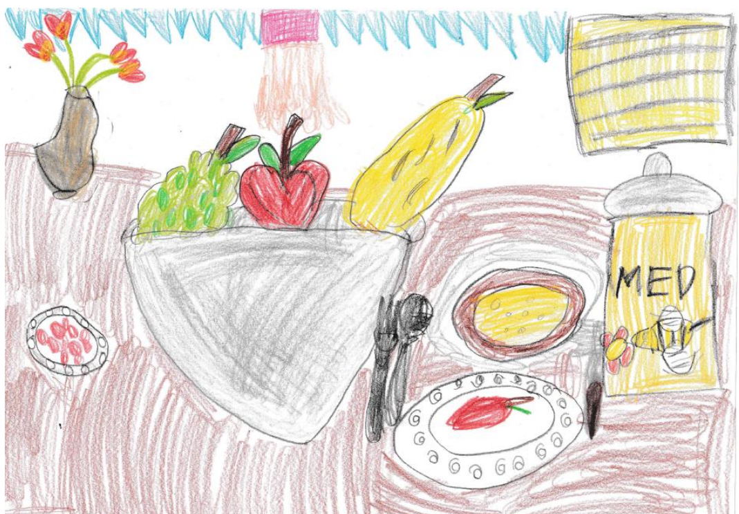
ŽIVA ŠALEHAR, 2. razred, OŠ TREBNJE