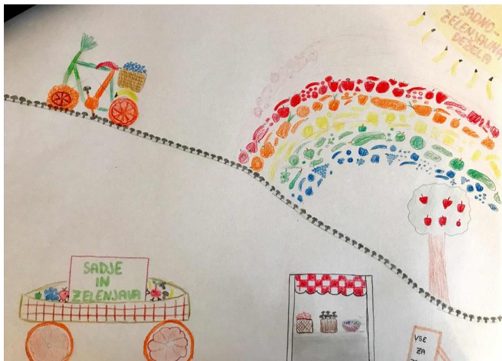
BRINA POČRVINA, 6.b, OŠ ŠMIHEL