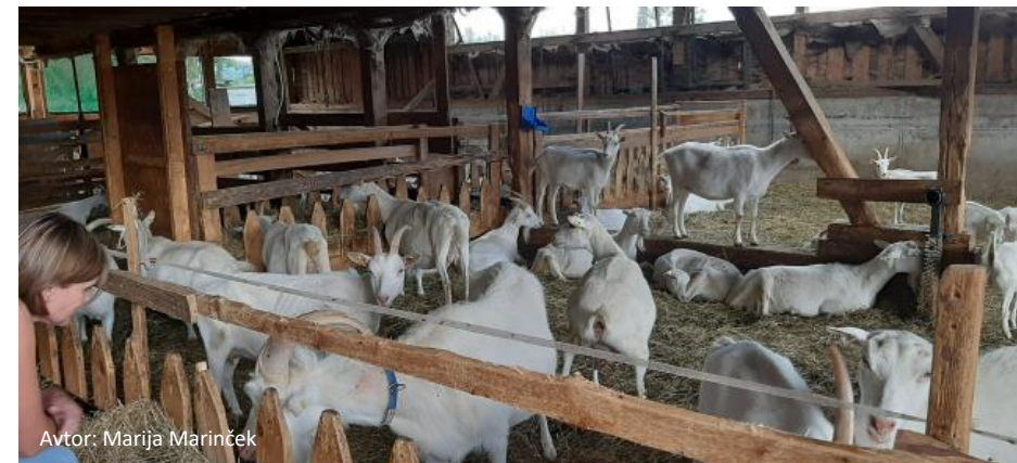
Avtor: Marija Marinček

Plačilo za hlevsko rejo drobnice znaša 52,25 EUR/GVŽ na območju z 210 dni paše in 62,70 EUR/GVŽ na območju s 180 dni paše.