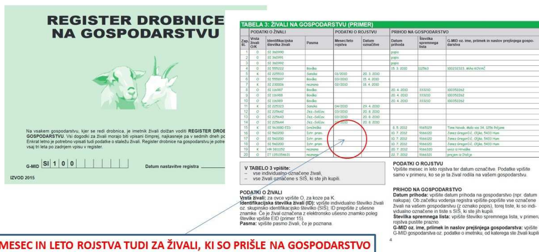
Slika 2: RDG – predlog za vpis podatka o mesecu in letu rojstva za prejete živali

V izogib napakam pri vnosu zahtevka in težavam pri izvedbi pregledov na kraju samem, predlagamo, da rejec v RDG v tabeli 3 označi (najbolje z navadnim svinčnikom) za katere živali bo uveljavljal operacijo DŽ – drobnica. Primer označitve je na sliki 3 (zapis »DŽ« ob identifikacijski številki živali, za katero se uveljavlja zahtevek). Označeno je lahko tudi drugače, na primer le kljukica ob identifikacijski številki... Predlagamo še, da tako izpolnjen RDG nosilec kmetijskega gospodarstva prinese seboj na vnos zahtevka na KSS. Pred vnosom skupaj s kmetijskim svetovalcem preverita ali vse označene živali v RDG-ju ustrezajo zahtevam. Skupno število teh živali potem svetovalac vpiše na zahtevek.