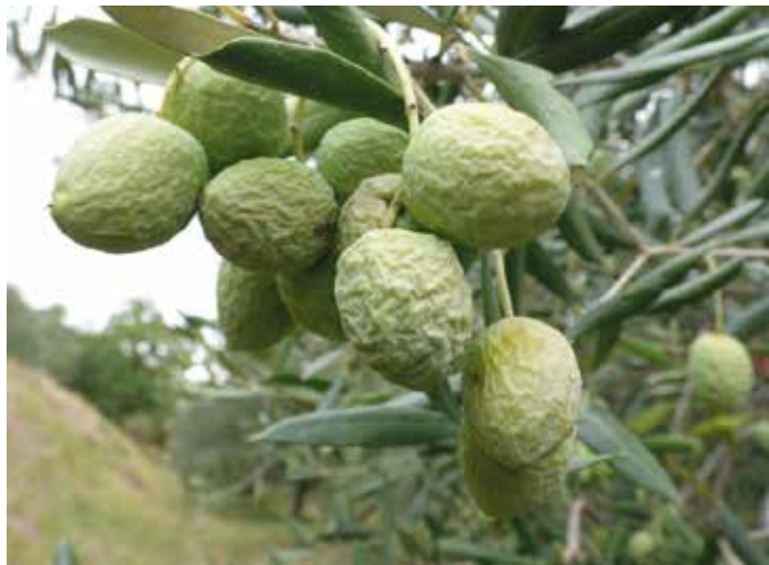
Sušni stres v oljčniku

Podnebne spremembe prinašajo vedno več ekstremov (močni nalivi, toča, pozebe ...). Poleti je manj padavin, zaradi česar so pogostejše suše, pozimi pa pade več padavin. Zaradi višjih temperatur se podaljšuje dolžina rastne dobe in povečuje evapotranspiracija.