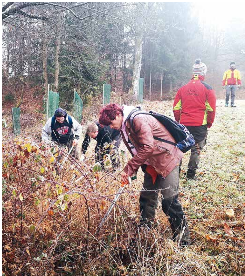
Prenos znanja v prakso za dijake SGLŽŠ Postojna in usposabljanje za kmetijska gospodarstva

bodo pri izbiri trga, tesen stik s potrošnikom, kar vse skupaj vodi do boljše ekonomike kmetije. Pri osnovni gozdarski in dopolnilni dejavnosti iz gozdarstva je prav tako pomemben davčni vidik opravljanja teh dejavnosti. Obenem se je treba zavedati, da delo v gozdu spada med dejavnosti z največjim tveganjem za nezgode. Gre za delo v naravnem okolju, ki zahteva posebna znanja, veščine in zaščitno opremo, da se izognemo nesrečam.