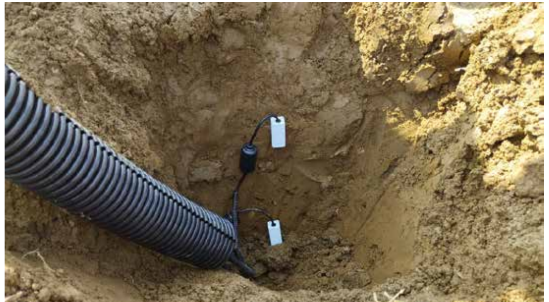
Nameščeni senzorji za spremljanje stanja vlažnosti tal na partnerski kmetiji

stanjem vode v tleh, potrebami po namakanju in posledično vpliv namakanja na količino pridelka pri izbranih kulturah. Način obdelave tal v kmetijstvu pomembno vpliva na različne funkcije tal, tudi na sposobnost zadrževanja vode v tleh.