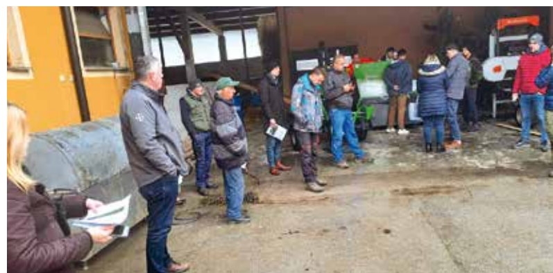
Prikaz gospodarske mehanizacije

V sklopu aktivnosti projekta so bile z namenom