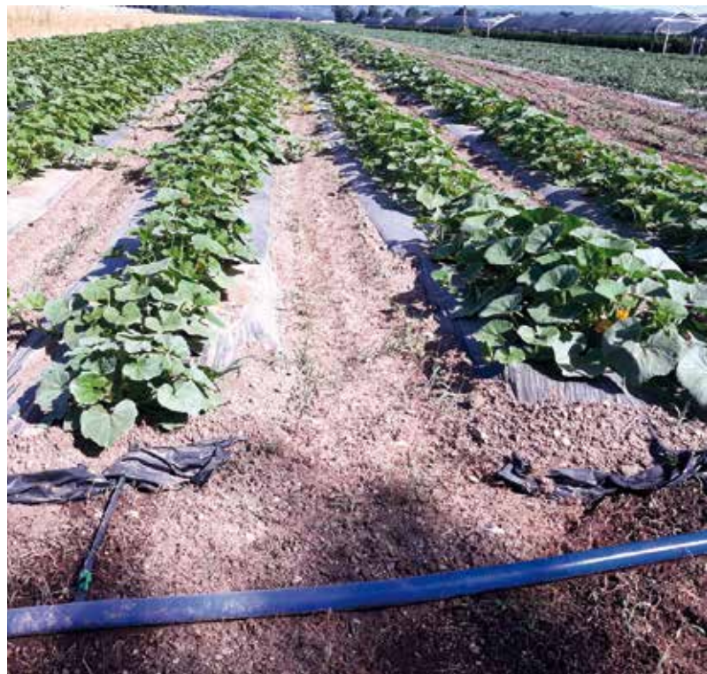
Kapljično namakanje pod folijo

Zahteva pridobitve gradbenega dovoljenja za vodne zbiralnike je določena s prostornino razlivne vode, ki pred-