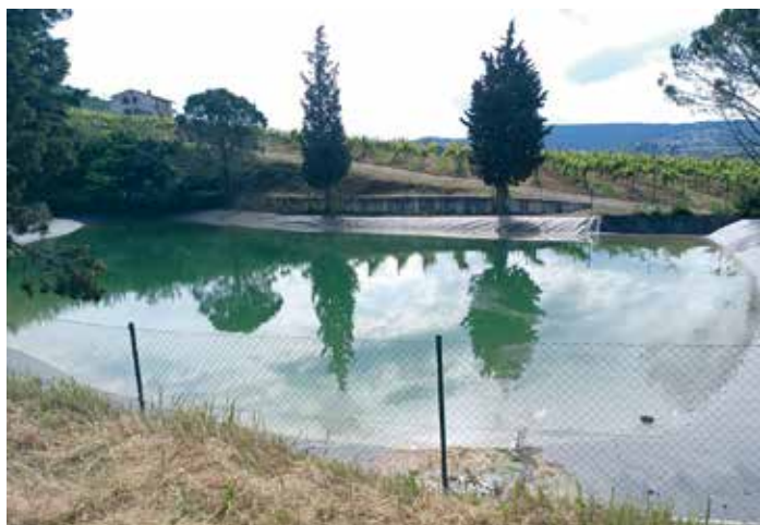
Vodni zbiralnik za namakanje

Za rabo deževnice oziroma kapnice ne potrebujemo vodnega dovoljenja.