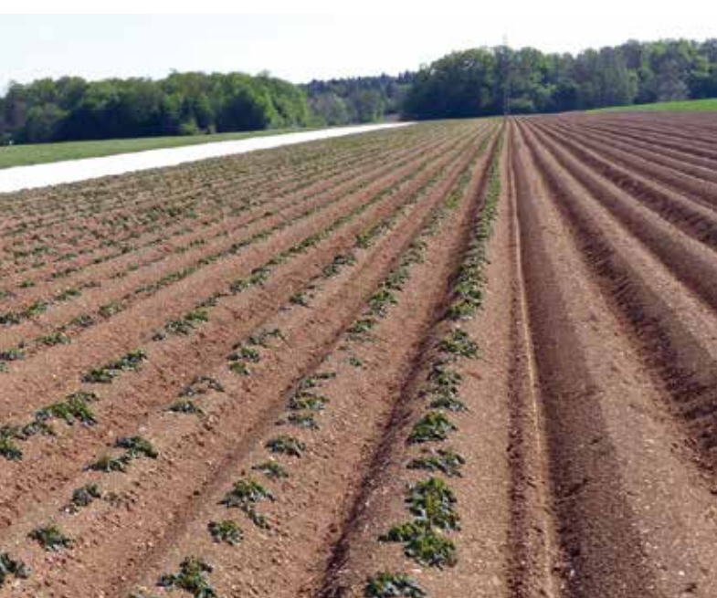
Poškodbe zaradi mraza in suše na zgodnjem krompirju

»NATALIJA PELKO IN MATEJA STRGULEC, KGZS - ZAVOD NOVO MESTO