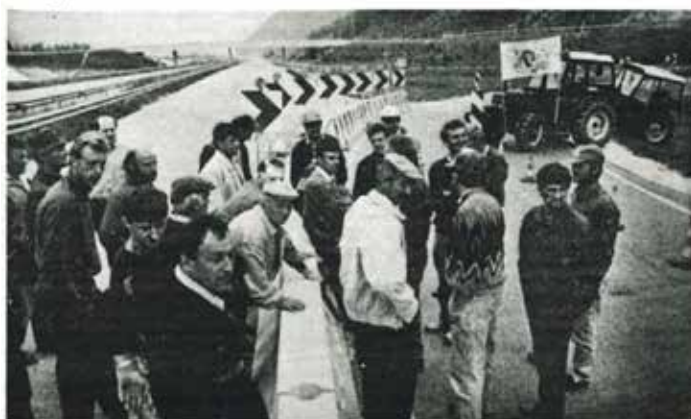
Pred tridesetimi leti so slovenski kmetje zaradi pomanjkanja poslušnosti vlade protestno zaprli več kot dvajset mejnih prehodov, med drugim tudi predor Karavanke (Gorenjski glas, 18. 6. 2003,).

S samostojno državo smo vsi pričakovali, da se bodo začeli boljši časi za kmeta, da se bodo socialni in ekonomski odnosi v državi urejali. Vendar se to ni zgodilo. Zato smo decembra 1992 organizirali protestni shod pred sedežem vlade v Ljubljani. Vlada se ni odzvala, zato je prišlo do zapor mejnih prehodov in nekaterih prometnic v Sloveniji od 14. do 17. junija 1993.