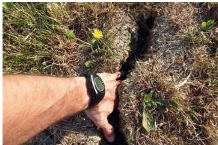
Razpoka tal v oljčniku

Tla so pomemben zadrževalnik vode, njihova sposobnost akumuliranja vode pa je odvisna od več dejavnikov: globine talnega profila, vsebnosti organske snovi, teksture in strukture tal. Z globoko obdelavo tal pred sajenjem po-