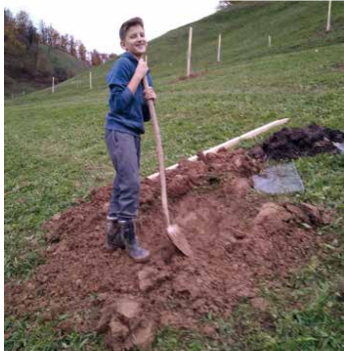
Pri sajenju visokodebelnega sadovnjaka so pomagale tudi mlade sile.

V hlevu na vezano rejo krav in z boksi za telice, ki je bil zgrajen leta 1980, redijo govede, od tega 13 krav in 10 plemenskih telic. Pri teh se zadnji čas pojavljajo težave z osemenjevanjem. Čreda je v A-kontroli, mlečnost pa med štiri in pet tisoč kilogrami v standardni laktaciji. Za lastno rabo imajo še dva do tri