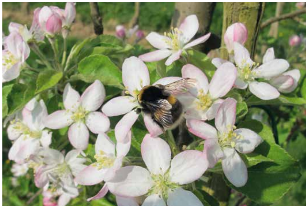
Vsaj polovico opraševanja v kmetijstvu opravijo divji opraševalci, torej čmrlji, čebele samotarke, muhe trepetavke, metulji, hrošči in celo ose.

zultati raziskave, ki je poka- zala hitro izginjanje žuželk. Izumrtje grozi kar 40 od- stotkom vrst, število žuželk pa se vsako leto zmanjša za 2,5 odstotka. Najbolj ogro- ženi so metulji, divje čebele, le, hrošči in vodne žuželke,