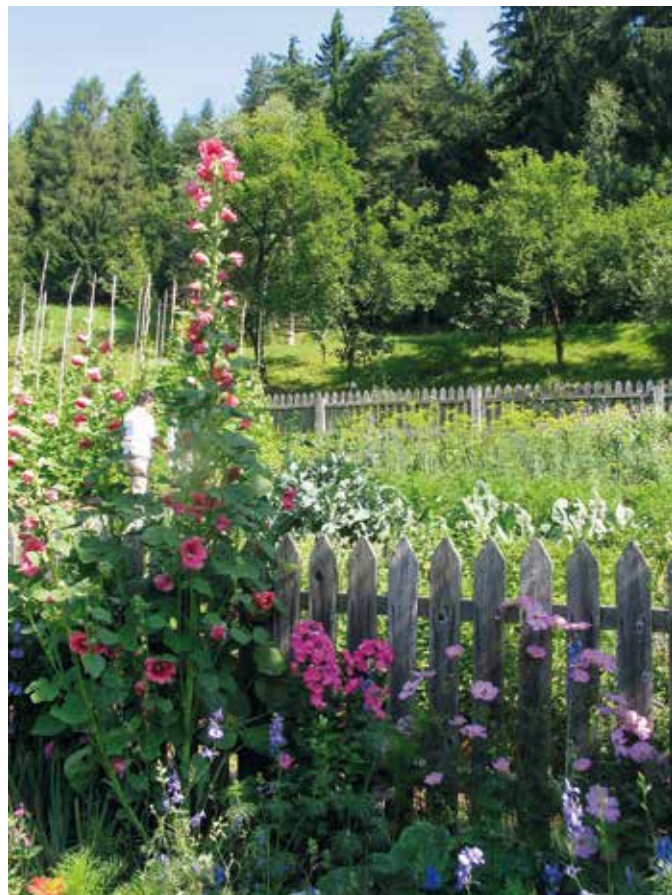
Vrt na kmetiji na Koroškem.

Na vrto naj bodo poti oz gredice trajne. Zakaj? Z gaženjem, hojo po zemlji, spreminjanjem poti vsako leto, tudi z deskami, negativno vplivamo na strukturo zemlje. Trajne gredice, ki jih vsako leto tako ali drugače obdelamo, gnojimo z or-