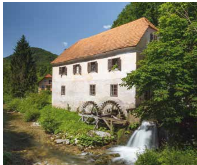
Kukovičičev mlin ob reki Bistrici.

Na naši kmetiji pridelujemo več sort žit: ajdo,