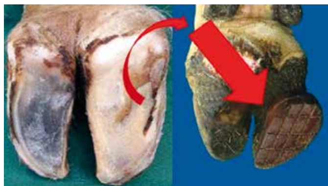
4. korak: izrezovanje poškodb na podplatu oz. steni parklja