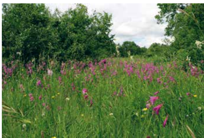
Travniki v Rojah z ilirskim mečkom.

Potrebno je poznati tradicionalno upravljanje s krajino. Samo z njim bomo uspeli ohranjati biodiverzitet in naše tradicionalno pisane travnike. Raznolikost naše pokrajine je prav delo kmetov. Travniki, ki so bili pred stoletji iztrgani iz gozdov, so ostali le zaradi človeka. Na njihovih robovih se je vedno bila bitka med človekom in gozdom. Gozd se je umikal, kajti kmetje so rob gozda jeseni in pozimi na nekaj let posekali in uporabljali za kurjavo. Posekali so ga takrat, ko se je robno gr-