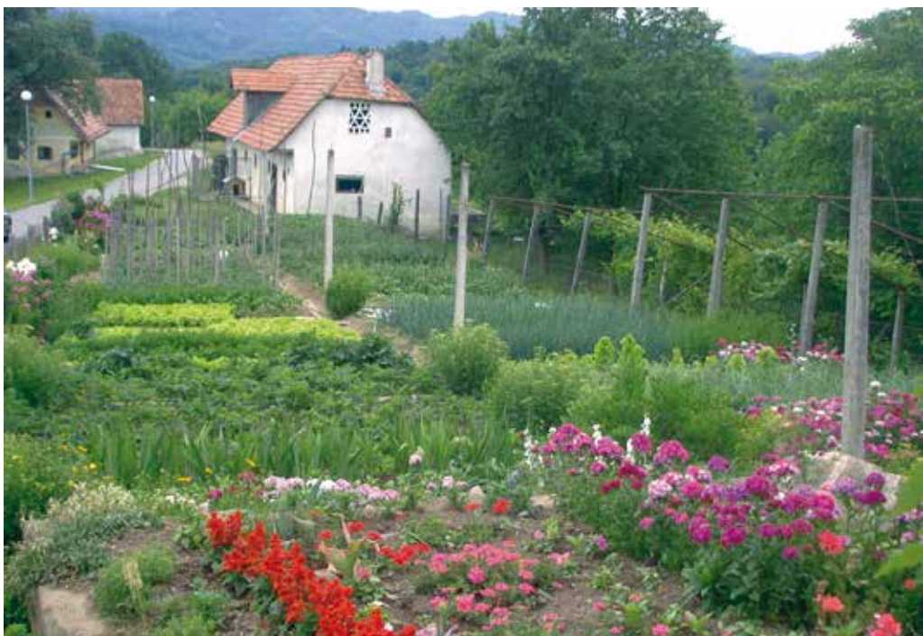
Pisan in urejen vrt.