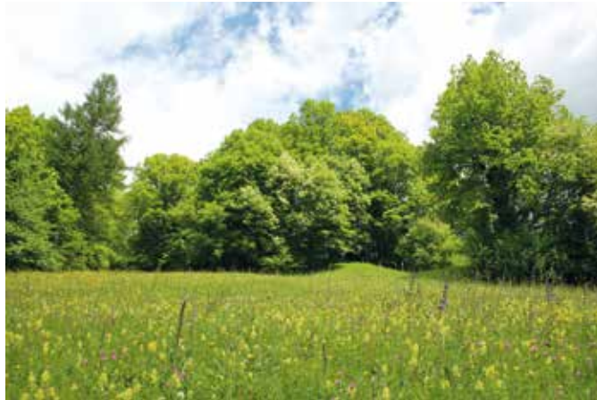
Senožet nad Cerknim.

Kljub zelo obdelani Sloveniji, bistveno bolj kot v današnjem času, je bila raznolikost rastlin in posledično tudi živali bistveno večja, kot je v današnjem času, ko smo večino nek-