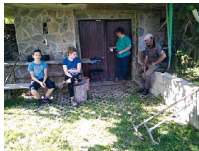
Za zidanico v Vodolah tli ideja, da bi jo uporabili za turistično dejavnost.