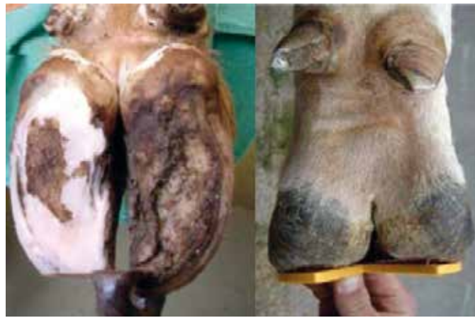
2. korak: prilaganje in razbremenitev zunanega parklja