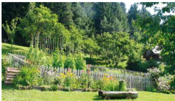
Kompostnik in voda, sestavni del vsakega vrta.

Zdrav kmečki vrt je pisan, dišeč in glasen, saj v njem najdemo tudi veliko žuželk.