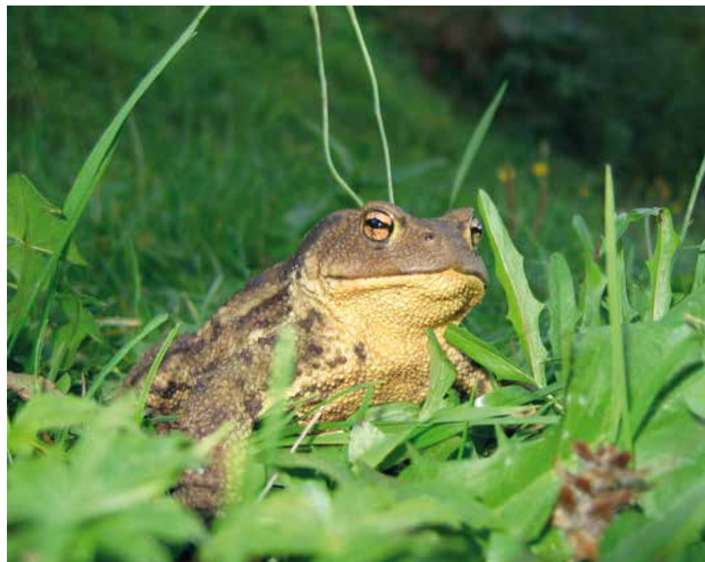
Je bolj polž v solati ali krastača na vrtu?

Stalna naselitev ljudi in razvoj kmetijstva sta ključ- no vplivala na okolje in na- stanek kulturne krajine. Kulturna krajina je ekosis- tem, ki je nastal kot posled- dica delovanja človeka in narave. S krčenjem gozda, pašo, košnjo in obdelavo zemlje so nastali travniki, pašniki, njive, sadovnjaki in vrtovi. Stoletja je bila tako biodiverzitetna v kulturni krajini velika. Raznolika, ne-