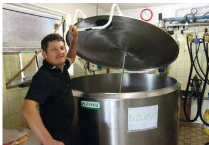
Na kmetiji je tudi vaška zbiralnica mleka z dvema bazenoma: eden za mleko ekološke reje, drugi za preostalo mleko.