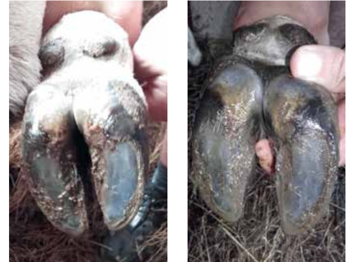
Izgled parklja na prednji nogi (leva slika) in na zadnji nogi (desna slika) pri trimesečnem teletu.

Rejci se morate zavedati, da je nega parkljev eno izmed ključnih zootehniških opravil, pri katerem lahko storimo kar nekaj napak, in si morate za to