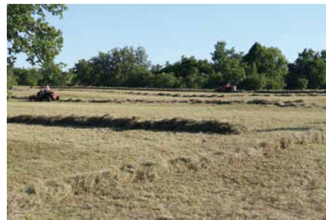
S sušenjem sena ohranjamo semensko banko v tleh - Komenski Kras.

je vsaka rastlina z drugo v harmoniji. Na soncu izpostavljenih legah so rastline običajno nižje, čvrstje, lepše, barvitejše in z več eteričnimi olji. Bolj ali manj vse dosejajo isto višino, le tu in tam se jih nekaj bohota iznad njih. Med njimi so običajno predstavnice kobulnic. Velika kobulasta, pogosto bela socvetja dajejo poseben čar tem pisanim površinam. Ponekod