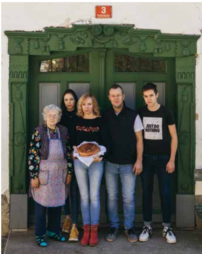
Družina Kukovičič.

Ekološko kmetovanje na zavarovanem območju pomeni večjo dodano vre-