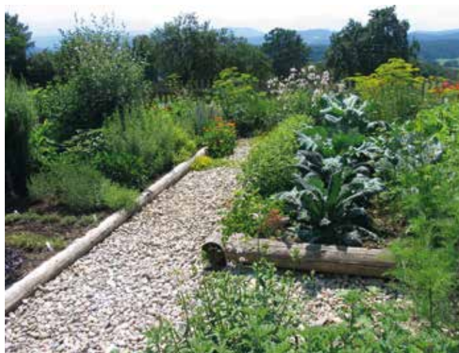
Poti na vrtu so iz naravnih materialov - lesa in kamna.

Na vrtu naj rastejo skupaj vrtnine, zelišča in cvetlice. Trajna zelišča naj vrt obkrožajo ali pa rastejo na obrobkih gredic, enoletna pa naj bodo kar pomešana z vrtninami. Običajno potem ta enoletna zelišča sploh ne potrebujejo več naše posebne nege, saj se sama zasejejo. Mi jih samo pustimo