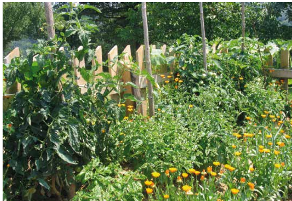
Cvetlice in vrtnine.

izključno z organskimi gnojili. Pa organska gnojila še daleč niso samo kompost in gnoj. Uporabljamo tako naravne zastirke iz pokosenih rastlin, ovčje volne ... in rastline za zeleni podor, saj to konec koncev so tudi cvetlice. Uporabni so tudi drugi organski ostanki na kmetiji. Na kmetiji običajno nakup peletiranih, organskih gnojil ni potreben, včasih pa je potreben dokup posameznih gnojil, kot je na primer kalijev sulfat. Vsekakor naj ne bo prvi in edini cilj vrta rekordni pridelki in tekmovanje s sosedi, ampak zdravo pridelovanje hrane.