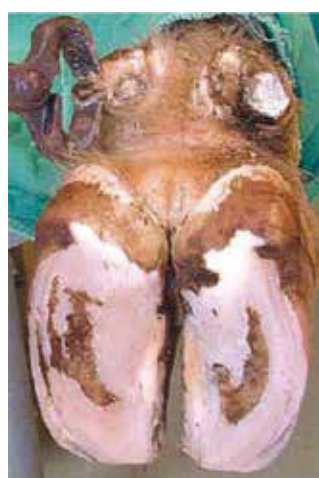
5. korak: odstranitev odtrganih delov roževine, pregled reže med parkljema in krajšanje parkeljca

ci oz. tisti, ki izvajajo korekcijo parkljev, ne glede na obseg poškodb oz. bolezni vedno poskušajo parklje korigirati v idealni približek pravilnemu izgledu zdravega parklja. To poskušajo doseči tudi z določenimi postavki – neke vrste protezami za parklje, ki začasno nadomestijo manjkajoči del parklja, kar prikazuje slika 26 (ICAR, 2015).