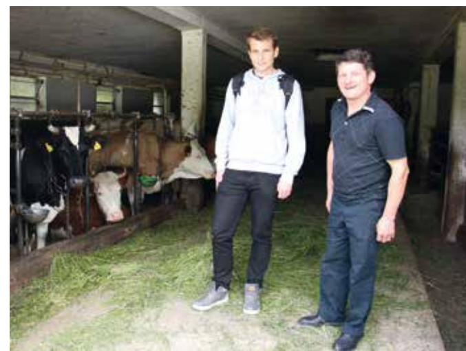
Hlev iz leta 1980 bo potreben preureditve, še zlasti zaradi zahtev po načinu reje v ekološki živinoreji.