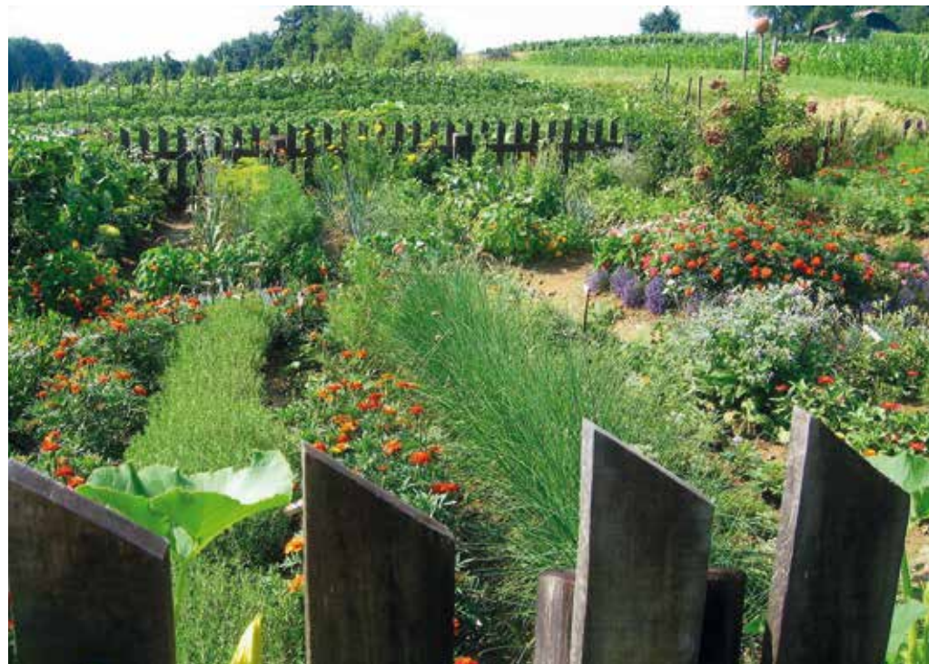
Kmečki vrt, stalne, visoke grede, veliko cvetja, zelišč in dovolj zelenjave za družino.

ne »garteljce« ali »garkeljce« ali še kako drugače. Ti so se v začetku držali hiše.