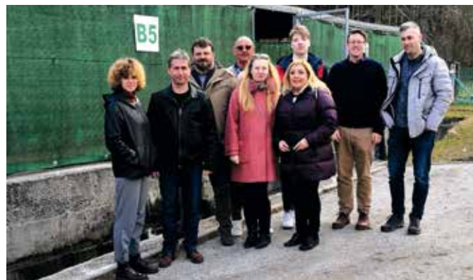
Udeleženci projekta na ribogojnici Ribiške družine Bled

ga je gostilo podjetje AquaTT iz Dublina in na katerem je sodelovalo več kot 170 udeležencev, ki so se s strokovnjaki iz ribogojstva pogovarjali o najboljših praksah na področju energetske in vodne učinkovitosti. Udeležencem je bil predstavljen predogled platforme za e-učenje, ki je bila uradno predstavljena 31. maja 2021. Srečanje se je začelo s predstavitvami strokovnjakov iz ribogojstva na temo trajnosti v tem sektorju. Sem spadajo Energetska učinkovitost v recirkulacijskih sistemih (Maddi Badiola, Alpha Aqua A / S in HTH