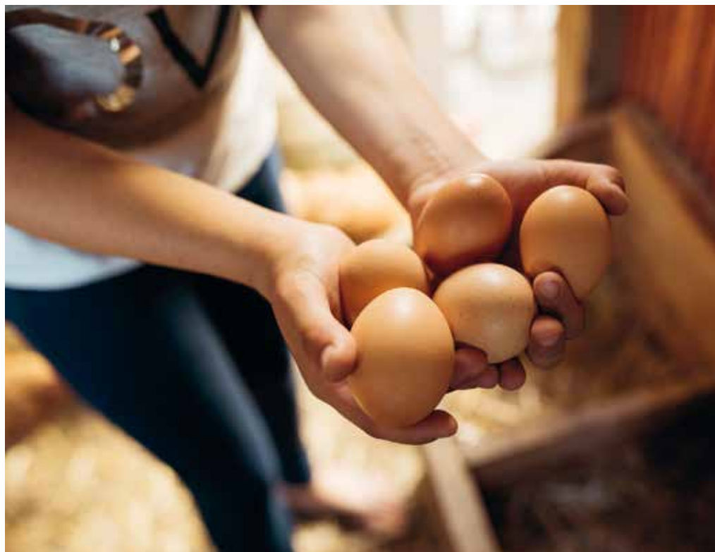
Prebivalec Slovenije v poprečju zaužije 10,67 kg jajc letno (SURs, 2018). Če jajce v poprečju tehta 60 g, pomeni, da Slovenci zaužijemo v poprečju 152 jajc letno.

Trgovine odvedejo sredstva na račun lastnega zmanjšane dobička! Inicijativa ima vzpostavljen sistem, s katerim izvede kontrolo uhlevitve in reje – za to porabi 15 % denar-