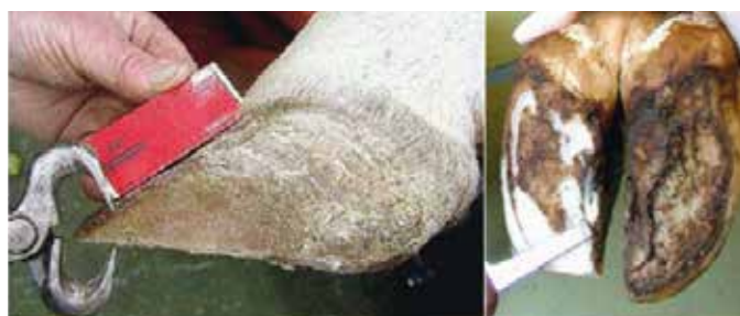
1. korak: krajšanje sprednje stene parklja in obrezovanje podplata notranjega parklja

Če naletimo na parkelj z določenimi poškodbami na podplatu oz. steni parklja, moramo te izrezati, obolela mesta pa razbremeniti. ICAR-jev atlas o zdravju parkljev, ki prikazuje različne poškodbe in bolezni parkljev, stremi k temu, da rej-