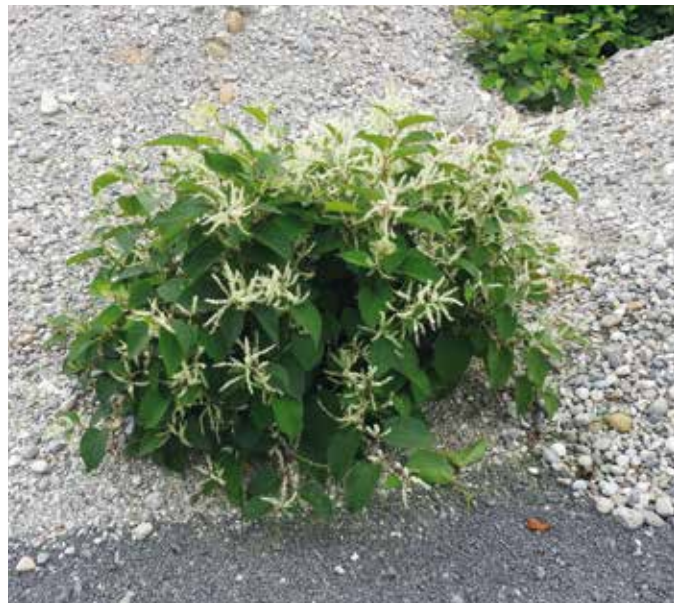
Iz majhnega zraste veliko – iz ene rastline hitro zrastejo celi sestoji izredno invazivnega japonskega dresnika.

Prav vsak od nas lahko s preprečevanjem vnosa ali širjenja tujerodnih vrst v svoje okolje vsaj malo pripomore k njihovega obvladovanju, še posebej pa bi se morali potruditi pri tem, če gre za invazivne vrste. Za konec vam postavljamo še vprašanje: katere tujerodne vrste imate vi v shrambi ali hladilniku in katere krasijo vaš vrt, njivo ali okensko polico?