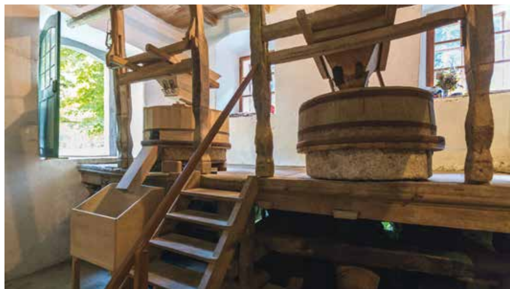
Notranost mlina.

Na vaši kmetiji imate bogato ponudbo prehranskih bio izdelkov. Jo lahko predstavite in kateri proizvod je vaša »prodajna uspešnica«?