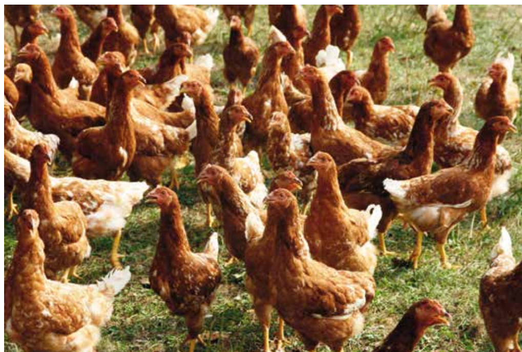
Potrošnik naj sam izbere, saj so vsa jajca jasno označena. Zelo ozaveščen potrošnik pa bo posegal vselej po konzumnih jajcih iz reje v obogatitvenih kletkah, kadar bo pripravljaval toplotno neobdelana živila (kremne rezine, biftek, majoneza ...), ker so ta jajca z vidika higienskega tveganja najbolj varna.

Trgovine, ki neposredno financirajo Inicijativo za dobro počutje živali, iz katerih se direktno podpirajo nemška kmetijska gospodarstva, so: