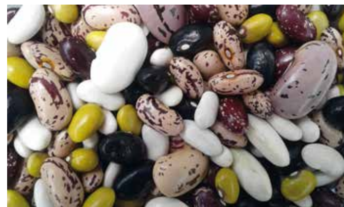
Tudi kmetijske rastline in domače živali so del biodiverzitetne.

Hvala vsem, ki že danes kmetujete tudi z mislijo na varovanje biodiverzitetne.