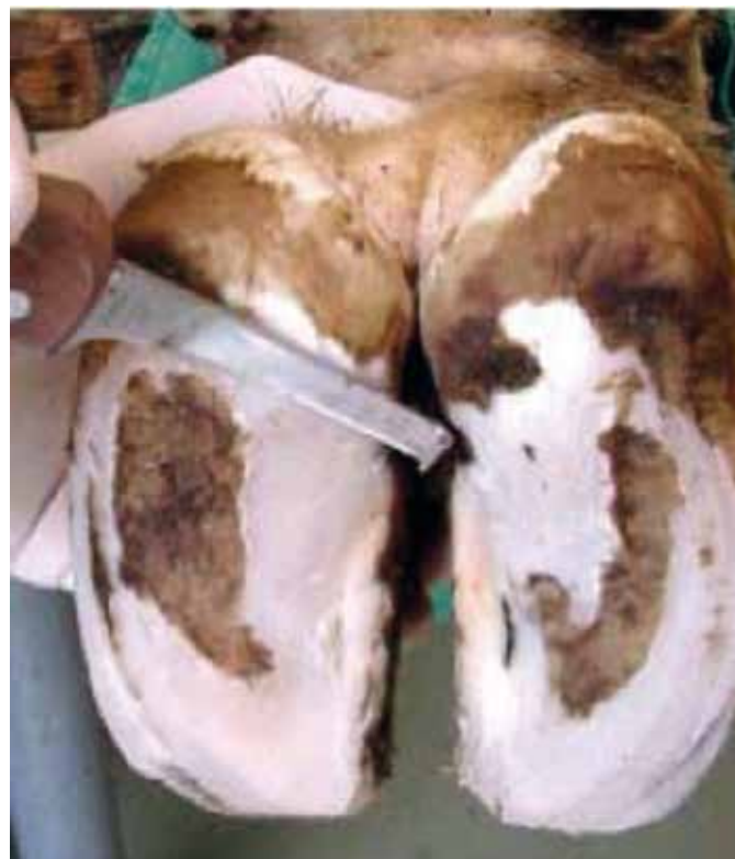
3. korak: izoblikovanje notranjega žleba parklja