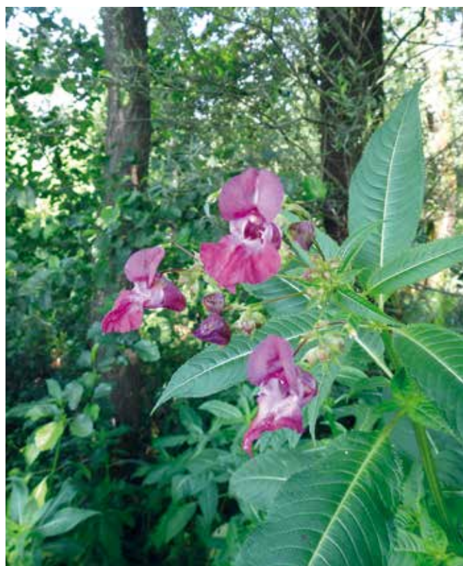
Veliki cvetovi žlezave nedotike so privlačni za oprasovalce, njeni zreli plodovi pa raztrosijo semena zelo daleč.