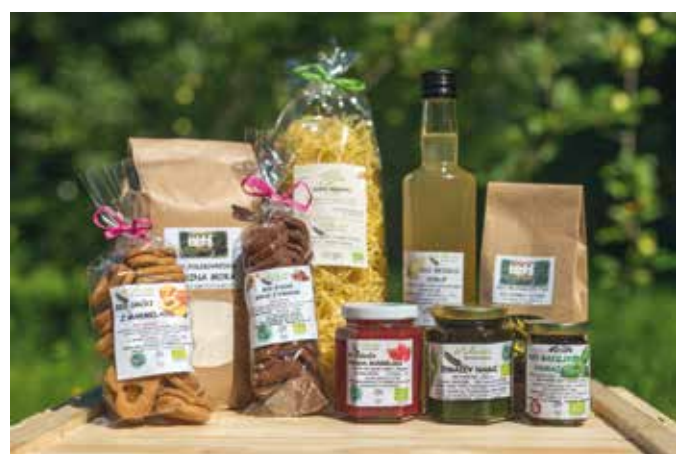
Izdelki kmetije.

Zakaj ste se odločili za ekološko kmetovanje? Ali je k tej odločitvi pripomoglo dej-