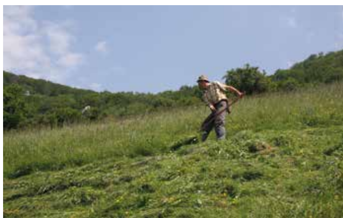
Ročna košnja nad Podkrajem.

Ko morje pisanih cvetov na travnikih rahlo zavalovi v vetru, je občutek, kot da