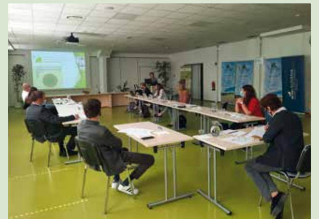
Dobro sodelovanje med obema ključnima organizacijam v slovenskem kmetijstvu se bo nadaljevalo tudi v prihodnje.

Prejšnji teden sta se sestali vodstvi Kmetijsko gozdarske zbornice Slovenije (KGZS) in Zveza slovenske podeželske mladine (ZSPM). Ggre za redne sestanke dveh organizacij, ki zelo dobro sodelujeta. Na začetku so mladi novemu vodstvu KGZS predstavili svojo organiziranost in ključne vodilne predstavnike iz ZSPM.