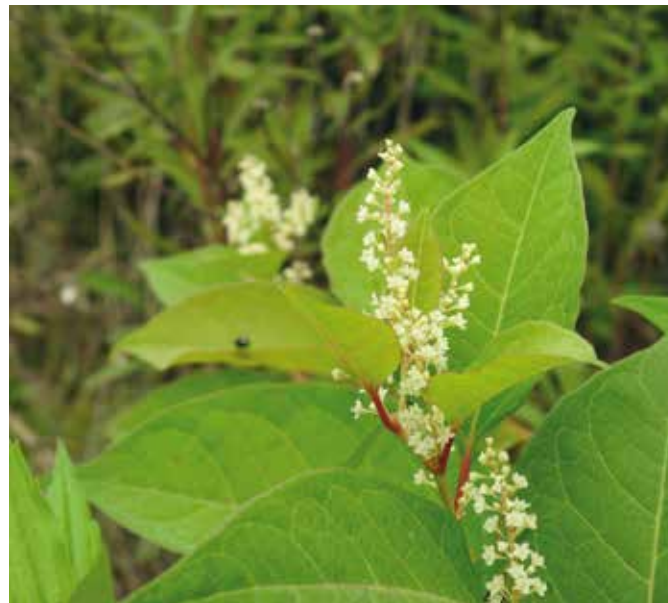
Lepi, veliki listi japonskega dresnika so tudi pripomogli k temu, da se je med ljubitelji rastlin hitro širil.

bavno se je bilo dotikati zrelih plodov žlezave nedotike, ki so se eksplozivno odprli in izvrgli številna semena. A z ukrepi za preprečevanje njihovega širjenja smo žal pričeli prepozno. Na to so nas opozorili šele njihovi negativni vplivi na naše življenje.