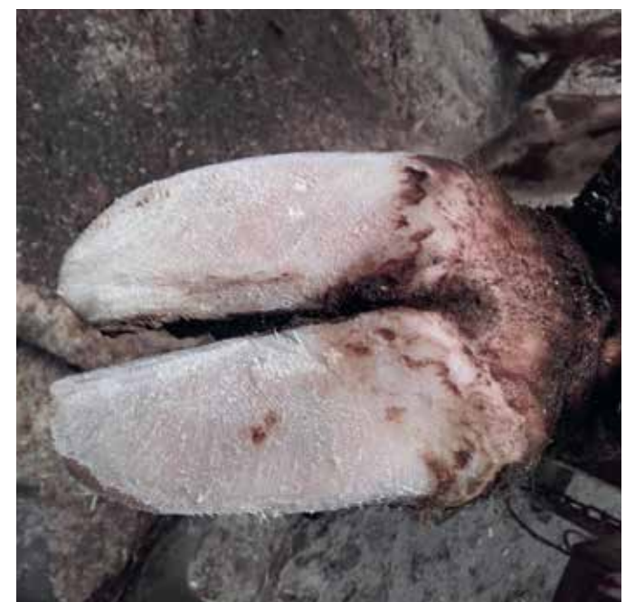
Nepravilno korigiran parkelj krave molznice, kjer se je uporabila zgolj brusilka.

opravilo pač vzeti določen čas. Če najemate storitev obrezovanja parkljev, pa morate biti previdni pri izbiri izvajalca, saj je na trgu kar nekaj ponudnikov, ki delo površno opravijo, in nemalokrat se zgodi, da se po neustrezni preventivni korekciji parkljev delež šepavosti v hlevu poveča.