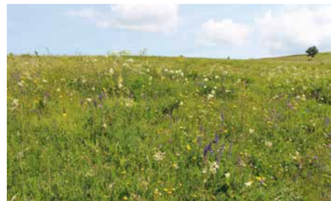
Senožeti na Slavniku.

Bogata vrstna pestrost travnikov ni le lepa na pogled in pomembna za različne organizme, katerim življenjsko okolje predstavlja prav travnik, ampak je lahko tudi dober tržni proizvod. Mleko krav, pasočih se na travnikih z veliko rastlinsko pestrostjo, je namreč kakovostnejše, saj je bogatejše z maščobnimi kisljinami, minerali in antioksidanti. Posledično so poleg mleka kakovostnejši tudi drugi mlečni izdelki, kot je npr. sir. Prav tako je živina na takšnih travnikih zaradi različnih zelišč, ki vsebujejo zdravilne učinkovine, bolj zdrava in odporna na različne bolezni in zajedavce. Posledično je bolj kakovostno tudi njihovo meso. Kakovostnejši izdelki pa so lahko seveda tudi dražji.