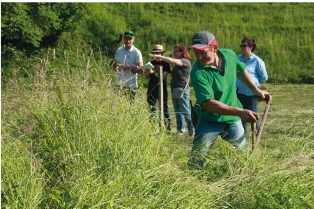
Kdo ve, ali si pri opravi Milan poje: »Dobre kose, mrzle rose, rada trav'ca se kosi ...«

Prevladuje lisasta pasma, ukvarjajo pa se s prirajo mleka. Zato vse telice obdržijo, bikce pa prodajo v tednu do dveh po telitvi.