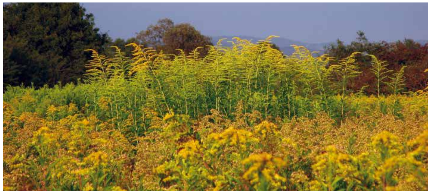
Kjer raste kanadska in orjaška zlata rozga, ni prostora za druge rastline.

Številne domorodne vrste so zaradi invazivnih tujerodnih vrst ogrožene, saj jim invazivke, kakor jim tudi na kratko rečemo, prevzamejo življenjski prostor in izkoriščajo njihove vire hrane