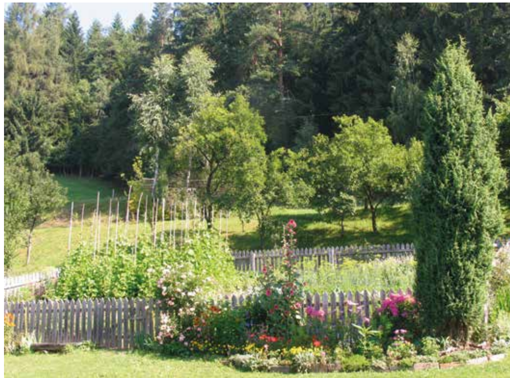
Vrt Muta.

Kmečki vrt se je razvil nekako vzporedno s samostanskimi vrtovi. Sprva so gospodinje, ki so imele veliko dela z običajno številno družino, živino in kmetijo, čim bližje k hiši preselile nekaj najpogostejše uporabljene