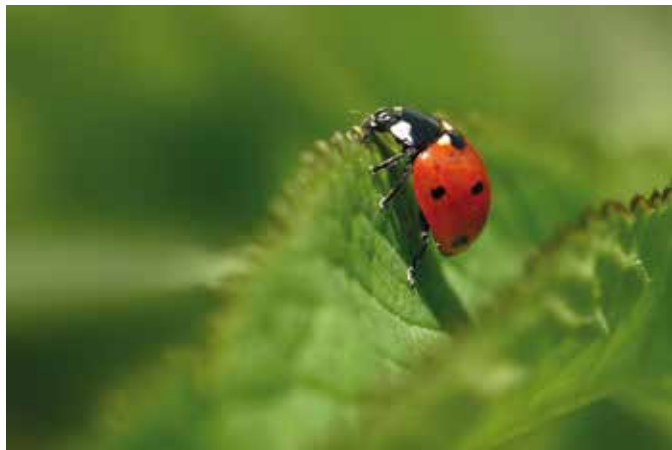
Pikapolonice so pomembne plenilke listnih uši.

mejice in obvodno raste preprečujejo erozijo, popla- ve in suše. Talni organizmi so ključni za rodovitnost tal. Opraševalci zagotavlja- jo opraševanje sadja in dru- gih rastlin. Nekatere druge žuželke, dvoživke, kače, pti- ce in ježi preprečujejo pre- namnožitev organizmov, ki v kmetijstvu lahko povzro- čajo škodo. Tudi del hrane in zdravilnih snovi še vedno dobimo neposredno v na- ravi. In nenazadnje, narava je dragocen prostor miru in oddih, kar so nekateri spo- znali šele v koronačasu.