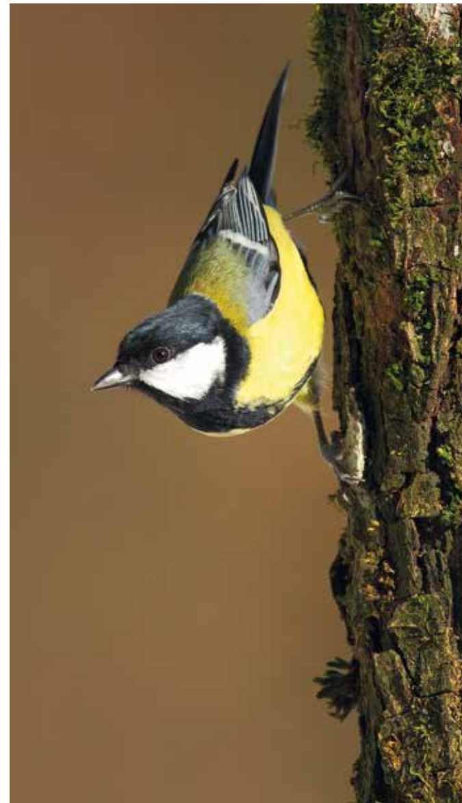
Ptice so dobrodošle pri uravnavanju števila žuželk, ki v kmetijstvu lahko povzročajo škodo.

Z manjšanjem biodiver- zitetne se torej zmanjšuje- ta obseg in kakovost ekosis- temskih storitev. Najbolj vidne posledice v kmetij- stvu so zmanjšana rodovi- tnost tal, slabša odpornost na sušo, nezadostno oprša- evanje in prenamnožitev organizmov, ki v kmetijstvu povzročajo škodo zaradi porušenega ravnovesja v naravi. Vse to zahteva ve- dno več gnojenja, namaka- nja, kontrole škodljivcev in bolezni, kar pomeni doda- ten strošek in hkrati še ve- čji pritisk na okolje.