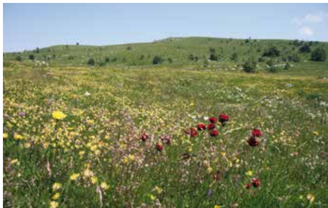
Senožeti v Čičariji.

Ne nazadnje pa je lahko pisan travnik tudi turistični proizvod, katerega lepoto bi prišlo občudovat mnogo tujcev. Oglad travnikov bi lastniki nadgradili s predstavitevijo običajev, povezanih s košnjo in spravilom sena. S trajnostnim in sonaravnim gospodarjenjem bi tako ohranili pisanost travnikov, našo kulturno krajino, običaje in tradicijo.