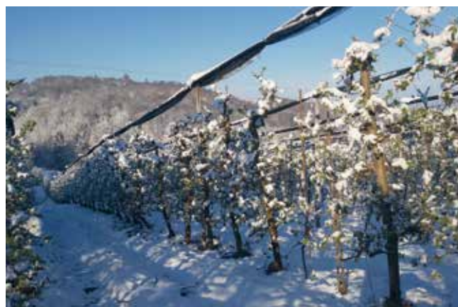
Sadjarjem so izjemno nizke temperature v začetku aprila povzročile ogromno škodo in pahnile panogo v nezavidljiv položaj, večino sadjarjev pa tudi v hudo finančno stisko.

Posledično je 2018 sledila nenormalno obilna letina, ko sadja ni bilo mogoče prodati, odkupne cene pa so bile tako nizke, da niso pokrile niti obiranja. V letu 2019 je sledila količinsko slabša letina, vendar s sprejemljivimi odkupnimi cenami. V letu 2020 pa jim je spomladanska pozeba ponovno pobrala velik del pridelka. V jeseni 2020 se je zgodil drugi val epidemije, ki je skoraj povsem zaustavil prodajo. Ob dokaj polnih hladilnicah sadja (večinoma jabolok), ki ga ni mogoče prodati, je letos ponovno udarila še pozeba.