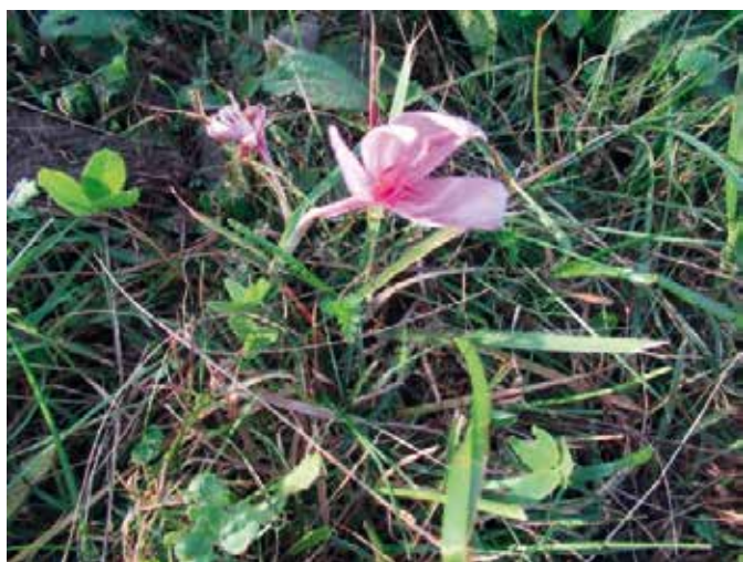
Jesenski podlesek cveti med septembrom in novembrom.