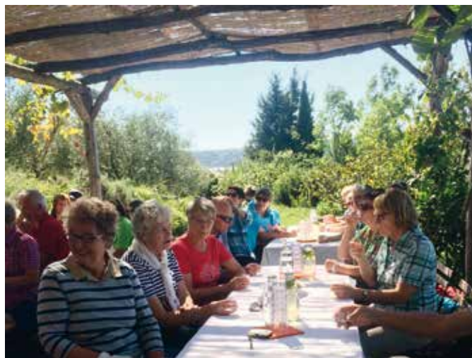
Pod enostavnim pokritim prostorom sredi oljčnikov s pogledom na Sečoveljske soline sprejemajo skupine.

Skupine otrok, pa tudi drugih, sprejemajo kar v oljčniku.