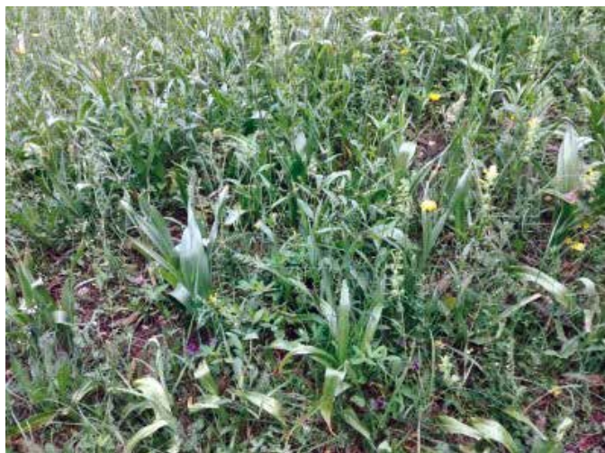
Jesenski podlesek v maju – ima največ listov.