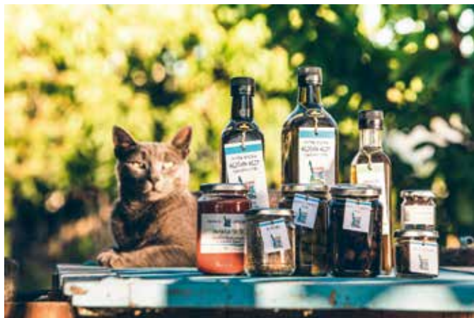
Nabor oljčnih dobrot kmetije Gramona

Pri oljkah predstavljata večino istrska belica in leccino, v manjšem deležu pa še nekaj