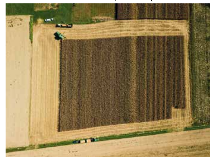
Žetev koruze za zrnje, ki je bila vključena v sortne poskuse.