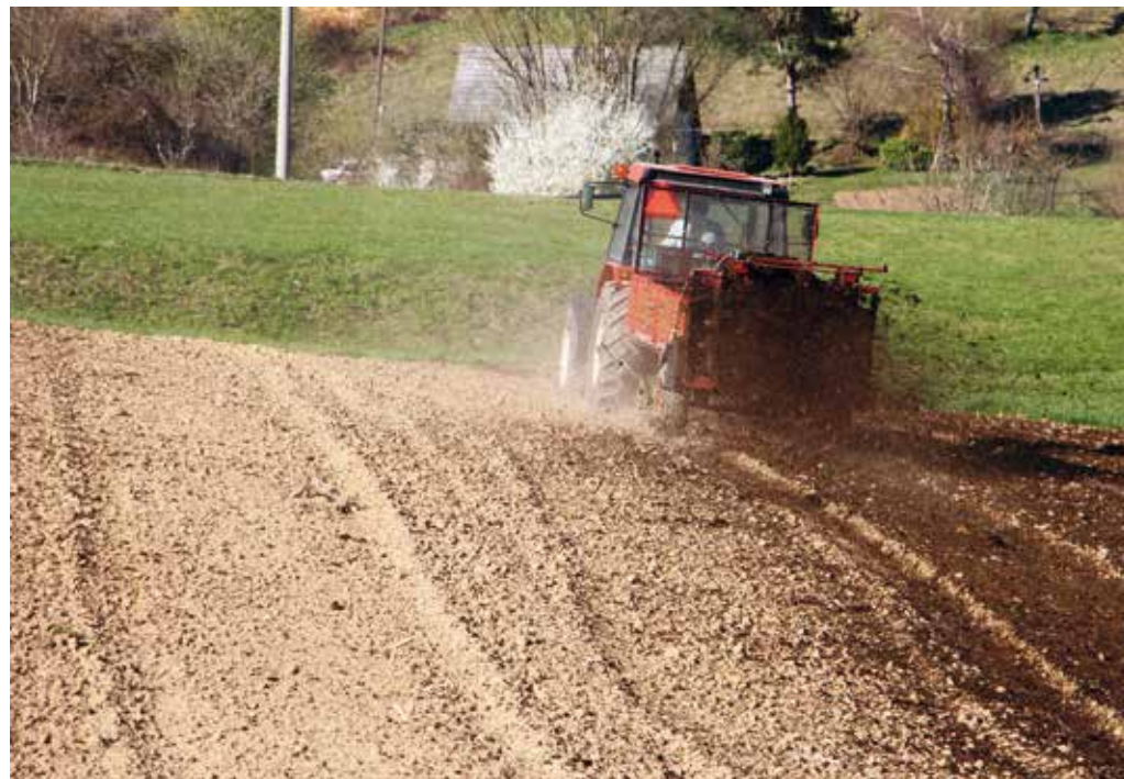
Na pobudo KGZS je bil v letu 2018 odprt razpis za majhne kmetije, ki je podprl okoli 4.000 manjših kmetij in pomembno prispeva k ohranitvi poseljenosti in obdelanosti težje dostopnih območij.

Na pobudo KGZS je bil v letu 2018 odprt razpis Pomoč za zagon dejavnosti, namenjen razvoju majhnih kmetij, pod-