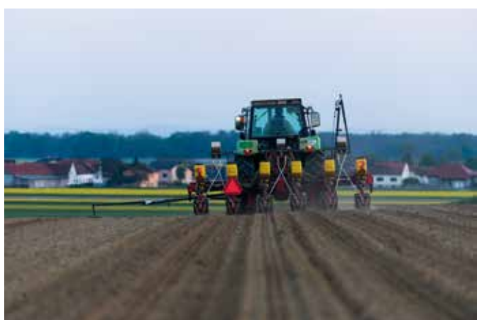
Setev oljnih buč se opravi v začetku maja.

pe SKP, jih potem spremenimo. To se ne bi smelo dogajati. V takih razmerah se je težko odločiti, kako naprej,« zaključuje mladi prevzemnik Denis.