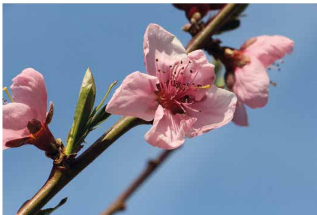
KGZS je dosegla dvig stopnje sofinanciranja zavarovalne premije na 50 % za vse posevke, nasade in plodove in na 30 % za bolezni živali.

nja zavarovanj KGZS je dosegla dvig stopnje sofinanciranja zavarovalne premije na 50 % za vse posevke, nasade in plodove in na 30 % za bolezni živali.