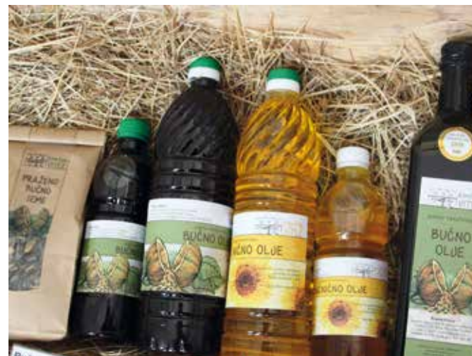
Odlično bučno in sončnično olje domače pridelave in predelave ter bučne semenke najdejo pot do kupcev, ki vedo, kaj je kakovost.

Pred sedmimi leti so prenehali s pitanjem in se posvetili predvsem poljedelstvu, za lastne potrebe pa imajo še skoraj 30 arov vinograda: 1150 trsov renskega in laškega rizlinga in sauvignona. Vinograd je na Suhem vrhu, kjer so začetki širnega in hribovitega Goriškega, in je od kmetije oddaljen 2 kilometra.