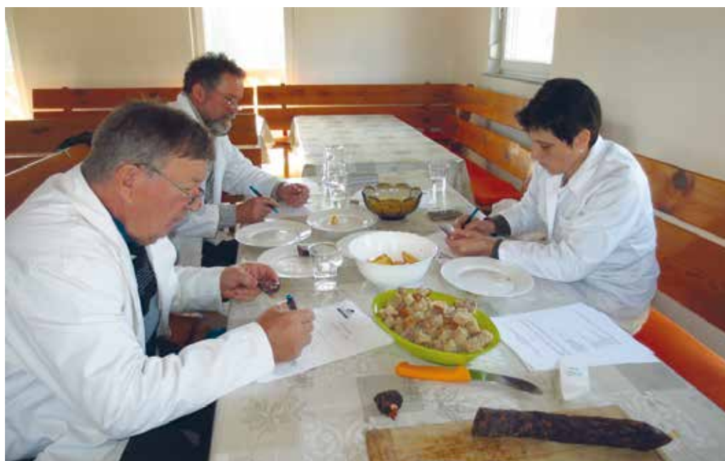
Komisija je imela prijetno, a težko nalogo, da med 47 izdelki izbere najboljše.