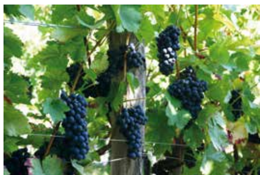
Lanska letina grozdja je bila izjemna, pri rdečih sortah še bolj kot pri belih.

Povprečni pridelek jabolk je znašal 37,2 tone na hektar, kar je za 53 % več od desetletnega povprečja. Tudi v ekstenzivnih sadovnjakih je bila letina večine sadnih vrst v 2018 nadpovprečna. Največji je bil pridelek jabolk, skoraj 80 kilogramov na drevo, kar je dvakrat več kot v zadnjih desetih letih.