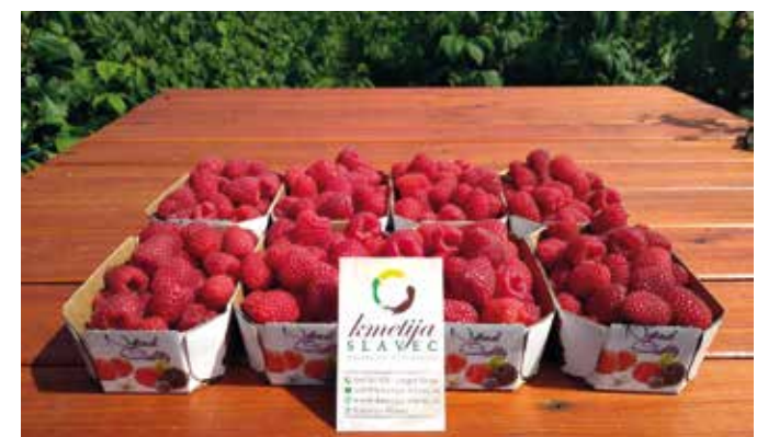
Gregor pri prihodkih kmetije stavi na pridelavo malin.