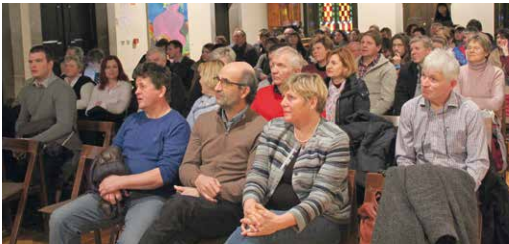
Na občnem zboru Združenja kmečkih sirarjev Slovenije se je v gradu Dobrovo v Goriških Brdih zbralo okoli 70 kmečkih sirarjev.

Smernice lahko sirarji brezplačno dobijo na spletu in jih začnejo uporabljati. Izobraževanje ni potrebno, bo pa Združenje kmečkih sirarjev Slovenije v letu 2020 pričelo z izobraževanjem, ki bodo prilagojena potrebam sirarjev.