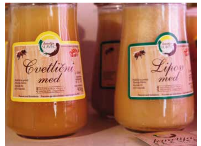
Čenjen pridelek na kmetiji sta cvetlični in lipov med, ob dobri letini se pridruži še gozdni.

Želi tudi povečati in zaozkrožiti kmetijo. Razdrobljenost in majhne parcele so res velika težava. Že nasad malinjaka je značilen primer: »Parcela je široka manj kot 8 metrov, dolga pa več kot 150. Povečevanje kmetije zavira neurejenost lastništev, prav tako težko zaozkroži eno celoto kot uporabno površino,« pove Gregor in nadaljuje: »Stvari se premikajo, vztrajnostjo se da narediti marsikaj. To pa ni dovolj, potrebno je strokovno znanje, poznavanje zakonodaje in možnosti, ki jih nudijo razpisi v okviru skupne kmetijske politike. Zato sem hvaležen za vso pomoč, ki mi jo pri razvoju kmetije nudijo na kmetijski svetovalni službi.«