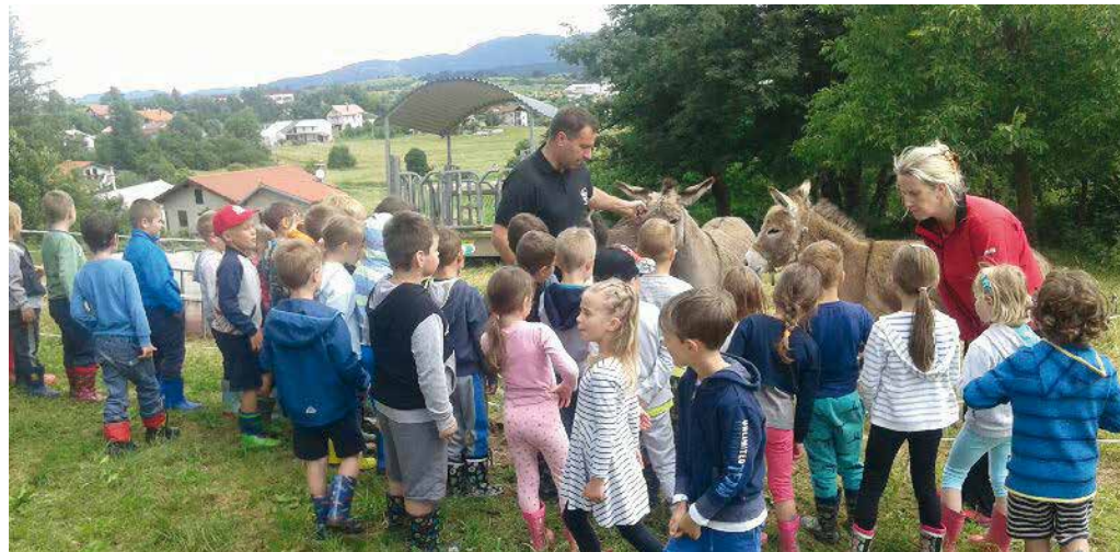
Z obiskom kmetije lahko otroci dobijo neposreden stik z živalmi.

stopila recesija, ki je še zlasti razrezala v gradbeništvo, je ugotovil, da to ni zanj in da ga vse bolj privlači narava. Že ob službi v podjetju Laris je začel kmetovati. Najprej je dobil v dar tri koze burske pasme, potem pa