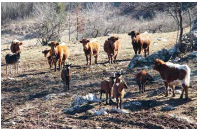
Cike, srnaste koze, istrski osli so le nekateri člani pisane družine živali na kmetiji.