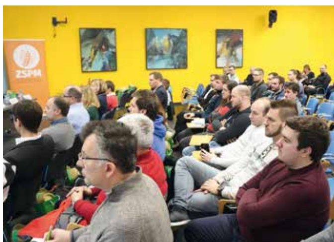
Zanimanje za predavanje o varnosti na kmetiji je bilo veliko.