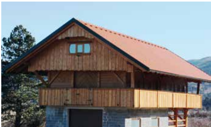
Konec lanskega leta zgrajen večnamenski objekt bo omogočil lažje delo in razvoj novih dejavnosti na kmetiji.

stopila recesija, ki je še zlasti razrezala v gradbeništvo, je ugotovil, da to ni zanj in da ga vse bolj privlači narava. Že ob službi v podjetju Laris je začel kmetovati. Najprej je dobil v dar tri koze burske pasme, potem pa