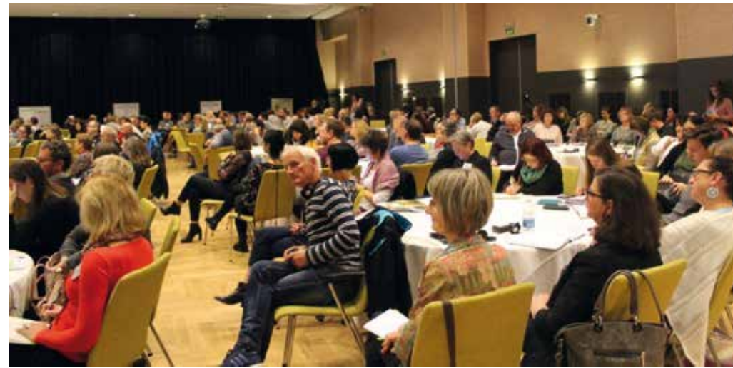
Tudi drugi dan posveta je bilo zanimanje zelo veliko.

nost, zaradi starostne strukture tako svetovanje kot tudi uporabnikov. In prav zaradi tega je toliko bolj pomembno, da bomo digitalizacijo uvajali postopoma, korak za korakom. Neposredno osebno svetovanje