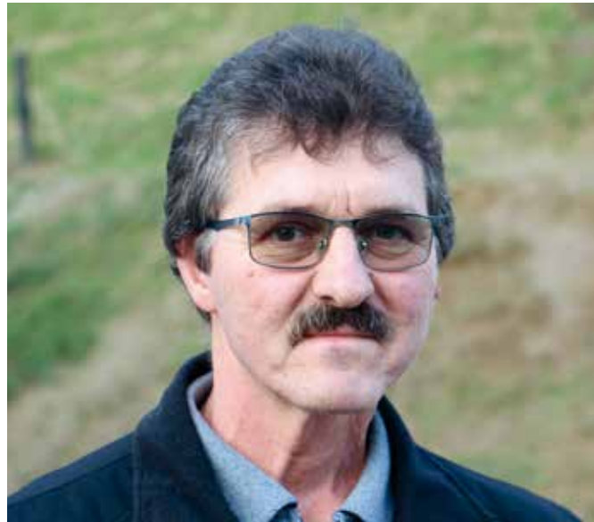
Kmetija Perko se nahaja v Spodnji Velki v Slovenskih goricah, le nekaj kilometrov od avstrijske meje. Ukvarjajo se z govedorejo in vinogradništvom. V hlevu imajo okrog 200 bikov, vina: 'sauvignon', 'sivi pinot', 'rumeni muškatac', zvrst Snežičan in arhivska vina, pridelujejo na dveh hektarjih.

Zato je treba doseči spremembo ZMVN-1 tako, da se model vrednotenja stavbnih zemljišč popravi in da se poleg namenske rabe zemljišč upošteva pri njihovem vrednotenju tudi razvojna stopnja. Do zagotovitve podatkov o razvojni stopnji tako posplošena vrednost ne sme biti uporabljena.