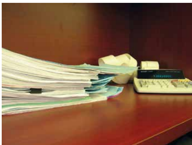
KGZS lajša težave svojim članom, ki imajo opravka z vse bolj zahtevno administracijo.

Odbor za kmetijstvo, gozdarstvo in prehrano v Državnem zboru je povzel naš predlog in sprejel pobudo, da vlada oziroma Ministrstvo za kmetijstvo, gozdarstvo in prehrano izdelata akcijski načrt za digitalizacijo v kmetijstvu, v katerem se opredelijo vsi ukrepi, nosilci, roki in viri finančnih sredstev. Prav tako mora MKGP poskrbeti za vlaganja v digitalizacijo javnih služb v kmetijstvu.