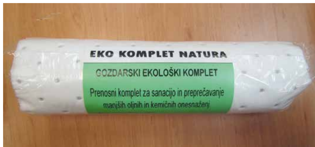
Komplet za primer izlitja olja, s katerim mora biti po Pravilniku o varstvu gozdov opremljen vsak stroj, ki dela v gozdu

ministrativnih postopkov RCG PEFC, sledil je pregled izbranih gozdnih posesti na terenu ter administrativni pregled preostalih izbranih gozdnih posesti. Pri administrativnem pregledu se trajnostno gospodarjenje z gozdno posestjo oceni samo na podlagi razgovora z revirnim gozdarjem in lastnikom ter vpogledom v razpoložljivo dokumentacijo in javno dostopne podatke. Za certifikacijski organ sta letno presojo izvajala gozdarska strokovnjaka iz Slovenije in Hrvaške. Presoja je zajela 15 gozdnih posesti. Na terenu se je pregledalo 12 gozdnih posesti, od tega dve, ki jih je KGZS že pregledala v prejšnjih letih. Na treh gozdnih posestih sta ocenjevalca certifikacijskega organa ocenjevala predstavnika KGZS, kako izvajata terenski pregled gozdnih posesti. Pri treh gozdnih posestih pa se je še izvedla administrativna kontrola. Ocenjevanja so se izvajala v desetih gozdnogospodarskih območjih. Pri ocenjevanju izvajanja RCG PEFC je certifikacijski organ KGZS izpisal pet manjših neskladnosti, ki so bile vse odpravljene do konca avgusta oziroma pred določenim rokom za njihovo odpravo.