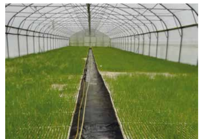
Sadike pora in zelja pridelujejo sami v lastnih rastlinjakih.

Glede na zastavljeno dejavnost izzivov ne bo manjkalo. »Po pravi korenja za trg, ki mora biti kalibriran in brez vidnih poškodb, ostane precej korenja, zato načrtujemo, da bi do leta 2021 vzpostavili predelavo korenčka kot dopolnilno dejavnost. Veliko pozornosti bomo posvečali stalnemu izpopolnje-