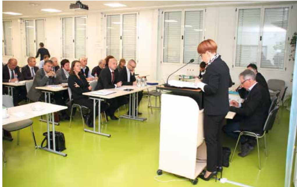
KGZS pri svojem delu sodeluje tako z Ministrstvom za kmetijstvo, gozdarstvo in prehrano kot z Ministrstvom za okolje in prostor.

Vse več kmetov, prejemnikov pokojnin na podlagi zavarovanja za pretežno ožji obseg, pre-