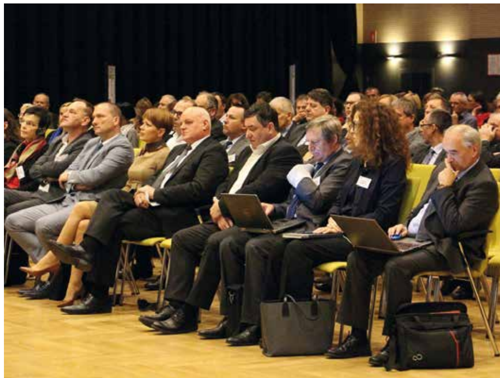
Vsako leto posvet JSKS pritegne pozornost pomembnih gostov iz Slovenije in tujine.

Ministrica za kmetijstvo, gozdarstvo in prehrano dr. Aleksandra Pivec je ob začetku posveta poudarila pomen kmeta kot skrbnika slovenskega podeželja in pridelovalca hrane ter njegovega vpliva na varno, dostopno in kakovostno hrano. Ob tem je pomembno kreiranje takšne kmetijske politike, ki omogoča ne samo preživetje, temveč tudi razvoj slovenskega kmetijstva. Širina vprašanj zahteva iskanje sinergij in celostni pristop na področju vseh politik. V svojem uvodnem nagovoru je ministrica pohvalila dosedanje sodelovanje Kmetijsko