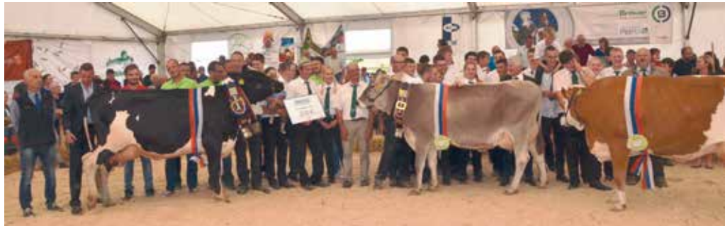
Razstava je prikazala lep napredek vseh treh pasem govedi.

Moči so združili govedorejci iz Govedorejskega društva Litija in Živinorejskega društva Zagorje v sodelovanju s službami Kmetijsko gozdarskega zavoda Ljubljana, ob podpori treh kmetijskih zadrug iz Izlak, Litije in Trebnjega ter nenazadnje podpori občin Litija, Šmartno pri Litiji in Zagorje ob Savi