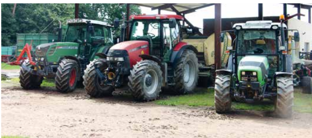
Sodoben strojni park sedaj omogoča opravljanje pestre palete strojnih storitev, dobri stari IMT pa ima še vedno domovinsko pravico na kmetiji.

Na kmetiji tako na petih hektarjih spet raste »cukerca«. In letošnji obeti pridelka? »Zelo dobri, če bo po sreči, bo pridelek