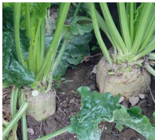
Sladkorna pesa se vrača na slovenska polja.