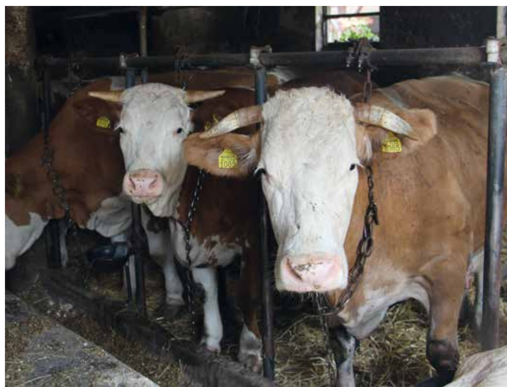
Na kmetiji redijo lisasto pasmo.