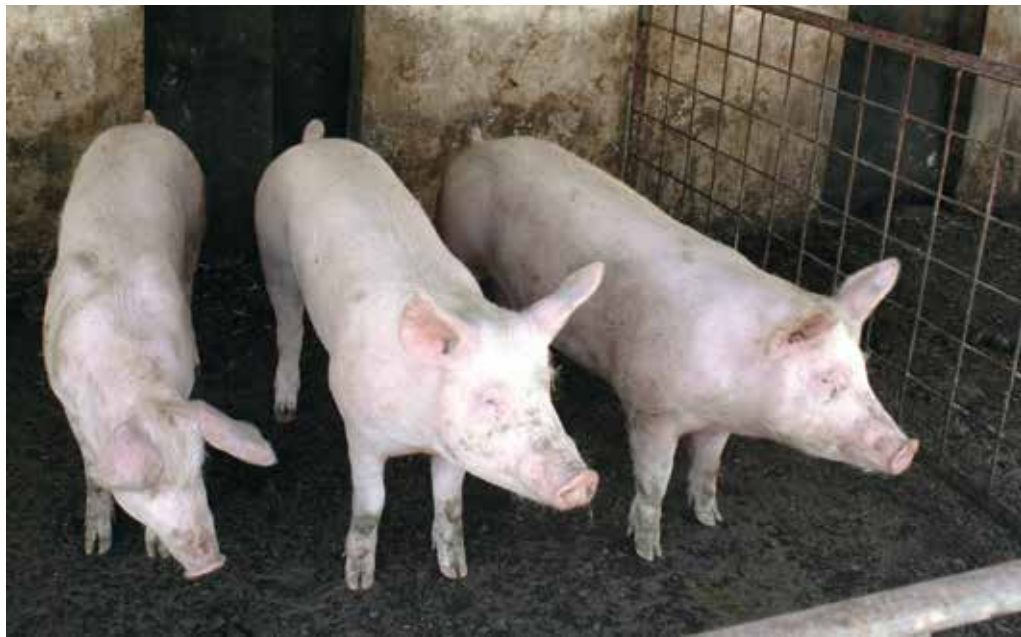
V primeru izpustov prašičev na kmetiji je treba dosledno skrbeti, da domači prašiči ne bi prišli v stik z divjimi (ograje).

Podrobnejše napotke v glede ravnanja, da ne bo prišlo pri nas do pojava APK, lahko preberete na spletni strani www.kgzs.si pod rubriko Ne spreglejte.