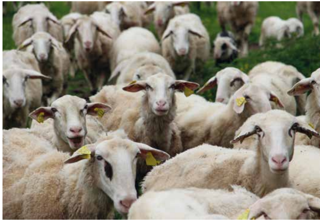
Kako tudi s promocijo povečati porabo jagnjetine in drugega mesa drobnice.

Obstaja alternativa: neposredno trženje kakovostnega izdelka majhnega proizvajalca. Ta način je vsekakor težji od preproste prodaje klavnih jagnjet v klavnico, vendar ponuja nove ekonomske priložnosti. Majhen rejec postane spretan v osnovnih marketinških veščinah, brez kompromisa zagotavlja kakovost izdelka in se je pripravljen prilagoditi spreminjajočemu se povpraševanju kupcev. Končni rezultat je zmožnost ponujanja odličnega izdelka porabniku, ki bo lahko plačal zaračunano dodano vrednost. Majhen proizvajalec lahko na lokalnem trgu zaračuna celotno maloprodajno ceno izdelka in upa, da bo upravičila stroške dela in ostale stroške. S povratnimi informacijami kupcev je končno lahko tudi majhen proizvajalec zadovoljen s prodajo lastnega kakovostnega izdelka, ki ga ne najdemo na drugih trgih. Neposredno trženje ima tudi svoje pomanjkljivosti. Za neposredno trženje izdelka majhen proizvajalec porabi veliko časa in energije. Pogosto je majhen proizvajalec kmalu preobreme-