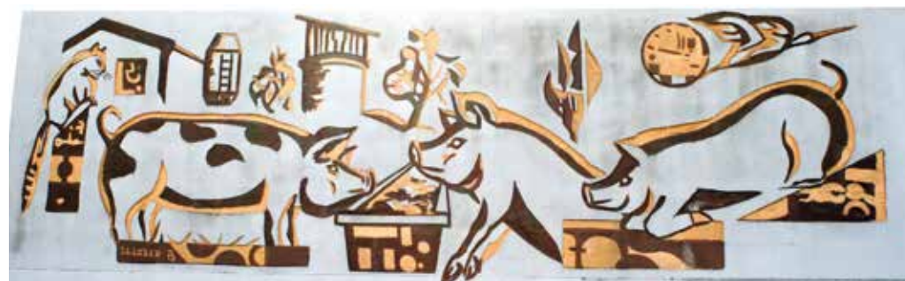
S poslikavo na hlevu in strojni lop z malo sončno elektrarno so poskrbeli, da je videz bolj prijazen.

Glavna panoga na kmetiji je prašičereja, okrog 70 plemenskih svinj linije 12 (slovenska landrace x slovenski veliki beli prašič) je v hlevu. Sodelujejo z osemenjevalnim centrom KGZS – Zavoda Murska Sobota, kjer kupujejo merjaščevo seme. Za boljšo mesnatost poskrbijo plemenjaki pietrain pasme. Skupno je na kmetiji 500 do-