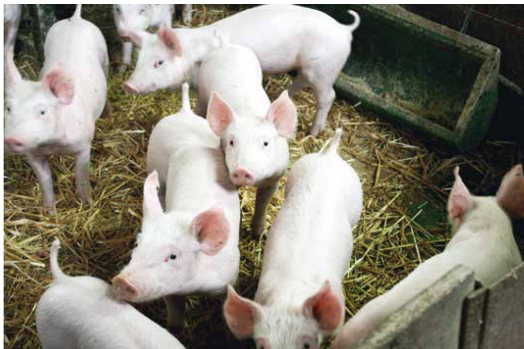
Temelj kmetije predstavlja prašičereja – zaključen krog od plemenske reje do prodaje spitanih prašičev.