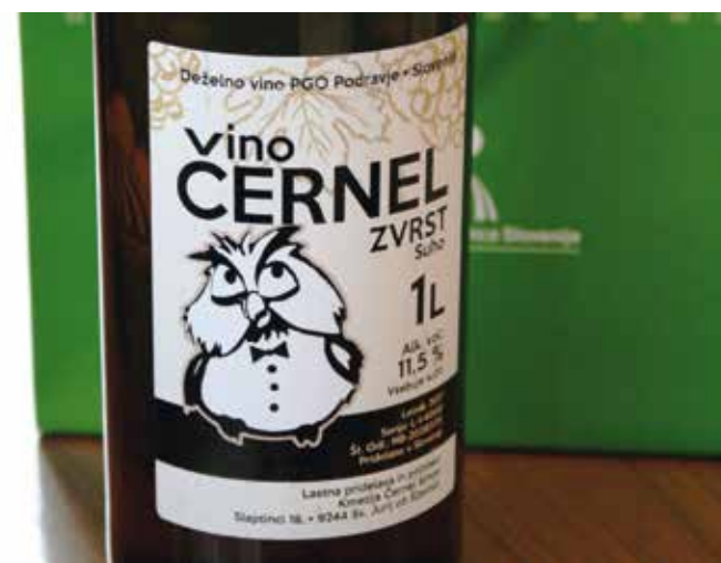
Vino z dveh hektarjev vinograda v pretežni meri prodajo kot zvrst – Vino Černel poimenovano.

Med načrti je izpostavil obnovo petih streh na kmetiji,