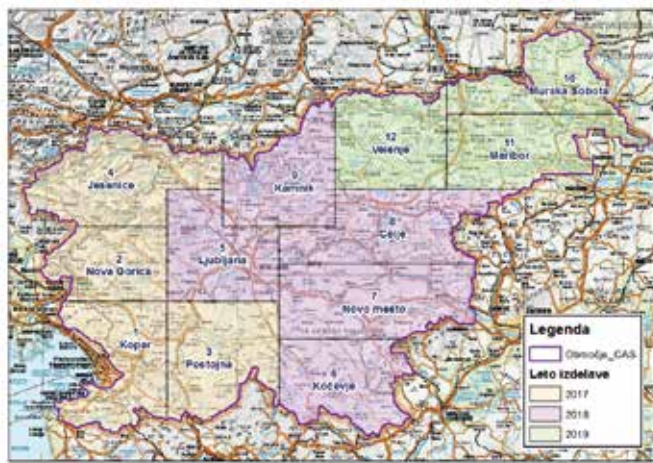
Prikaz izdelave letalskih posnetkov (ortofoto posnetki). Rumeno označeno območje, ki je bilo poslikano v letu 2017, je osnova za ureditev GERK-ov, ki jih boste uveljavljali na vlogah za leto 2018.