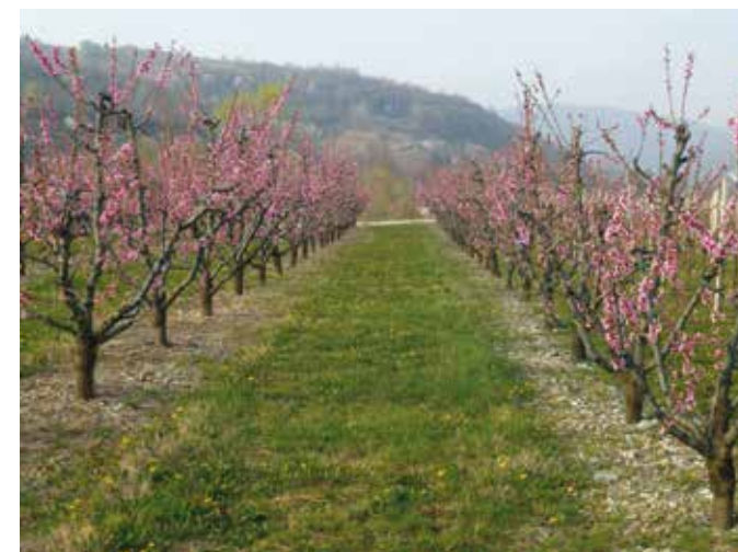
Ko pride pomlad, se Brda odenejo v rožnato.

Ne glede na povedano pa zrejo Sirkovi z optimizmom v prihodnost. Pri delu bo s sredstvi ukrepa mladi prevzemnik v pomoč pomlajen strojni park, pri spopadu z birokracijo pa briška izpostava kmetijske svetovalne službe in svetovalci specialisti KGZS – Zavoda Nova gorica.