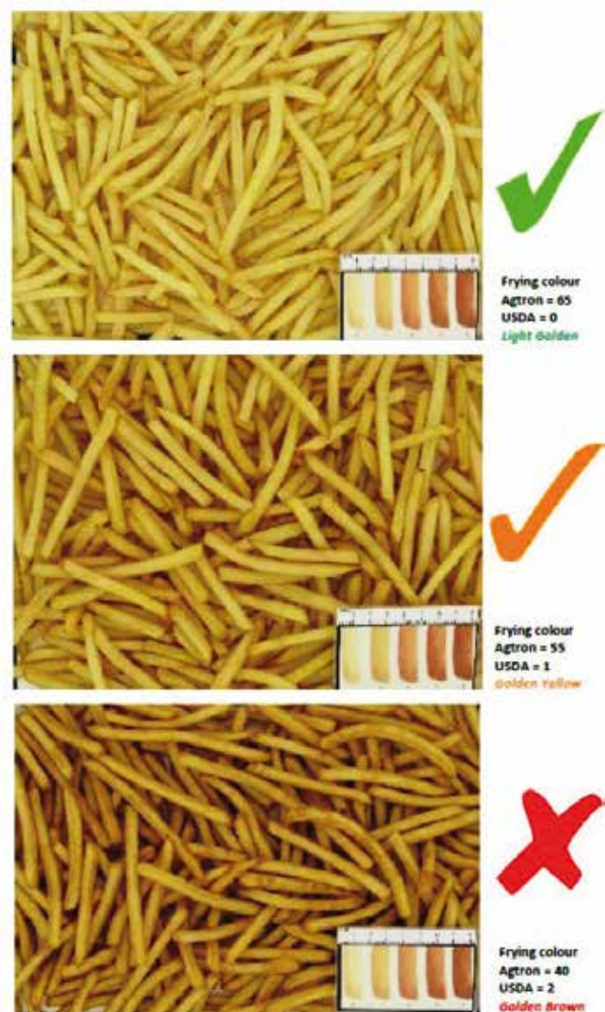
Barvna lestvica zapečenosti pomfrita (EU potato processors association)

v prostorih, v katerih osebe pripravljajo živila.