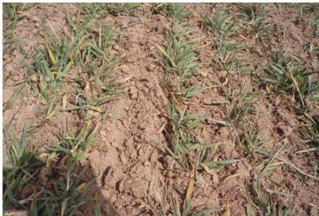
Prehrano ozimin poleg z dodajanjem gnojil izboljšujemo tudi s česanjem posevkov, s čimer obenem zmanjšujemo zapletenost.

Zgodnje dognojevanje torej povzroča pospešen začetek spomladanske rasti. Pri pravilnem izvajanju gnojenja pa je najprej potrebno upoštevati zakonsko predpisane časovne omejitve.