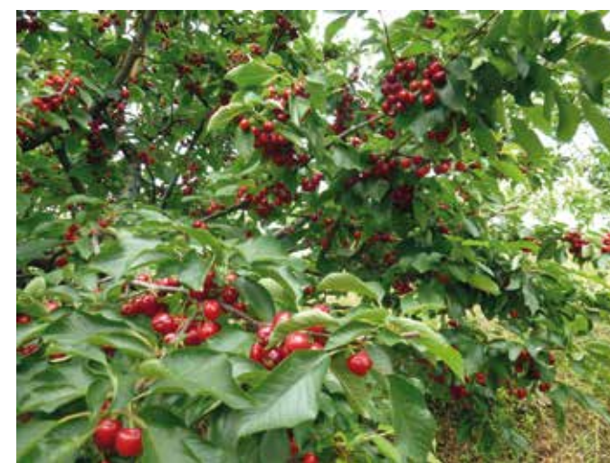
Kdo si ob pogledu na briške češnje ne bi zapel tiste: »Rdeče češnje rada jem ...«

sem spoznal Mojco, ki je bila pripravljena priti med briške vinograde in sadovnjake z Dolenjske,« se nasmehne 30-letnik, ki mu optimizma ne manjka.