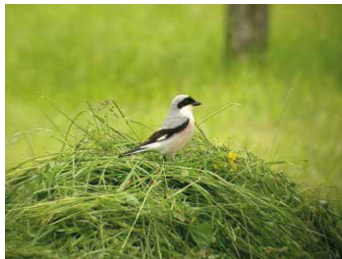
S prilagojeno kmetijsko prakso se ne ohranjajo le ogrožene vrste in njihovi habitati, temveč tudi dobrobiti, ki jih ljudem nudi narava.

Določene so nižje ciljne površine KOPOP, na katerih naj se izvaja prilagojena kmetijska praksa, kot je dejanska skupna površina travnikov, ki jih je treba ohranjati. Zato naj Zavod RS za varstvo narave