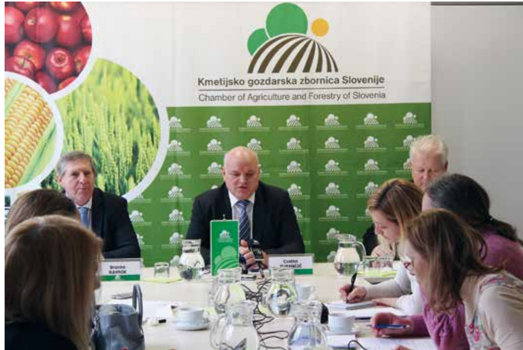
Vodstvo KGZS je predstavilo uspešno delo v letu 2017 in načrte za leto 2018.

Na KGZS opozarjajo, da je treba spremeniti nacionalno zavest in ravnanje pri posegih v prostor, spoštovati že sprejete mehanizme, čim prej vzpostaviti trajno varovana zemljišča,