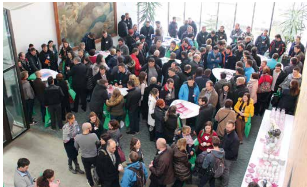
Na tretjem srečanju mladih prevzemnikov v Hočah se je zbralo veliko število mladih kmetov.

O pomenu mladih kmetov so govorili tudi drugi govorniki in so-