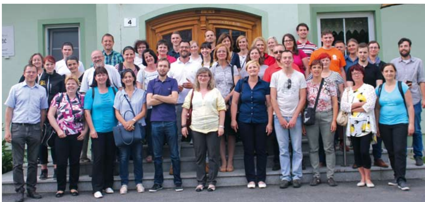
Velika delegacija slovenskih kmetijskih organizacij na obisku na kmetiji Janežič prek slovensko-avstrijske meje