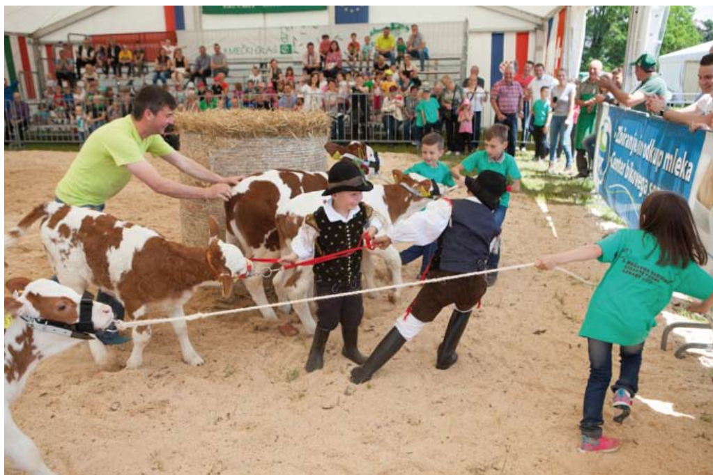
Prvo dejanje razstave je bilo tekmovanje otrok v vodenju telet za pokal Liska, kjer je sodelovalo 18 otrok. Nekateri prijavljeni so bili še predšolski in so v krogu potrebovali pomoč starejših bratov ali sester.

Glavnino dela pri oskrbi živali so prevzeli mladi rejci, pri čemer je treba posebej izpostaviti mlade rejce iz območja KGZS - Zavoda Ljubljana in članke letos ustanovljenega Društva mladih rejcev govedi Podravja. Oboji so opravili tudi ogromno dela pri striženju odbranih živali na terenu.