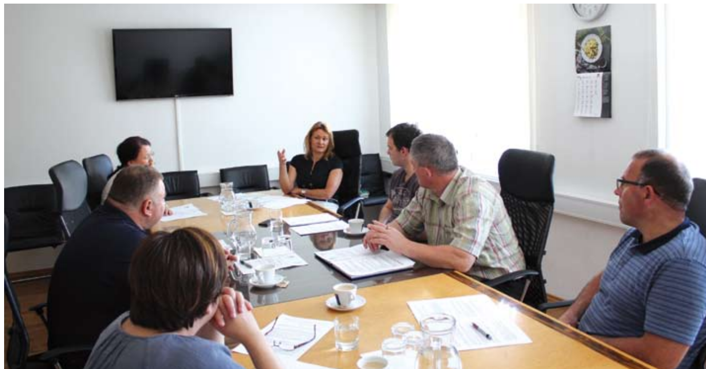
Prek strokovnih odborov lahko člani KGZS predstavijo težave na posameznem strokovnem področju in predlagajo rešitve.

Za sladkorno peso, pri kateri poteka pridelava na 75 ha in jo prideluje 38 pridelovalcev, je KGZS pripravila tehnološka navodila. Za odkup vseh pridelanih količin je bila pod-