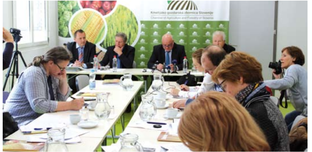
Vodstvo KGZS je na novinarski konferenci predstavilo zahtevo po interventnih zakonih zaradi pozebe in podlubnikov.