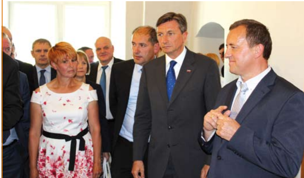
Razstavo na Ptuj si je ogledal tudi častni pokrovitelj predsednik Republike Slovenije Borut Pahor.