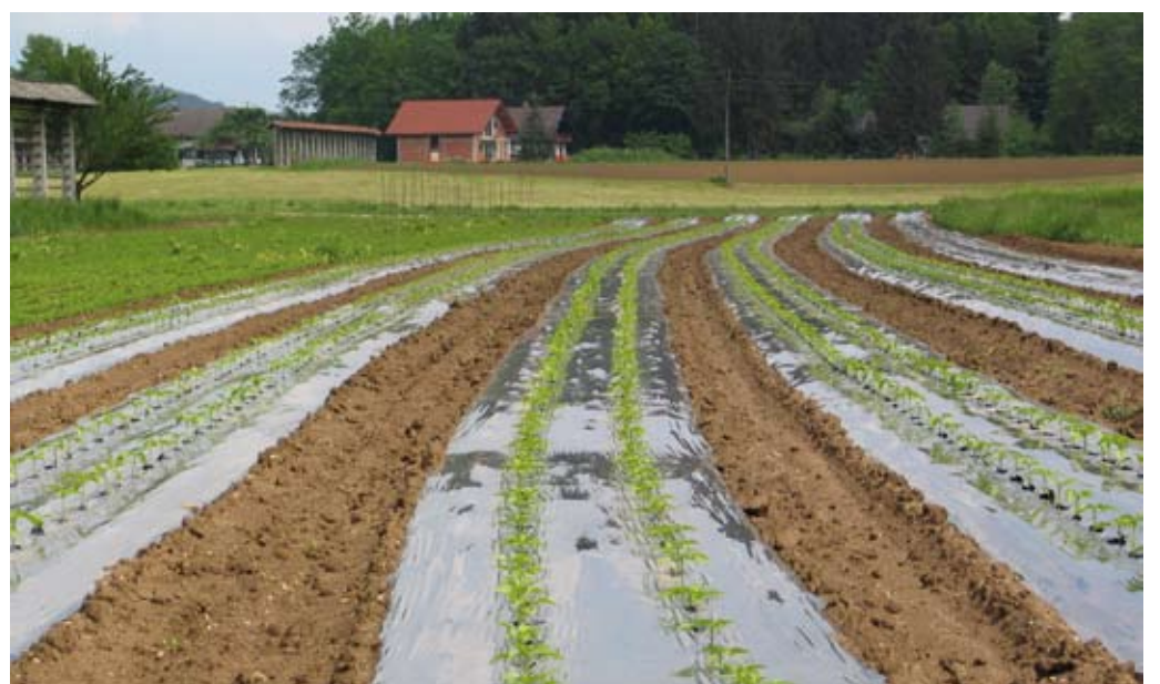
Od določitve dejanskega uporabnika je torej odvisno, komu se bo katastrski dohodek všteval v davčno osnovo.

Rok za vložitev vloge za določitev dejanskega uporabnika je 15. julij za tekoče leto, torej 15. julij 2017 za letošnje davčno leto; vlogo se upošteva pri izračunu davčne obveznosti za leto 2017, in sicer v pomladi 2018. Vlogo se vložijo pri uradu FURS, kjer ima vlagatelj vloge oziroma zavezanec za plačilo davka svoje stalno prebivališče.