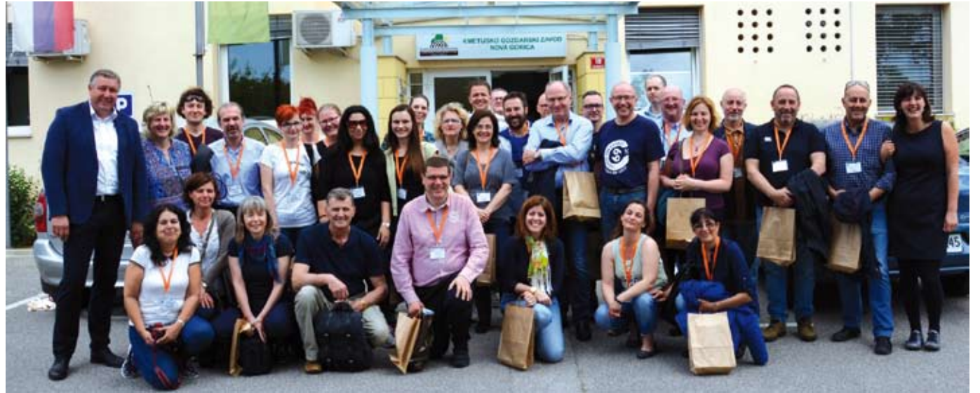
Usposabljanja na KGZS – Zavodu Nova Gorica se je udeležilo 34 udeležencev iz 19 evropskih držav in Mehike.

bavitelja. Sledila je predstavitev sheme z možnimi načini in potmi za identifikacijo in registracijo goveda. V nadaljevanju je bilo predstavljeno še poglavje o identifikaciji in registraciji drobnice in prašičev, ki se v osnovi nekoliko razlikujeta od predstavljenega načina pri govedu. Razlika je opazna predvsem v tipu ušesnih znamk, možnosti tetoviranja določenih živali in uporabljenih obrazcih. V razpravi, ki se je razvila po predavanju, so na zastavljena vprašanja poslušalcev družno odgovarjali tako strokovnjaki iz novogoriškega zavoda kot tudi predstavniki Uprave za varno hrano, veterinarstvo in varstvo rastlin (UVHVVR) oziroma Sektorja