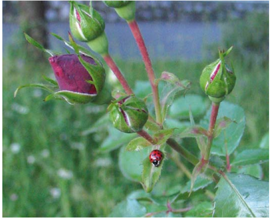
Ekološko kmetovanje je lahko nova priložnost na vaši kmetiji.

Po prijavi na izbrano kontrolno organizacijo do 31. decembra letos lahko naslednje leto pri vnosu zbirne vloge za vašo kmetijo vložite zahtevek za iz-