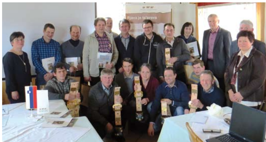
Nagrajeni rejci in živinorejski strokovnjaki, ki se ukvarjajo z govedorejo