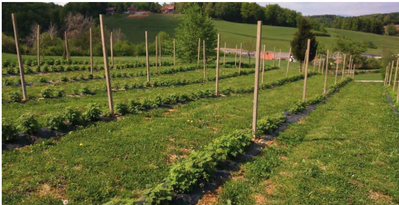
Za ekološko pridelavo so najboljši rahlo nagnjeni tereni z možnostjo odtoka hladnega zraka.

- Priprava tal lahko glede na zahteve posamezne sadne vrste in lastnosti tal traja tudi dlje od enega leta. Osnova načrta za pripravo tal so rezultati kemične in fizikalne (tekstura) analize tal in podatka o globini rodne zemlje. Preverimo tudi, ali je prisotna nepropustna plast tal, ki bi zadrževala vodo na območju korenin. Pred sajenjem poleg ostalih ukrepov (potrebnih glede na lastnosti tal) opravimo založno gnojenje z gnojili, dovoljenimi v ekološki pridelavi. Pred sajenjem je s površine potrebno odstraniti trajne