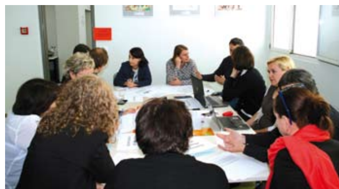
Predavanje je bilo zanimivo tudi zaradi delavnic, na katerih so udeleženci iskali rešitve za razvoj ekološkega kmetovanja.

Pomembno je urediti prenos informacij in težav s terena do raziskovalcev. Za prihodnje obdobje se kot eno od orodij za ukrepanje izkoristi potencialne ukrepe programa razvoja podeželja, ki nudijo neizkoriščene ukrepe za podporo prenosu znanja. Udeleženci so prepoznali metodo panožnega krožka kot ustrezno stičišče kmetov, svetovalcev in raziskovalcev. Metoda predvideva, da se ob rednih srečanjih spoznavajo kmetije in njihove prakse med seboj za boljše gospodarjenje na kmetijah. Predavanja za ekološke kmete morajo prinašati vedno nove vsebine, prilagojene znanju kmetov. Zaželeno bi