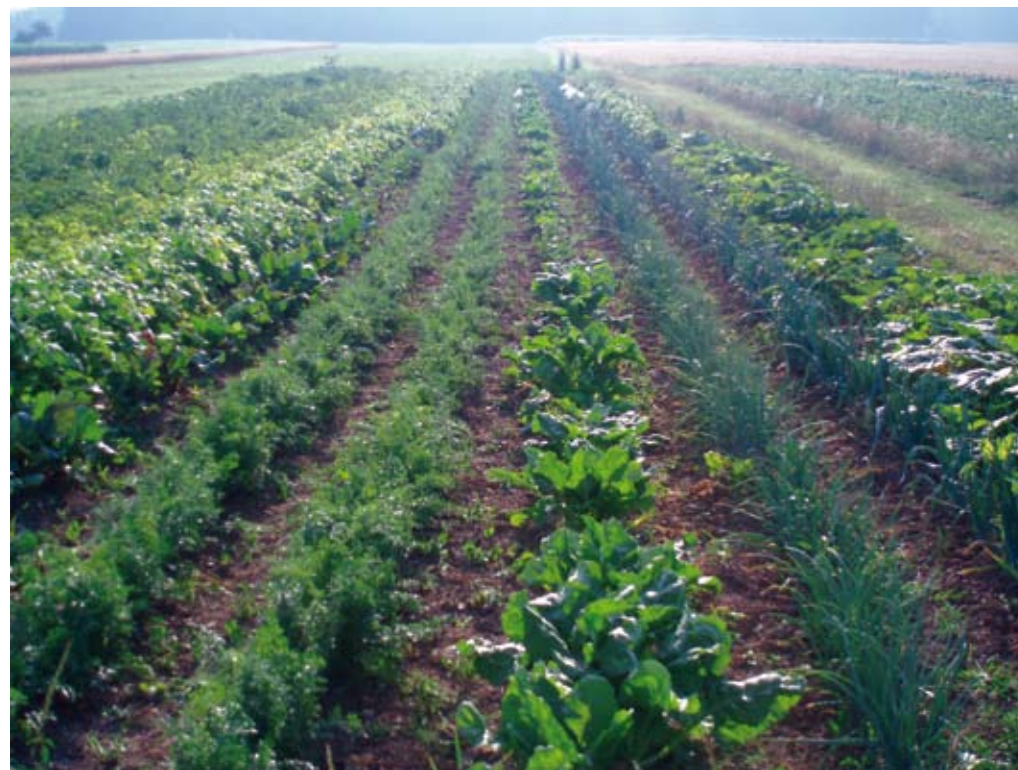
Na ekoloških njivah prevladujejo krmne koševine in žita, medtem ko so okopavine še vedno namenjene predvsem samooskrbi.

Načelo 2 – Skrb za uravnoteženo kroženje hranil. Hranila, ki jih iz