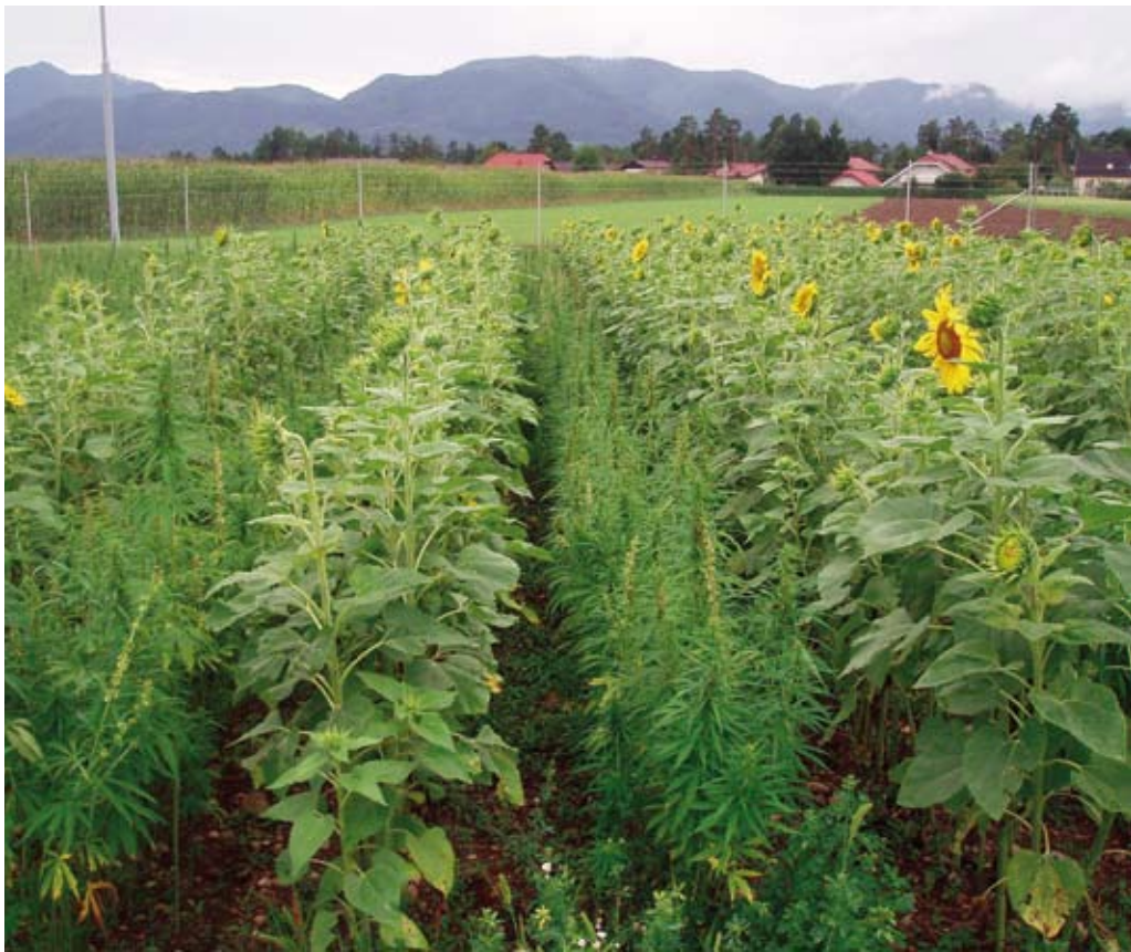
Konoplja je lahko tudi rastlina v kolobarju na njivah.

tega področja. Poligona sta namenjena raziskavam in svetovanju na področju pridelovanja konoplje za prehranske in neprehranske namene, v povezavi s stročnicami, žiti, zelišči in zdravilnimi rastlinami, kot pomoč pri trajnostnem kmetovanju. Iskanje rešitev za pridelo-