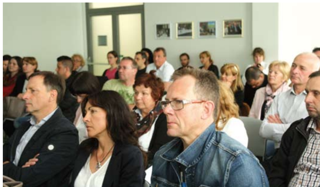
Veliko zanimanje za posvet o ekološkem kmetovanju.

bile tudi učilnice na prostem. Mladim kmetom, dijakom, študentom in tistim, ki vstopajo v ekološko kmetovanje, bi morali ponuditi obvezno prakso na kmetijah. Raziskovalci so poudarili, da pogrešajo sodelovanje kmetov in kmetijskih svetovalcev v raziskavah in pri izboru raziskovalnih tem.