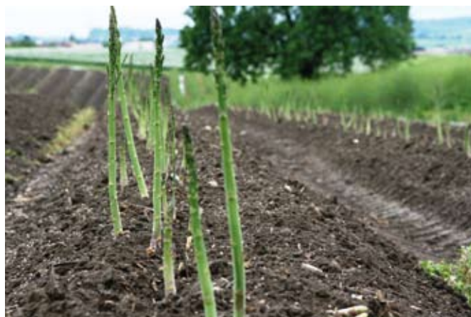
Sedaj bo možno pavšalno ugotavljanje KD tudi za gojenje špargljev.

Bistvene rešitve novega ZUKD-2 so enostavnost in robustnost sistema, ohranjajo se opredelitve vrst kmetijskih zemljišč po dejanski rabi (kmetijsko zemljišče, vinograd, hmeljišče, intenzivni sadovnjak in oljčnik), proizvodnja vina in oljčnega olja ostajata osnovna kmetijska dejavnost, za katero se dohodek lahko ugotavlja pavšalno na podlagi KD, KD se ugotavlja globalno (ne po statističnih regijah), korigira pa se glede na bonitetne točke oziroma rastiščni koeficient, zaradi izračunov na podlagi petletnih povprečij je zagotovljena stabilnost, predvidena pa je tudi po-