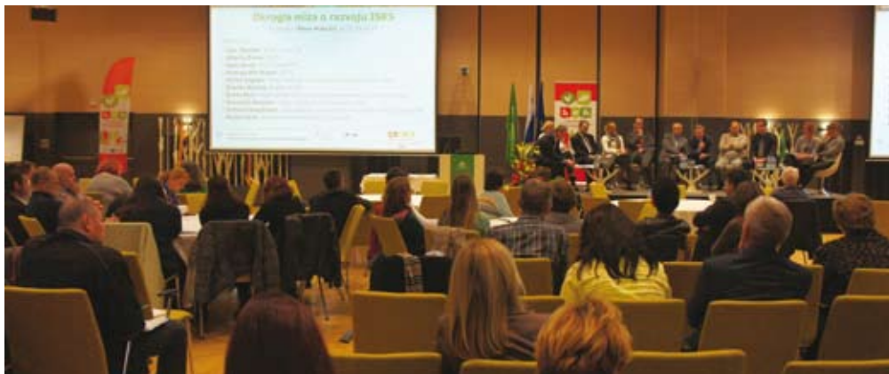
O prihodnosti javne službe kmetijskega svetovanja so razpravljali že novembra lani na okrogli mizi v okviru posveta JSKS v Laškem.

Kmetijski svetovalci menimo, da mora biti javna služba kmetijskega svetovanja tudi v bodoče organizirana v KGZS in sicer v oddelkih za kme-