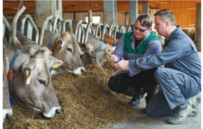
Svetovalci specialisti bodo delali v manjših skupinah z mladimi kmeti.

Program dela panožnih krožkov bodo pripravili mladi kmetje sami skupaj z vodjo. Delo bo slonelo na odprti in pošteti izmenjava izkušenj, intenzivnem delu s podatki kmetij in cilji, preglednem poročilu re-