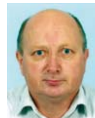
Ilc Anton OE KOČEVJE