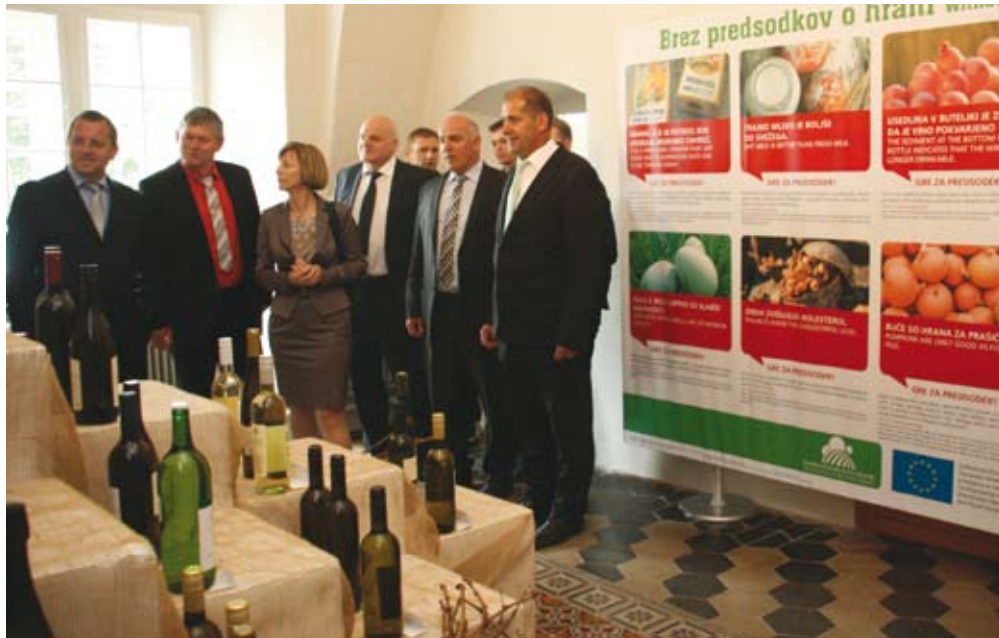
O kmetijstvu, hrani in skupni kmetijski politiki (SKP) so v javnosti številni predsodki, ki jih razblinjamo v okviru projekta Brez predsodkov o kmetijstvu in SKP .