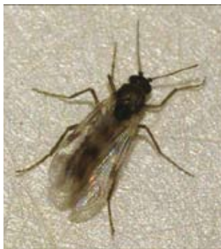
Virus med živalmi prenašajo krvose mušice, ki jim pravimo tudi vektorji (Vir: http://www.diptera.info/ ).

Premiki živali z območij z omejitvami na prosta območja so sedaj možni le, če so bile živali predhodno cepljene. Cepljenje proti BT je najučinkovitejši ukrep za preprečevanje in nadzor BT. Prav tako ob pojavu bolezni v državi in določitvi območij z omejitvami omogoča ugodnejše pogoje za trgovanje. Proti bolezni modrikastega jezika je treba cepiti vse govedo in drobnico, ki se odpemlje z območja z omejitvami na prosta območja v Republiki Sloveniji ali v drugih državah