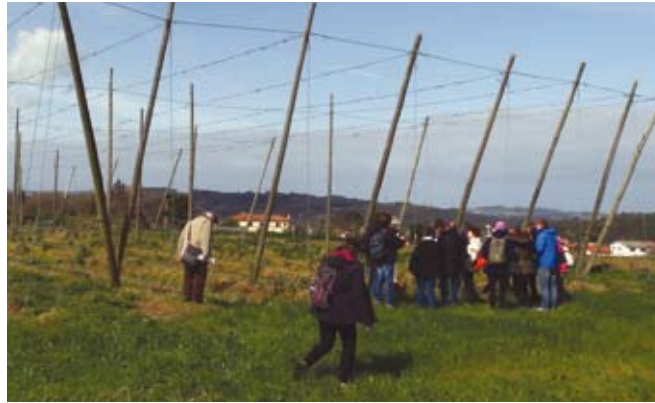
Ogled poskusne površine, kjer preizkušajo ekološko pridelovanje hmelja na Centru za kmetijske raziskave v regiji Galicija v Španiji.

Delavnico so organizirali sodelavci Zveze kmetijskih šol Galicije (Federación de Escuelas Familiares Agrarias de Galicia), ki je španski partner projekta. Delavnico je odprl predsednik Združenja pridelovalcev galicijskega hmelja in član upravnega odbora združenja kmetov Galicije. V nekaj stavkih je predstavil prizadevanja za ponovno vzpostavitev pridelovanja hmelja v Galiciji. Delo se je nadaljevalo s predstavitvijo aktivnosti partnerjev v času med delavnico na Madžarskem in tokratno delavnico. Partnerji so v različnem obsegu realizirali predvidene aktivnosti, oblikovali predloge modulov in jih delno tudi preizkusili. Predstavili so izhodišča za nadaljevanje dela do zaključka projekta. Razprava je tekla tudi popoldne, ko so se sodelujoči razdelili in po skupinah oblikovali predloge za izobraževanje o agroekologiji za različne ciljne skupine. Drugi dan se je delo nadaljevalo s ciljem, da bi izoblikovali končni izbor orodij in pristopov za posredovanje znanja, definirali kompetence, delo in načine analize. Razprava je omogočila oblikovanje poteka treninga in usposabljanj učiteljev. Uskladili so tudi končni spis projektnih rezultatov in njihovo obliko. Zadnji dan je bil namenjen definiranju končnih ciljev in izboru metod ter oblikovanju spletne strani. Razprava je potekala po skupinah in na koncu je strokovnjak za spletne aplikacije izoblikoval predlog, ki je temeljil na priporočilih delovnih skupin.