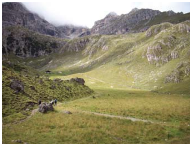
Avstrijska visokogorska planšarija na območju Natura 2000

predstavili svoje delo ter rezultate izvedenih ukrepov na avstrijskem Štajerskem in Koroškem. Prikazali so projekte za izboljšanje stanja obrečnih habitatov, ki so jih izvedli na avstrijski strani reke Mure in na reki Dravi. Tako so že preoblikovali obalni pas, odprli pretok vode skozi mrtvice in omogočili drugačno dinamiko nalaganja napoln in proda. Predstavniki nevladnih organizacij so predstavili projekte s področja kmetijstva (ohranjanje visokogorskih pašnikov, umikanje paše z zamočvirjenih travnišč, časovna omejitve paše na območju gnezdišč modre taščice in spodbujanje košnje strmih travnikov). Predstavljeno je bilo tudi reševanje naravovarstvenih problemov v gozdarstvu z ukrepi za izboljšanje stanja gozdnih habitatov, kot so izločitev nekaterih gozdov iz gospodarjenja, habitatna drevesa, časovne omeji-