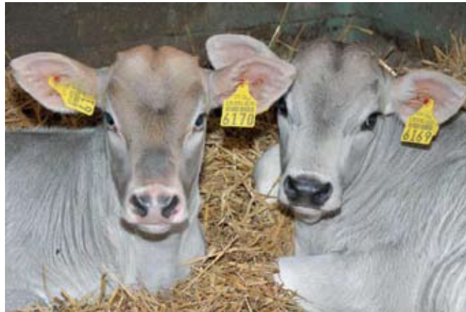
Le kateri je boljši?

Smiselno je genomsko testirati mlade plemenske telice, ki jih nameravamo vzrejati kot plemenski material za na-