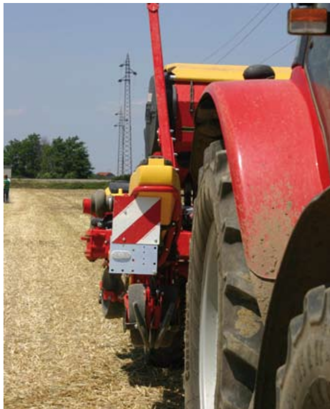
Traktor s traktorskim priključkom s širino več kot 2,55 m. Traktorski priključek mora biti spredaj in zadaj označen z ustreznimi označevalnimi tablam ali nalepkami.

Pravilnik prinaša tudi določbe o označevanju širših traktorjev in delovnih strojev kakor tudi označevanje traktorjev in traktorskih priključkov ter delovnih strojev z deli, ki so lahko nevarni za druge udeležence. Tretji odstavek 27. člena pravilnika pravi, da morajo imeti izpostavljeni deli traktorja in traktorskih priključkov ter delovnih strojev, ki so lahko nevarni za druge udeležence v prometu in so nameščeni na višini največ do 2 m nad cestiščem (npr. rezila, konice, žbice, robovi), med vožnjo po cesti nameščene varovalne naprave, ki morajo biti označene v skladu z 28. členom tega pravilnika. Navedeni 28. člen pravilnika pa pravi, da morajo imeti kmetijski in gozdarski traktorji ter njihovi priklopniki ali traktorski priključ-