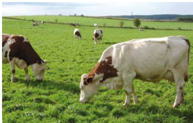
Mleko in meso od goveda, ki se pase, je bolj kakovostno in bolj zdravo za ljudi.

Zelena krma, posebno pa še paša, vsebuje snovi, ki se s konzerviranjem izgubijo. Tako se veliko vitaminov razgradi. Pri krmiljenju jih skušamo nadomestiti z dodajanjem mineralno-vitaminskih mešanic, ki se različno izkoristijo. Ugotavljajo, da je mleko in meso od živali, ki se pasejo, bolj bogato predvsem z vitamini A, E in nekaterimi vitamini B-kompleksa (B1, ni-