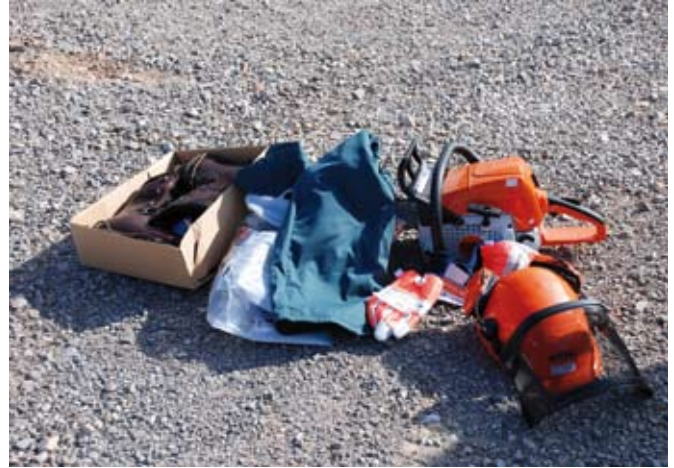
Obvezna osebna varovalna oprema za sečnjo

V to skupino spadajo lastniki gozdov, ki za potrebe osnovne gozdarske dejavnosti in dopolnilne dejavnosti zaposlujejo delavce in imajo status delodajalca. Obveznosti za take lastni-