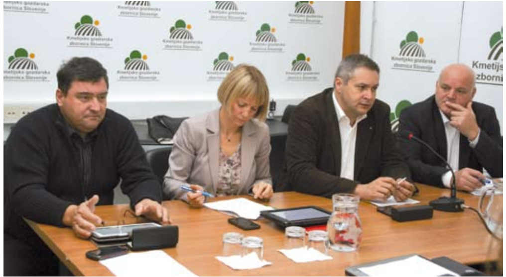
Člani upravnega odbora KGZS so o težavah, ki tarejo slovenske kmete, seznanili tudi ministra za kmetijstvo, gozdarstvo in prehrano mag. Dejana Židana in njegovo ekipo.

Predvideva se, da se agrarna skupnost v statusni in orga-