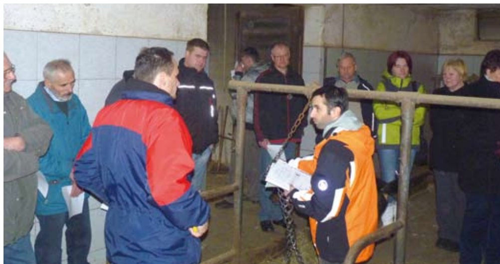
Ker pri nas prevladuje živinoreja, je bila večina izobraževanj namenjena tej panogi. Poleg predavanja so za kmete pripravili prikaze in ogleda dobrih praks.

In še ena posebnost. Na območju celjskega zavoda je kar 720 ekoloških kmetij. Zato so tej skupini posvečali posebno pozornost pri izboru tem in načinov izobraževanj.