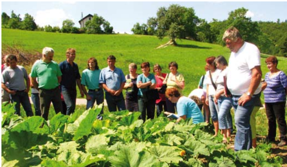
Tudi pri varstvu rastlin so izobraževali kmete na terenu s praktičnimi prikazi spoznavanja škodljivih organizmov in rastlinskih boleznih v poljščinah.

Na Kmetijsko gozdarskem zavodu Murska Sobota nudijo praktični pouk dijakom in študentom, ki jih zanimajo dejavnosti in delo zavoda. Z izobraževalnimi inštitucijami podpisujejo pogodbe, ki točno določajo programske vsebine opravljanja praktičnega pouka z navedbo mentorja. Zavod najpogosteje sodeluje s FKBV Maribor, BF agronomija Ljubljana in živinoreja Rodica ter z Višjo strokovno šolo iz Ptuja, program Opravljanje podežolja in krajine ter s Srednjo ekonomsko šolo iz Murske Sobotice.