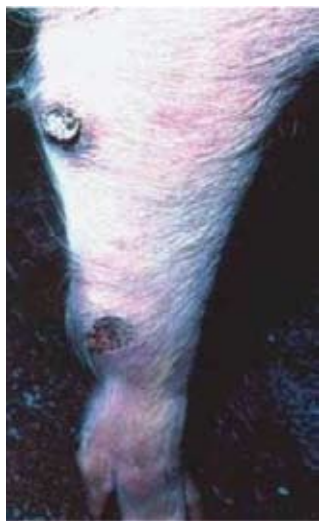
Tipično rdeče območje z razjedami po nogah

Z vročino ga inaktiviramo pri 56°C/70minut, pri 60°C/20 minut. Virus je občutljiv na eter in kloroform. Inaktivira ga tudi