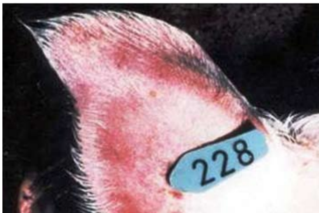
Tipični znak afriške prašičje kuge v akutni obliki