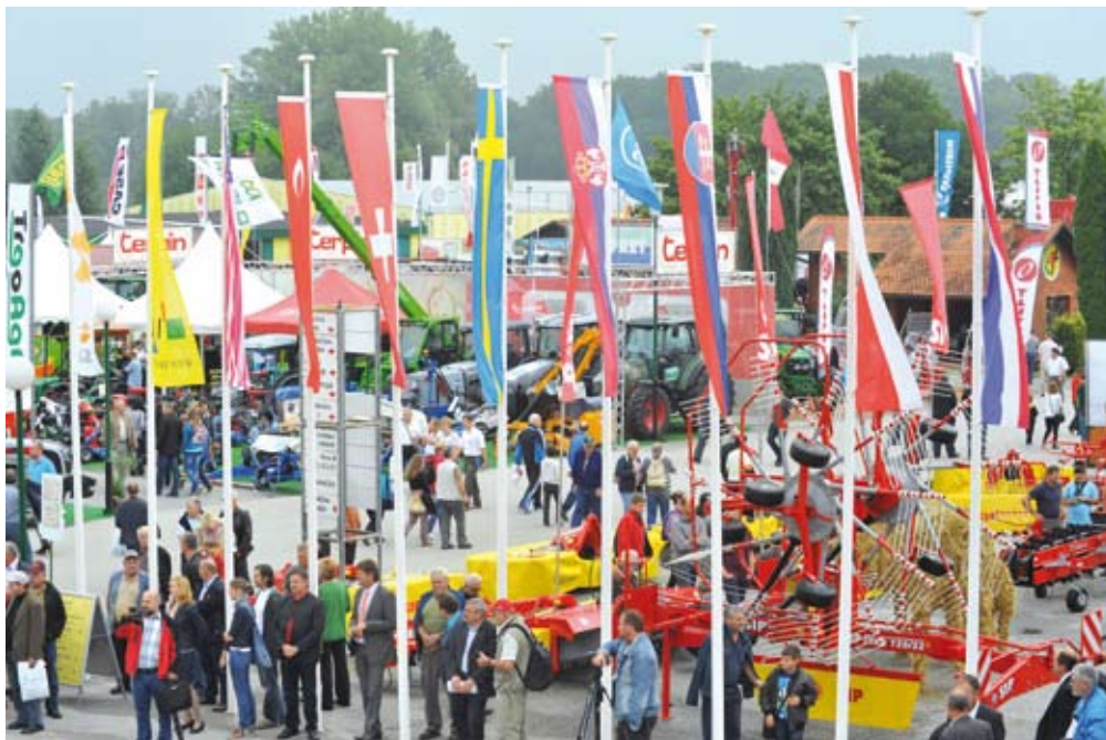
Sejem AGRA se bo že 52-ič zapovrstjo potrdil kot najpomembnejši mednarodni kmetijsko-živilski sejem v Sloveniji ter v sosedski regiji štirih držav.

Sejem AGRA se bo letos od 23. do 28. avgusta v Gornji Radgoni 52-ič zapovrstjo potrdil kot najpomembnejši mednarodni kmetijsko-živilski sejem v Sloveniji ter v sosedski regiji štirih držav. Pod sloganom »Tradicionalno svež« bo na stičišču Slovenije z Avstrijo, Hrvaško in Madžarsko na skupni površini 68.300 m 2 razstavnih površin predstavil 1750 razstavljalcev iz 29 držav. Tradicionalno bo ponujal najvidnejše svetovne blagovne znamke kmetijske, gozdarske in vinogradniške tehnike, vrhunska živila in vina, naj sodobnejšo opremo za živilskopredelovalno industrijo in vinarstvo, kmetijske gradnje, varovanje okolja, semena, sredstva za prehrano in nego živali ter rastlin. Predstavil bo tuje države, regije in organizacije, najvidnejše slovenske vladne, gospodarske in strokovne inštitucije. Tržnice AGRA bodo ponujale kmetijske