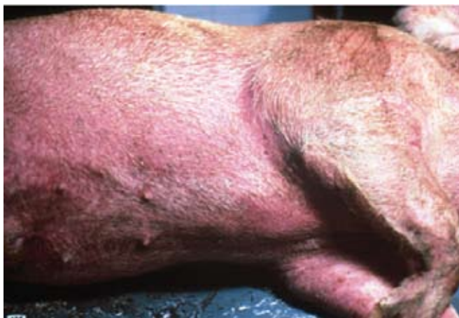
Tipična rdeča koža »potrebušine« govori o akutni afriški prašičji kugi.