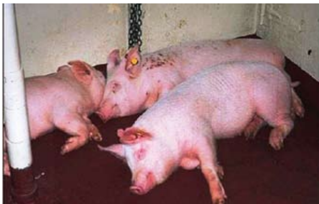
Klinični znak – rdeči, vroči, bolni prašiči, ki se »skrivajo«.

V primeru infekcije z nizko agresivnim virusom (ki ga skoraj ni!) imajo živali le rahlo povišano telesno temperaturo 2–3 tedne, pojavijo se rdečine na koži, ki preidejo v nekrotične kraste. Živali imajo tudi otekle in boleče sklepe. Breje svinje abortirajo.