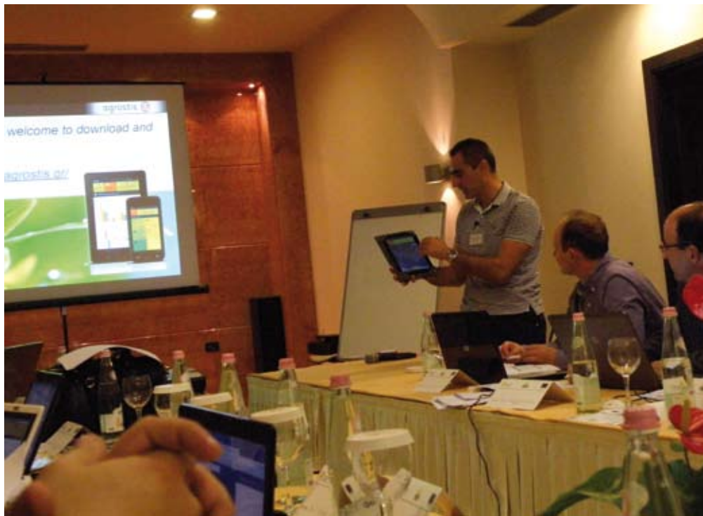
V okviru projekta Agrostart so razvili nekaj uporabnih pripomočkov, ki so jih predstavili na nedavni konferenci v Albaniji.

Za razvoj pripomočka so zadolženi pri italijanskem par-