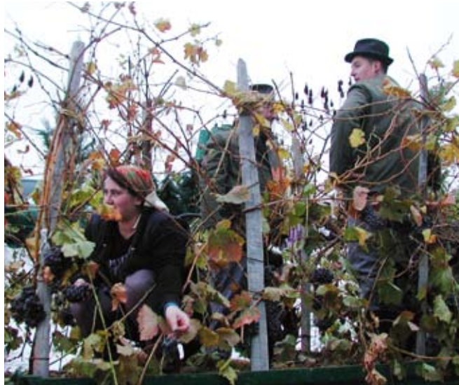
Vsi člani kmečkega gospodarstva skupaj ustvarjajo dobiček kmetije in ne zgolj nosilec sam.

Novost pa je ZPIZ-2 prinesel tudi na področju porazdelitve dobička med kmečke zavarovance. Po stari ureditvi se je dobiček porazdelil med vse kmečke zavarovance na kmetiji. Na podlagi te porazdelitve se je nato določila zavarovalna osnova za vsakega kmečkega zavarovanca ne glede na vrsto njegovega zavarovanja (prostovoljno ali obvezno). Novi ZPIZ-2 pa ne predvideva več avtomatične porazdelitve dobička med kmečke