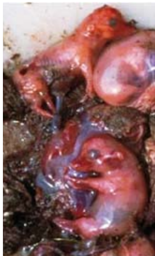
Abortirani pujski, pomešani z blatom

Tako postanejo živali, ki prebolijo akutno ali kronično obliko bolezni, nosilci in izločevalci virusa za vse življenje. Če prebolijo divji prašiči, imamo ves čas nevarnost okužbe iz gozda.