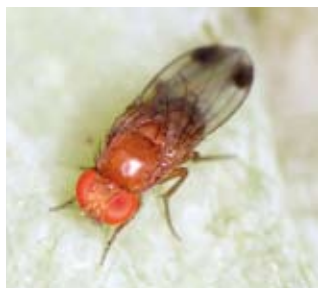
Plodova vinska mušica

Plodova vinska mušica za razliko od drugih vinskih mušic lahko napada povsem zdrave plodove, v katere odlaga jajčeca. Iz teh se izležejo ličinke, ki se hranijo z mesom plodov. Poleg neposredne škode, ki jo povzročajo ličinke, nastane škoda tudi zaradi vbodov mušic pri odlaganju jajčec, saj ti predstavljajo vstopno mesto za glive, ki povzročajo sadne gnilobe: Monilinia fructigena , M. laxa in M. fructicola . Napadeni plodovi tako začnejo gniti. Napada plodove v času zorenja, ko se že obarvajo in v njih nastaja sladkor. V letošnjem letu je k večji škodi doprineslo tudi deževno vreme, ki je ugodno za razvoj sadnih gnilob.