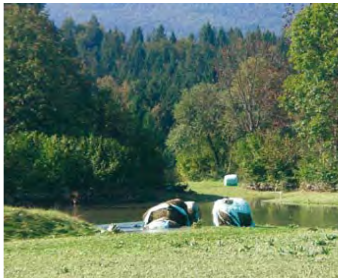
Specifične vremenske razmera (suša, poplave, toča ...) še dodatno zmanjšajo možnosti za pridelavo kakovostne in higienske neoporečne krme.

Pri senu najbolj zmanjšajo hranilno vrednost in neoporečnost krme plesni. Del plesni lahko prinesemo v skladišča že s travinja, predvsem v nekoliko vlažnejših in hladnejših letih. Pri skladiščenju sena brez dosuševanja moramo biti še posebej pozorni in zagotoviti, da v masi ni več kot 14 do 15 % vla-