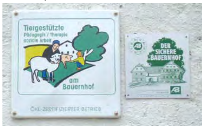
Na kmetiji Steiner imajo certifikat za pedagoško terapevtsko socialno delo na kmetiji.

podjetja bo ustanovil (tip A ali tip B). Pomembno je, da socialna podjetja zaslužijo svoj prihodek (tudi) s prodajo svojih proizvodov ali storitev na trgu , kar jih ločuje od organizacij, ki se financirajo v večini iz javnih sredstev, subvencij, donacij, članarin ali drugih prispevkov, ki jim jih za njihovo delovanje nameni država, druga podjetja ali posamezniki. V krizi je teh sredstev vedno manj, zato so te organizacije vedno bolj prisiljene delovati na trgu. Glavni namen