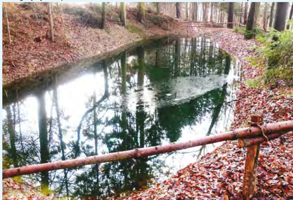
Laguna kmetije Onič ob AC Slovenska Bistrica (projekt. F. Maleiner)