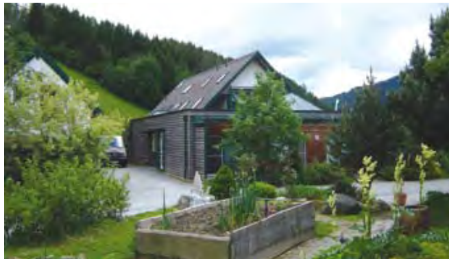
Kmetija Steiner – objekt, v katerem so nastanjeni oskrbovanci, v ospredju visoka greda

Pot smo nadaljevali na Zgornjo Štajersko do kraja St. Oswald, kjer se nahaja kmetija Steiner, ki se ukvarja z oskrbo starejših oseb in oseb s posebnimi potrebami. Njihova kmetija je usmerjena v mlečno proizvodnjo, od leta 2002 pa imajo na kmetiji dom za starejše občane, predvsem ljudi s po-