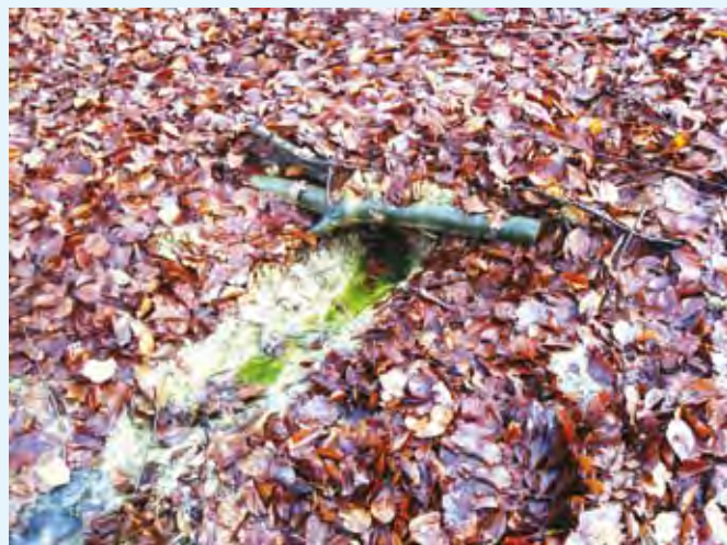
Kmetija Onič: Iztok iz lagune in ponikanje v zemlino (Foto: S. Rajh, načrt: F. Maleiner)

Očiščene odpadne vode iz lagune ali iz drenažnih cevi ali iz tretje lagune je dovoljeno izpušiti neposredno v vodotok ali ponikniti v zemlino ali spustiti neposredno v morje ali rečno ustje izven območja kopalnih voda (površin) (Uredba o odvajanju komunalnih vod iz majhnih čistilnih naprav (UL RS 98/2007)).