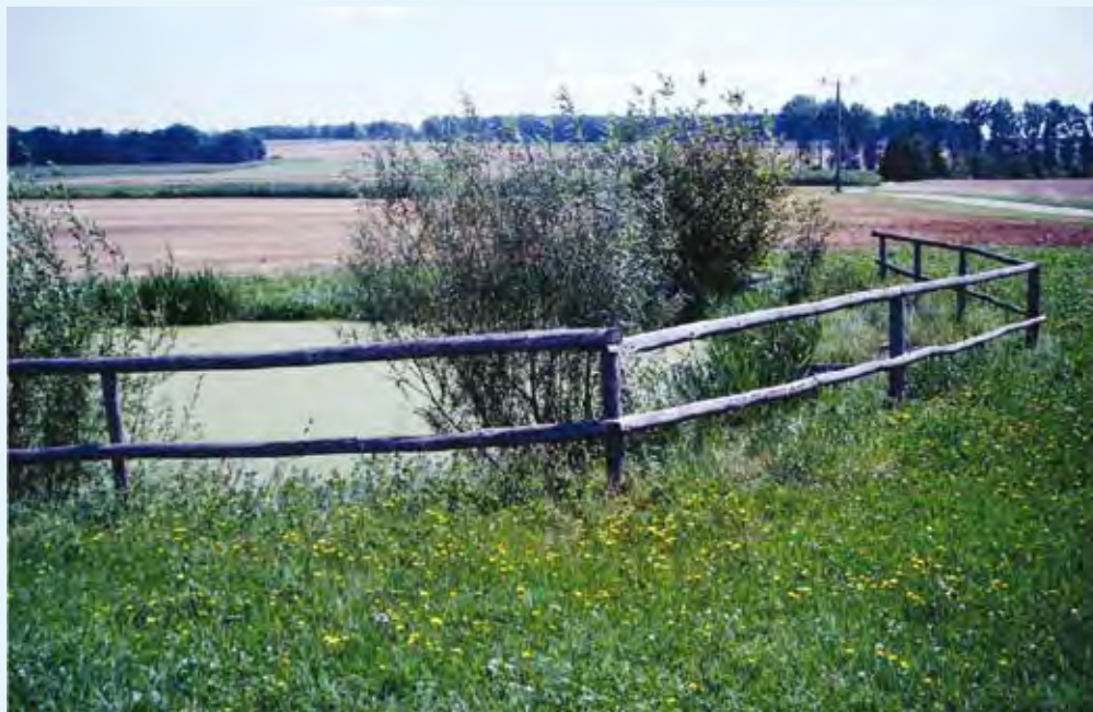
Iz lagune voda izteka v bližnji potok ali jo porabimo za namakanje.

Uporaba blata iz lastne čistilne naprave – krogotok hranil in manjši stroški za nabavo mineralnih gnojil