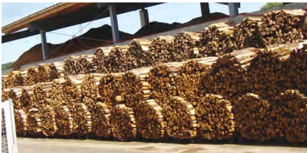
V biomassnem centru dela več dolgotrajno brezposelnih in težje zaposljivih ljudi.

Vse zgoraj opisane dejavnosti lahko brez kakršnihkoli težav opravljate brez ustanovitve socialnega podjetja, bodisi kot dopolnilno dejavnost ali klasično podjetje. Tisti, ki radi s svoje delo obdržite zase (s čimer ni nič narobe), se verje-