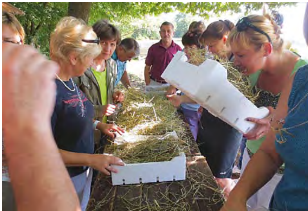
Ustreznost krme za krmljenje lahko z organoleptično oceno, to je z oceno vonja, barve, strukture in čistoče krme, ocenimo tudi sami.

vonj po sadju ali svežem kruhu oz. ima rahlo prijetno kiselkast vonj in je povsem brez vonja po masleni kislini. Prav tako mora biti ohranjena struktura listov in stebel. Barva mora biti čim bolj podobna izhodnemu materialu, torej olivno zelene barve do rahlo porjavela. Vsi ostali vonji, barve in strukturalnost krme kažejo na napake pri siliranju.