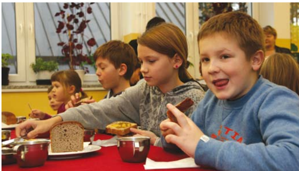
Lokalno oskrbo promocijsko podpira projekt Tradicionalni slovenski zajtrk.

V običajnih razmerah so cene lokalno pridelane hrane nižje zaradi manjših stroškov transporta, krajšega skladiščenja, manjšega števila posrednikov oziroma brez posre-