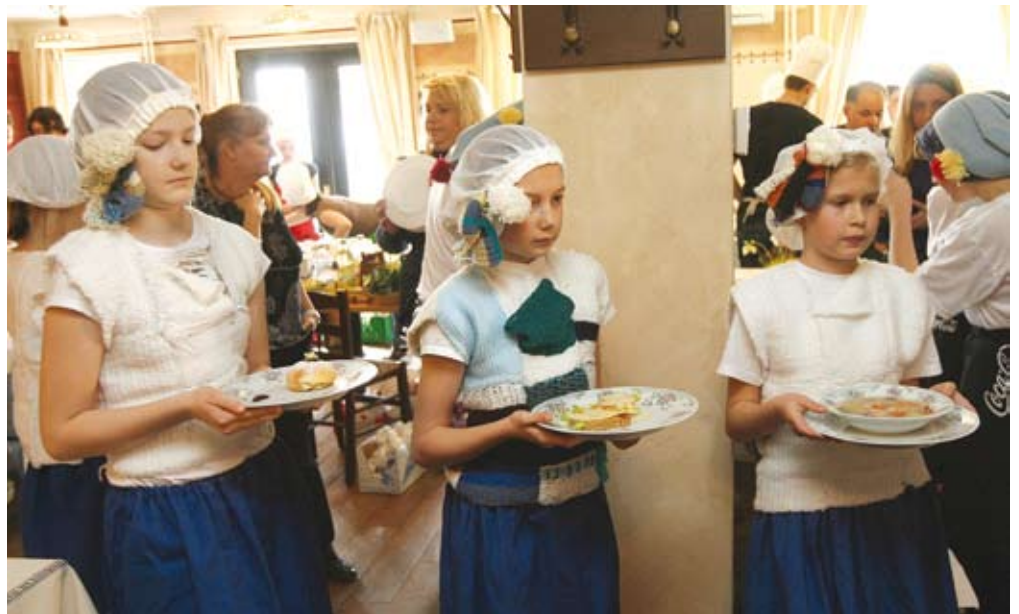
Za spodbujanje lokalne oskrbe je pomembno seznanjanje mladih s slovensko kulinariko.

Leta 1995 smo imeli 230, sedaj pa je registriranih že 854 turističnih kmetij