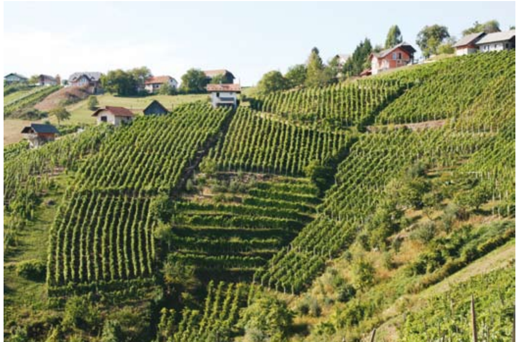
Katastrski dohodek vinogradov in sadovnjakov je tudi v novih izračunih še vedno precenjen.

Zaradi naštetih dejstev je bil februarja 2011 sprejet Zakon o ugotavljanju katastrskega dohodka (ZUKD-1, Ur. l. RS, št. 9/2011, 47/2012 in 55/2013), vendar ni začel. Šele letos aprila