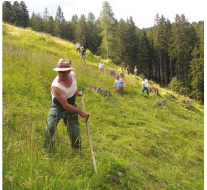
Tudi po letu 2014 bodo območja s težjimi pogoji za pridelavo deležna posebne pozornosti.

Reforma predvideva ukinitve kvot za sladkor s 30. sep-