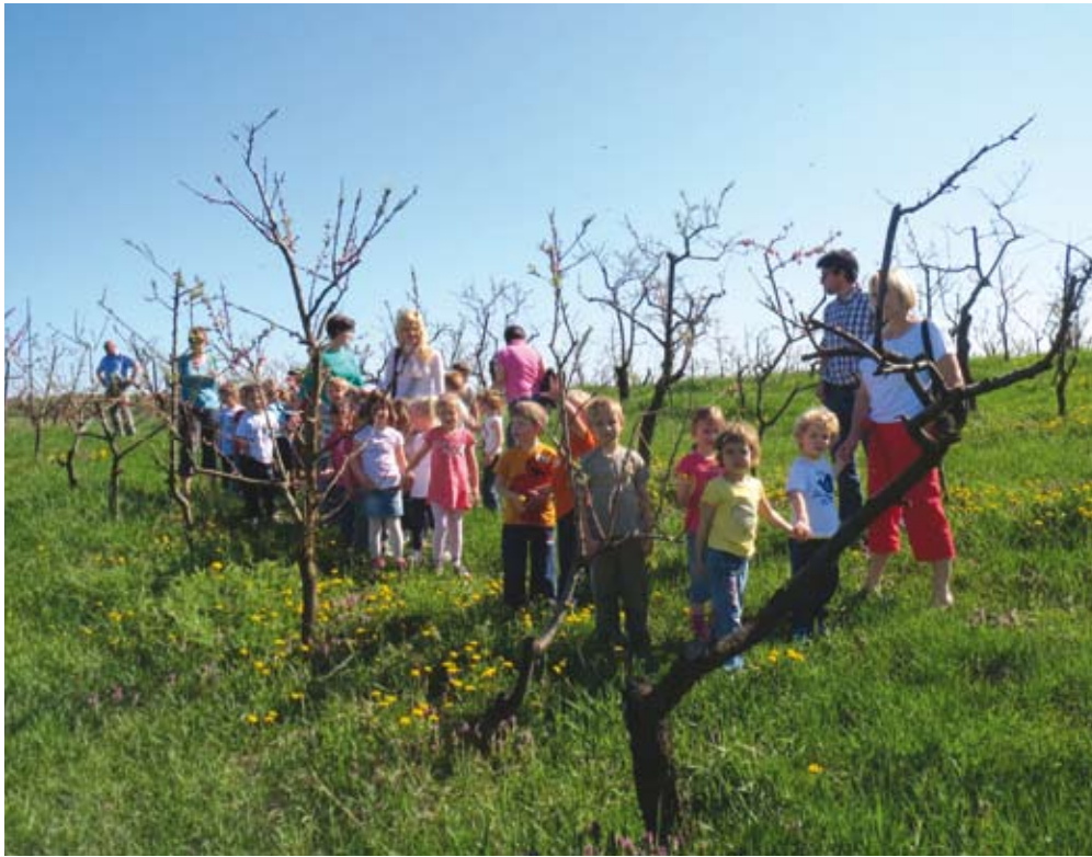
SKP bo posvečala še več pozornosti osveščanju otrok in mladine o pomenu kmetijstva.

rih osnovnih uredbah o skupni kmetijski politiki Evropskega parlamenta in Sveta, ki urejajo — i) neposredna plačila, ii) enotno skupno ureditev trga, iii) razvoj podeželja in iv) horizontalno ureditev za financiranje, upravljanje in nadziranje skupne kmetijske politike.