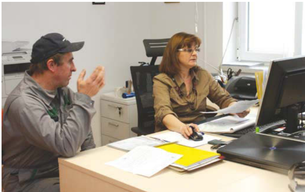
V primeru, da se boste po pomoč pri izpolnjevanju vloge obrnili na javno službo kmetijskega svetovanja, se čim prej dogovorite za termin.

Za boljšo obveščenost so tudi letos na ARSKTRP in MKO pripravili »Kratek opomnik za uveljavljanje ukrepov kmetijske politike za leto 2013«. Ta informativni list so vam posredovali kmetijski svetovalci, ki