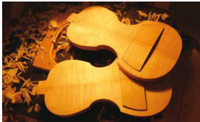
Gorski javor rebraš se uporablja za dno violin ali, kot na sliki, za električno violino.

Na spremljajoči konferenci z naslovom "Trženje lesnih sortimentov" je bilo poudarjeno, da je licitacija lesa primer do-