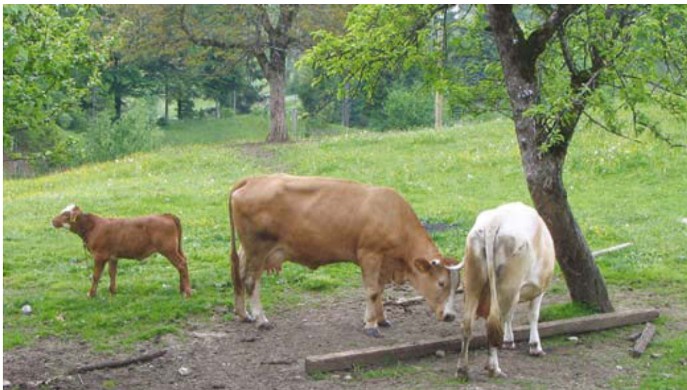
Zahtevak za dodatno plačilo za ERŽ vložite le tisti, ki imate upravičene živali.

Tako kot v preteklih letih, tudi v letu 2013 velja, da KMG, ki na