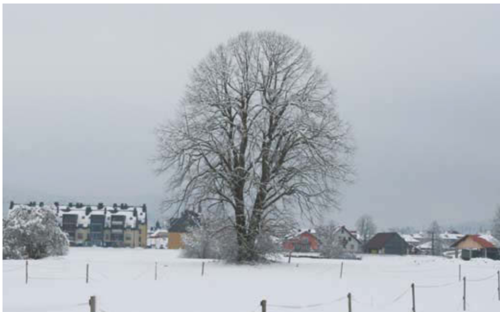
Med krajinske značilnosti spadajo tudi posamezna drevesa, kot je primer dvodebelne lipe na Martinj hribu 'za Mihučem' v Logatcu.

K obstoječim KrZn so bile letos dodane nove kategorije, tako da preoblikovani seznam KrZn vsebuje pasove vegetacije ob vo-