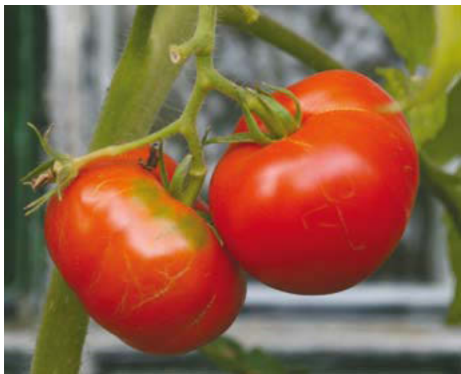
Do neposrednih plačil v rastlinjakih so upravičeni tisti, ki imajo pridelavo na zemljišču.

Poleg tega, da se uveljavljajo zahtevki le za upravičene živali, je zelo pomembno, da poskrbite za pravilno in pravočasno označitev vseh živali na vašem kmetijskem gospodarstvu in pravočasno nadomestitev ušesnih