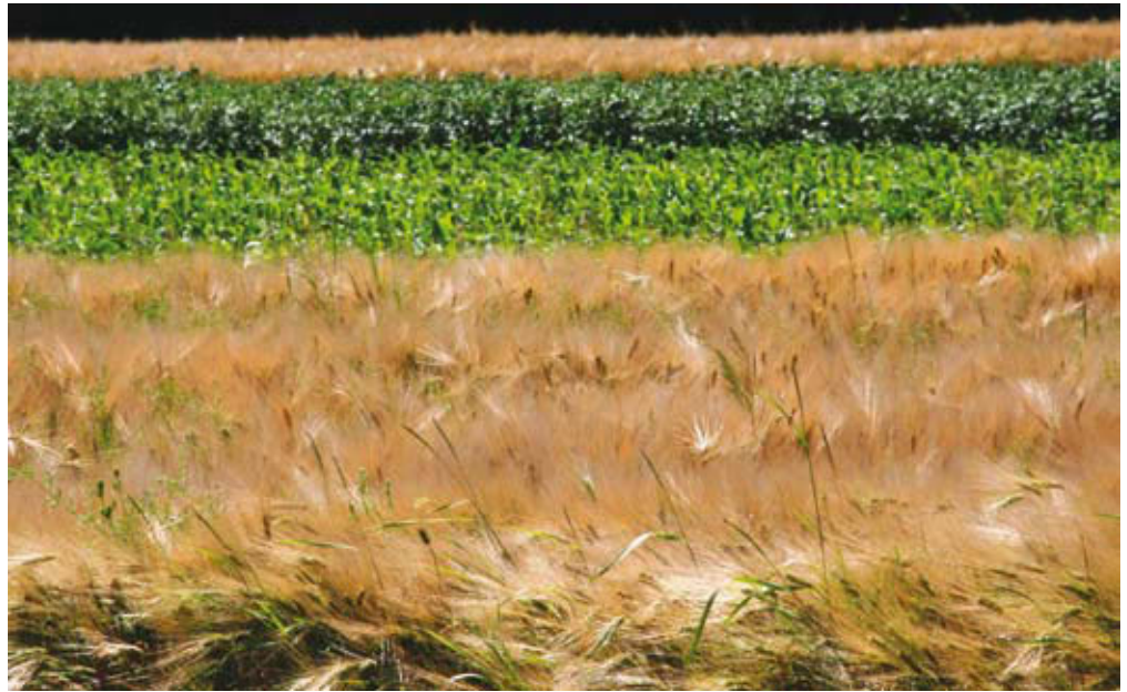
Načrt kolobarja imamo izdelan za vse površine, na katerih podukrepe izvajamo, setev pa izvajamo v skladu z načrtom kolobarja.

tev na vseh njivskih površinah izvajamo v skladu z načrtom kolobarja.