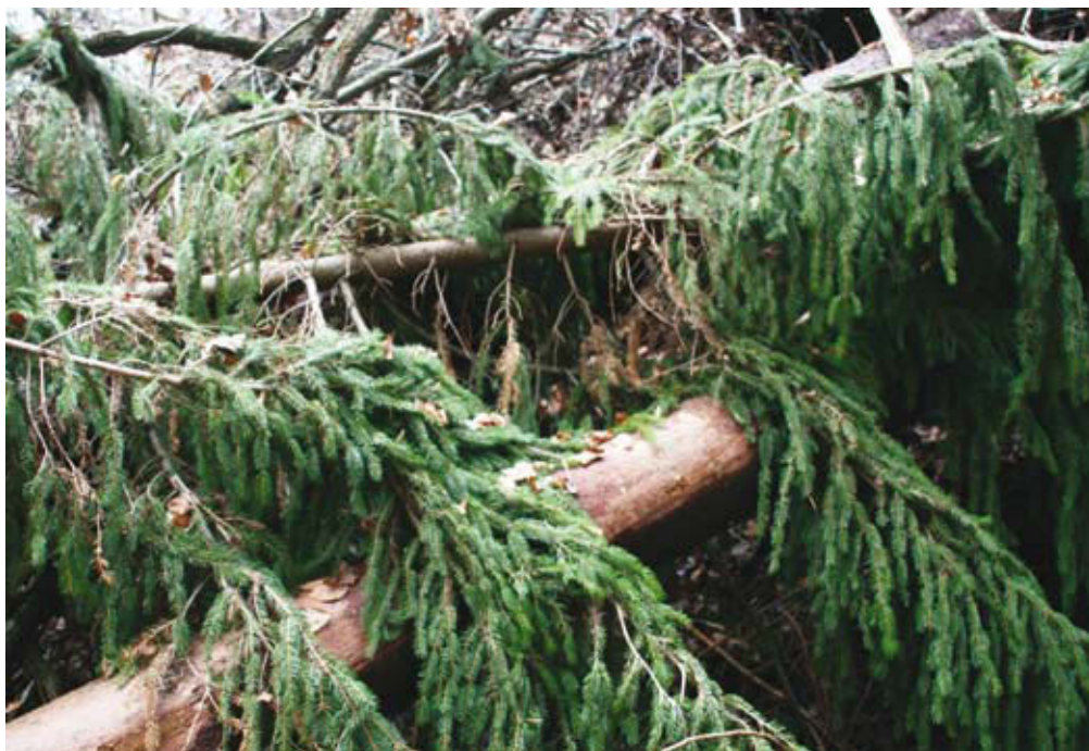
V primeru poškodovanih iglavcev, kjer je velika nevarnost prenamnožitve podlubnikov, morajo lastniki gozdov v odločbi določena dela opraviti do 20. marca 2013.

V sanacijskem načrtu so za zasebne gozdove kot ukrepi predvideni sofinanciranje