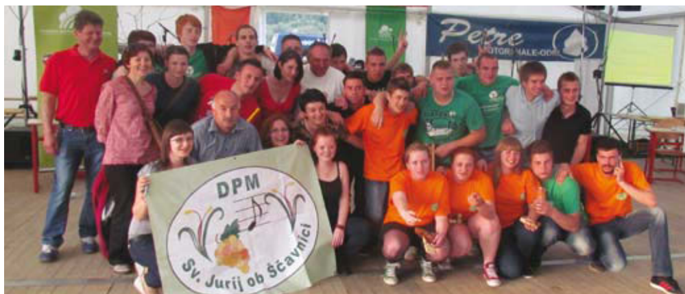
Lani je na kvizu Mladi in kmetijstvo zmagalo društvo podeželske mladine Sv. Jurij ob Ščavnici

Akadska folklorna skupina Ozara , Akadska folklorna skupina Ozara, Kranj 2012.