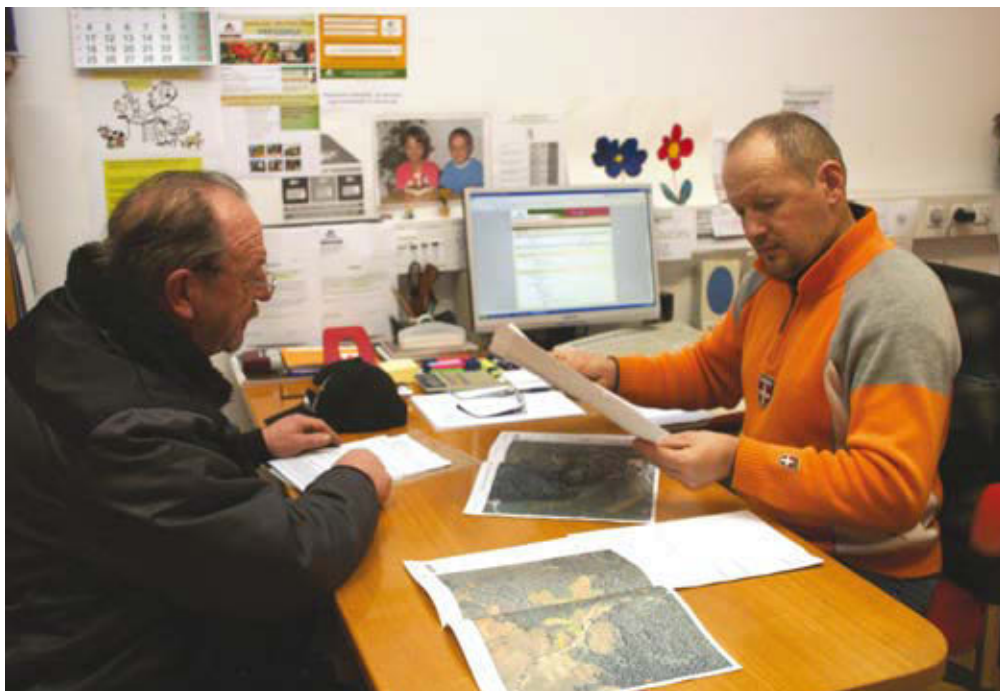
Pri izpolnjevanju zbirne vloge pri kmetijskih svetovalcih imejte s sabo vse potrebne dokumente.

Pri pregledu bodite pozorni, da so na letalskih posnetkih meje vaših GERK-ov pravilno izrisane glede na dejansko stanje v naravi. Iz GERK-ov je treba izločiti ceste, dvorišča, jake, razna nasutja gradbenega ali kakšnega drugačnega materiala, na novo zgrajene objekte, zaraščene površine ipd., javiti spremembe rabe (njiva, travnik, trajni nasad ...), odjaviti zemljišča, ki jih ne uporabljate več, in odpraviti vse preostale nepravilnosti na GERK-ih. Do plačil tudi niso upravičene po-