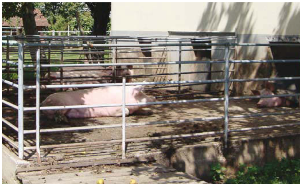
Izpust za živali je pri ekološki reji samoumeven.

Priporočljivo, je da se živali, ki bodo skupaj po prasitvi, spoznajo že prej, sicer prihaja