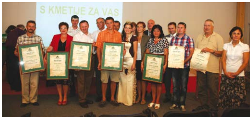
V letošnji akciji S kmetije za Vas je sodelovalo 11 kmetij.