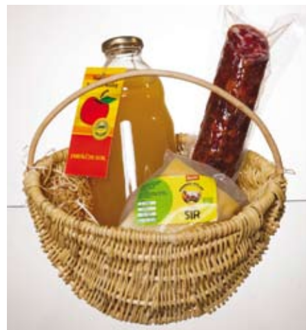
Ustvarjamo pogoje za razvoj perspektivnih dejavnosti na zasavskem podeželju.

projektovnih dejavnosti je oblikovanje celostne grafične podobe za pridelke in izdelke s kmetij z dopolnilno dejavnostjo, za nosilce osebnega dopolnilnega dela in druge podjetnike, ki bodo preko kataloga ponudbe predstavljali in tržili svoje pridelke. Do sedaj nam je na območju LAS-a uspelo vzpodbuditi razvoj dopolnilnih dejavnosti na kmetijah, ki so vezane na predelavo osnovnih kmetijskih pridelkov, začnajo pa se razvijati tudi domače obrti in druge dejavnosti, kot so čebelarstvo, priprava čebeljih izdelkov, izdelovanje različnega nakita iz naravnih materialov, izdelovanje izdelkov iz zelišč (mila, čaji, tinkture, mazila, olja ...). Našteti pridelki in druga ponudba bodo vključeni v katalog ponudnikov. Omenjeni katalog si že lahko ogledate na spletni