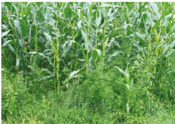
Ambrozija v posevku koruze

lahko povzročijo draženje kože. Pogoste so tudi navzkrižne reakcije z drugimi alergeni rastlinami iz rodu Ambrosia .