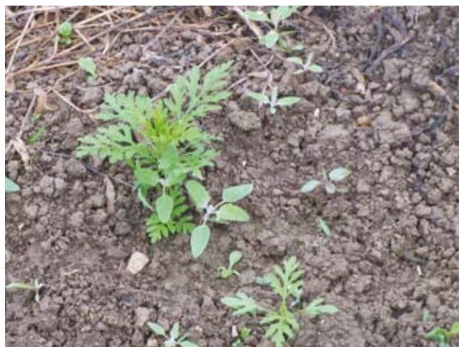
Mlade rastline ambrozije

Pelinolistna ambrozija ni zahtevna glede rastnih razmer in je predvsem plevel zapuščenih in neobdelanih površin oziroma površin, kjer je zaradi gradnje ali drugih vzrokov prišlo do večjih premikov zemlje. Največ jo najdemo ob cestah, železniških progah, ob bregovih rek in potokov, na zapuščenih obdelovalnih ali stavbnih zemljiščih ter na slabo komunalno urejenih javnih in drugih površinah, od koder se lahko širi na kmetijska zemljišča. V Sloveniji se z ambrozi-