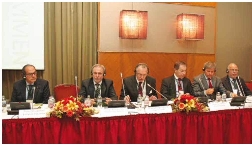
Na kongresu evropskih kmetov v organizaciji COPA-COGECE so prisotni sprejeli skupno izjavo – deklaracijo, ki jo v tem prispevku povzemamo.

glede skorajšnje razprave o proračunu zaradi splošnega slabega finančnega položaja in zahtev po racionalizaciji. Dodal je še, da je njegov predlog skupne kmetijske politike, sloneč na