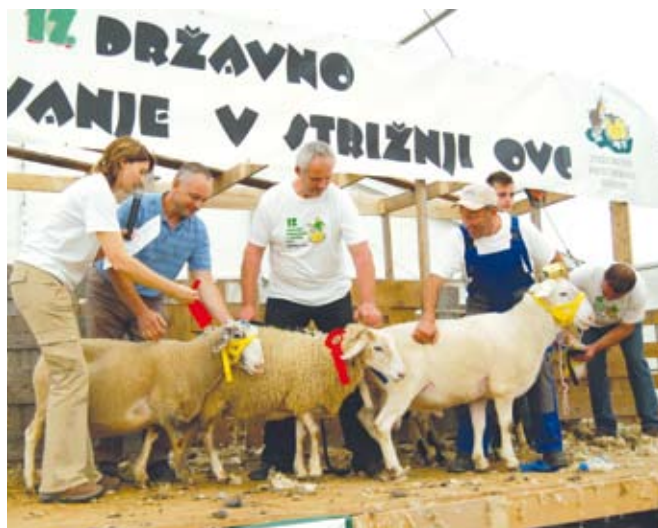
Najlepši slovenski plemenjaki oplemenjene jezersko-solčavske pasme ovc.