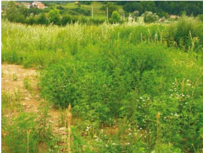
Ambrozija na opuščenih zemljiščih, gradbiščih ...

jo srečujemo večinoma na robovih njiv, posejanih s koruzo, krompirjem, bučami in vrtninami, vedno pogosteje pa tudi na travnikih. V zadnjih letih jo pogosteje zasledimo tudi na površinah, vključenih v ekološko pridelavo, kamor smo jo zanesli bodisi s semenom gojenih rastlin (pogosto z ajdo), z obdelovalnimi stroji, s ptičjo hrano ali navozi različnega materiala.