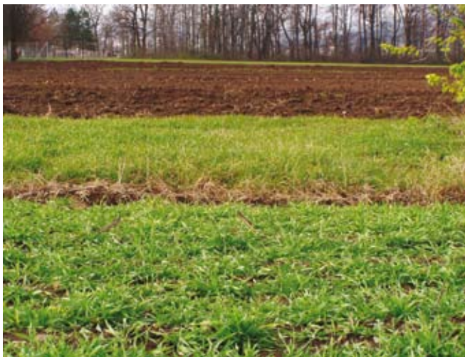
Ozelenjene in preorane površine ob črpališču vode

Kmetijske površine, ki so primerne in jih namenimo proi-