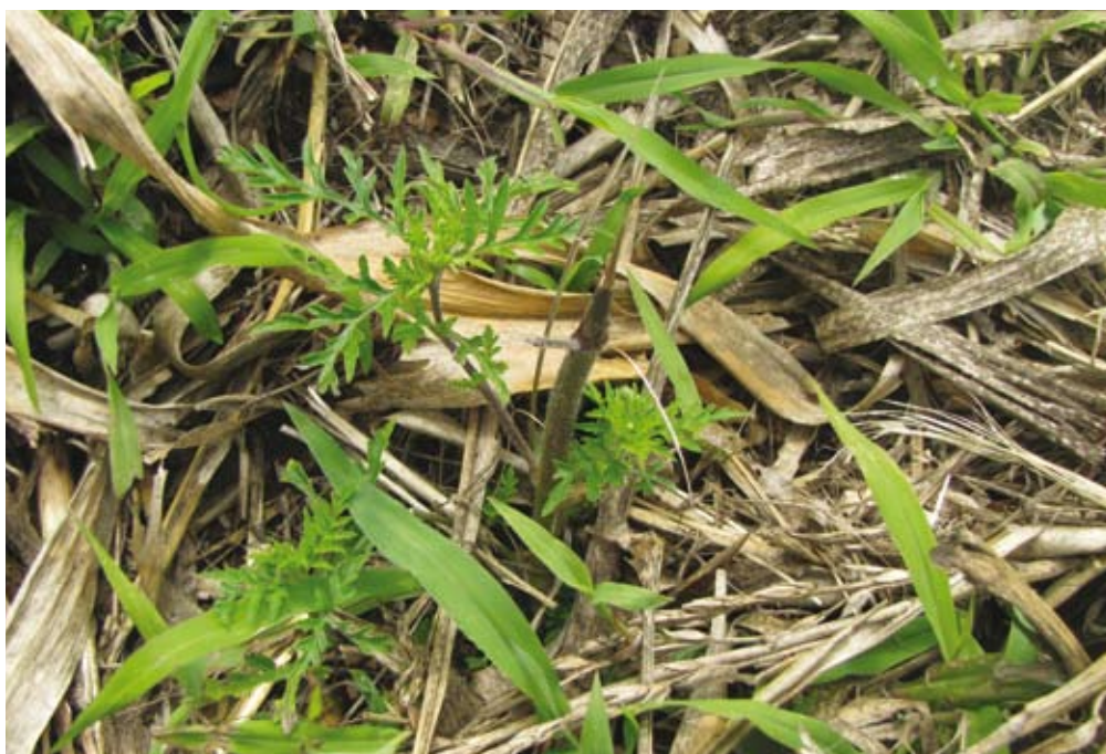
Rastlina se hitro obraste.

Najcenejši pristop k nadzoru širjenja invazivnih vrst rastlin je preprečevanje samega širjenja. Pelinolistna ambrozija je pri nas že tako razširjena, da lahko z umnim ukrepanjem le preprečimo ali upočasnimo širjenje rastline in tako vplivamo na zmanjšanje škode, ki že nastaja in še bo nastala zaradi ambrozije. S težavami, ki jih povzroča ta rastlina, se srečujemo tako na kmetijskem kot tudi zdravstvenem in okoljevarstvenem področju. Uspehe lahko