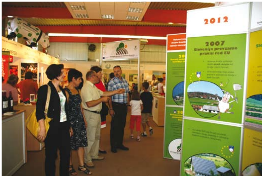
Obiskovalci sejma Agra so si lahko na razstavnem prostoru KGZS ogledali tudi razstavo SKP – kakovost, varnost, blaginja, razvoj.

Na razmah certifikacije bo, po Koprivnikarjevih besedah, poleg zahtev trga vplivala tudi Uredba EU št. 995/2010, ki določa obveznosti gospodarskih subjektov, ki dajejo na trg les in lesne proizvode. Le-ta bo začela veljati z marcem 2013. Kmetje in podjetja bodo morali zagotoviti, da njihov les prihaja iz legalno posekanega lesa.