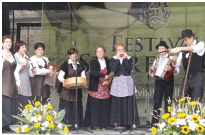
Skupina ljudskih pevcev in godcev iz Harij, ki jo je užitek poslušati.