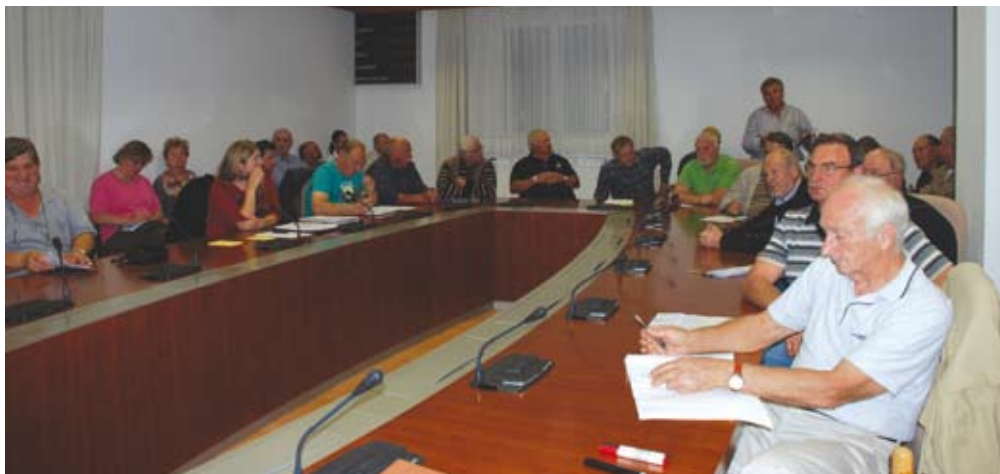
Udeleženci delavnice »Perspektive agrarnih skupnosti« v Hrpeljah v organizaciji Združenja predstavnikov agrarnih skupnosti Slovenije in Gozdarskega inštituta Slovenije.

Nejasen pravni status agrarnih skupnosti je res pereča težava. Nanj agrarne skupnosti opozarjajo že od samega začetka tako preko medijev in srečanja agrarnih skupnosti kot tudi skozi reševanje sporov na sodiščih. Pregled sodnih praks portala IUS INFO nam pokaže »veliko dejavnost« agrarnih sku-