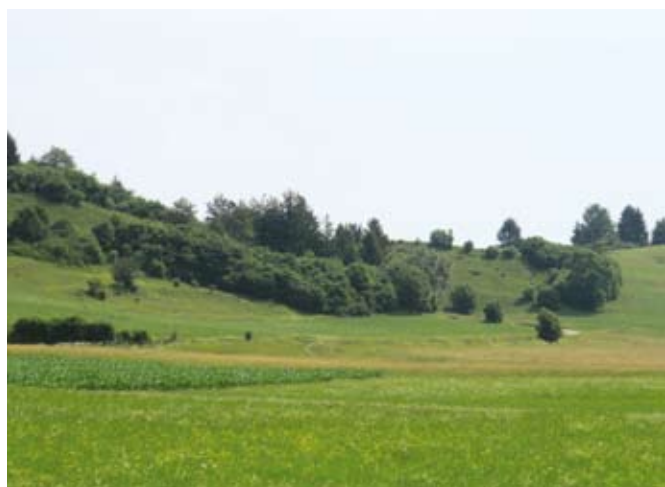
Zaraščanje kmetijskih površin

močij ne da pridelati oziroma privediti vsaj nekaj hrane. Žal ravno na teh območjih opazimo velik upad reje živali in posledično opuščanje kmetijskih površin, kar se odraža v zaraščanju kmetijske zemlje. Ker sta obdelana kulturna krajina