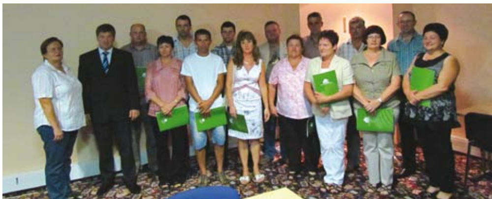
Po posvetu je sledila še podelitev priznanj zglednim rejcam.