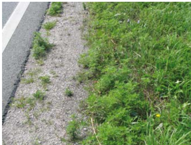
Ambrozija ob cesti

Cvetni prah pelinolistne ambrozije je eden najmočnejših znanih alergenov in predstavlja zelo resno tveganje za zdravje ljudi. Cvetni prah spada med najpogostejše povzročitelje senenega nahoda, pogosto pa povzroča hude simptome, podobne astmi. Pelinolistna ambrozija vsebuje tudi eterična olja, ki