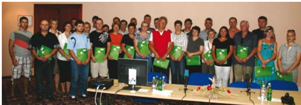
Certifikate je prejelo 82 kandidatov in kandidatk.

Po posvetu je sledila še podelitev priznanj zglednim rejam. Minister Bogovič je v nagovoru izpostavil, da slovensko kmetijstvo v Evropi nikoli ne bo slovelo po količinah, smo pa, tako Bogovič, že dokazali, da smo zelo prodorni na področju