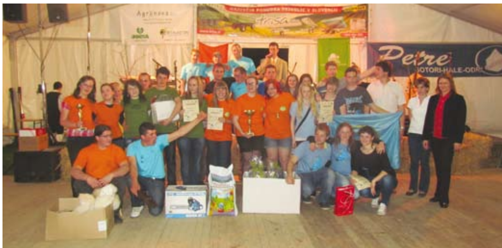
Na kvizu je sodelovalo enajst ekip iz vse Slovenije.