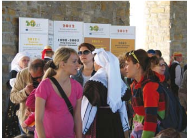
Ob ogledu razstave Skupna kmetijska politika – kakovost, varnost, blaginja, razvoj se je med obiskovalci razvila živahna razprava.

Na letošnjih Podeželjih v mestu ima posebno mesto skupna kmetijska politika (SKP), ki obeležuje 50 let svojega delova-