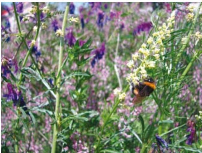
Z umno uporabo FFS varujemo tudi druge oprasovalce.

na embalaži FFS. Podatki o čebelam nevarnih FFS so dostopni tudi na spletni strani fitosanitarne uprave RS na seznamu registriranih FFS (spletni naslov: http://spletni2.furs.gov.si/ffs/regsr/index.htm (seznam FFS, nevarnih za čebele)).