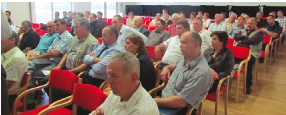
Kmetje, kmetice in predstavniki organizacij v kmetijstvu in gozdarstvu so se dejavno vključili v razpravo.

»Na prehodu iz enega finančnega obdobja 2007–2013 v drugo obdobje 2014–2020 je na osnovi nekaterih dokumentov, ki so bili sprejeti v lanskem letu, in na osnovi izhodišč, podanih s strani Evropske komisije, nujno, da se o evropski kmetijski politiki, ki še vedno ostaja ena ključnih evropskih politik, dodobra dogovorimo znotraj države,« je uvodoma povedal minister Franc Bogovič. Ob tem je dodal, da varčevalni ukrepi Vlade RS ne bodo posegali na tisto področje, ki je vezano na črpanje evropskega denarja. V nadaljevanju je minister Bogovič opozoril na pomen dobre organiziranosti proizvodnje, saj, tako minister Bogovič, do največjih odstopanj znotraj verige od pridelovalca do potrošnika prihaja