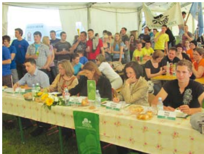
Strokovna komisija je skrbno spremljala državni kviz Mladi in kmetijstvo.

V okviru prireditve so si lahko obiskovalci v dvorani KD