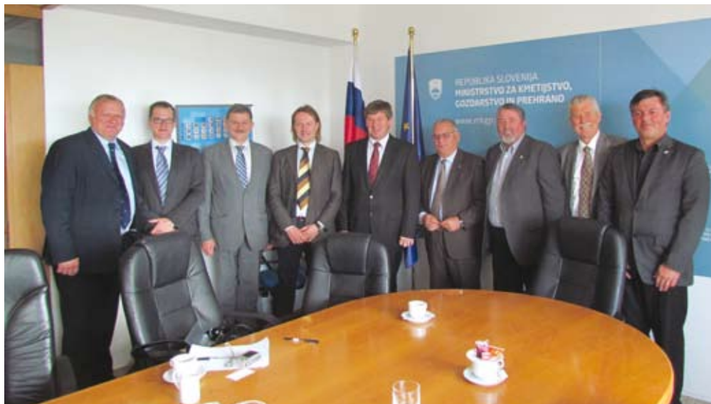
Delegacijo je sprejel tudi minister za kmetijstvo in okolje Franc Bogovič.

Giuseppe Politi je na sprejemu pri predsedniku parlamentarnega odbora za kmetijstvo, gozdarstvo, prehrano in okolje