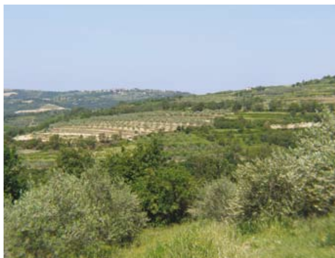
Primerne lege za ekološko pridelavo so zračne in dobro osonečene.

žav z boleznijo pavje oko in kjer je bilo malo najpomembnejše škodljivke oljčne muhe. Močnejši napad oljčne muhe zniža kakovost oljčnega olja in prav to je mnoge oljkarje odvrgnilo od odločitve za ekološko pridelavo. Sedaj, ko imamo že nekaj let dobre izkušnje z ekološkim zatiranjem oljčne muhe, je tveganje za izpad pridelka in znižanje kakovost oljčnega olja majhno. Integrirana in ekološka pridelava pri oljkah se zelo malo razlikujeta in prehod z integrirane na ekološko ni težak.