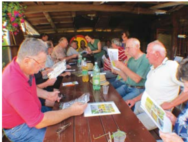
Delavnice o ekološkem varstvu pred oljčno muho pridelovalce izobražujejo in vzpodbujajo k sodelovanju.

Za druge škodljivce – oljkov molj in oljkov kapar tudi v integrirani pridelavi nimamo dovoljenih učinkovitih sredstev.