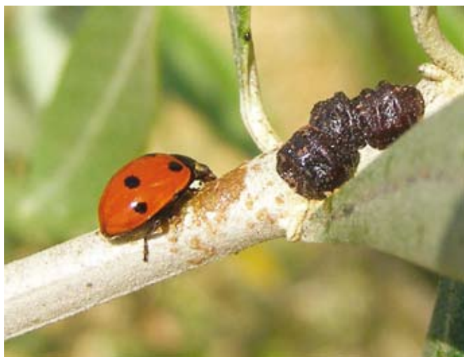
Polonice zmanjšujejo populacijo oljkovega kaparja.

Naravi prijazna pridelava zahteva veliko znanja in nesebičnosti. Zato se povezujemo