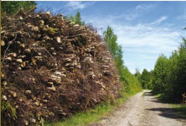
Sušenje biomase ob gozdni cesti zagotavlja kakovostnejšo surovino in višjo ceno sekancev.

Kmalu bo na strani dostopno tudi orodje za ovrednotenje vplivov za potencialne biomasne objekte. Orodje bo omogočalo lažje odločanje, ali se v posameznih primerih začnejo podrobne študije izvedljivosti oziroma, s katerega vidika je posamezna investicija najbolj primerna.