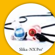
Slika: NX Pro®

Neuroth - učinkovita zaščita v glasnem okolju