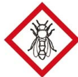
Znak nevarno za čebele

rabe šob, ki zmanjšajo zanašanje (npr. na podlagi odločbe o priznavanju nujno potrebnih FFS). Odveč ne bo tudi opozorilo, da med vode 1. reda uvrščamo Jadransko morje, Blejsko, Bohinjsko in Cerkljansko jezero, Savo Dolinko in Savo Bohinjko, Savo, Tržiško Bistrico, Kokro, Soro, Kamniško Bistrico, Ljubljano, Savinjo, Mirno (na Dolenjskem), Krško, Sotlo, Kolpo, Dravo, Mežo z Mislinjo, Dravinjo, Pesnico, Muro, Ledavo, Ščavnico, Rižano, Reko, Sočo, Idrijo, Vipavo, Dragonjo,