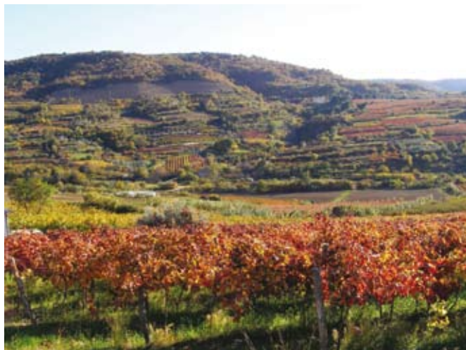
Naša mozaična krajina s prepletom različnih kmetijskih kultur, travnikov in gozda je naša velika prednost, ki je nimajo države z velikimi nasadi oljk.