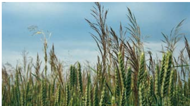
Navadni srakoperec ( Apera spica-venti )