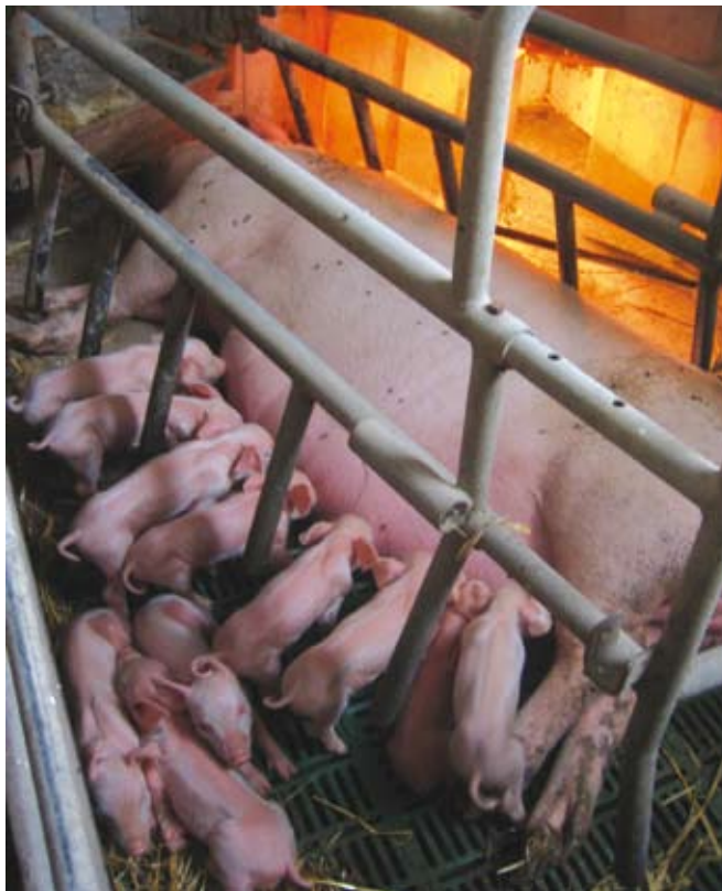
Konzorcij OPS je Odboru za kmetijstvo, gozdarstvo, prehrano in okolje predlagal ukrepe, ki bi že kratkoročno ustavili propad slovenske prašičereje.

Predstavniki konzorcija OPS so izpostavili, da je v zadnjem obdobju (2008–2010) močno padel delež državnih pomoči v kmetijski dejavnosti. V skupnem seštevku vseh državnih pomoči se je pomoč kmetijstvu, lovu, gozdarstvu in ribištvu znižala za polovico. Delež državne pomoči tej dejavnosti je namreč leta 2008 znašal 16,13 odstotkov, medtem ko je leta 2010 znašal le še 8,4 odstotkov. Tako se je ta dejavnost, kljub drugačnemu prepričanju javnosti, v strukturi državne pomoči po dejavnostih v letu 2010 znašala šele na šestem mestu. Več državne pomoči so od kmetijstva, lova, gozdarstva in ribištva prejeli: predelovalne dejavnosti, promet, nepremičnine, elektrika, plin, para in finančno posredništvo. Z reševa-