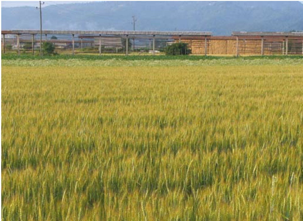
S primerno tehniko pridelave prispevamo k boljšemu zdravstvenemu stanju posevkov. Za boljšo kondicijo rastlin pa lahko uporabimo tudi dovoljena sredstva.

ka. Omejitve izhajajo iz samega pristopa ekološkega kmetovanja kot panoge, ki skuša zdravje rastlin zagotoviti z optimalnim stanjem tal, z zadosti organske snovi, krepitvijo rastlin in drugimi ukrepi, ki ne temeljijo na uporabi sintetičnih sredstev. Njihova uporaba je v ekološkem kmetijstvu prepovedana. V ekološkem kmetovanju se smejo uporabiti le sredstva, ki izvirajo iz narave, naravni sovražniki in nekatere druge snovi tradicionalno uporabne za zaščito rastlin. Taka sredstva manj obre-