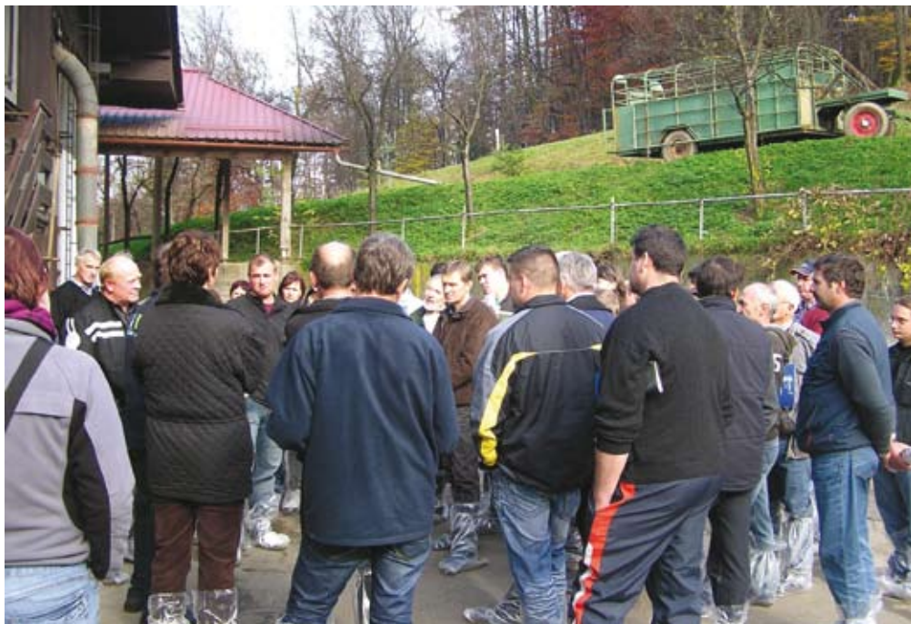
Člani mlečnega krožka iz Radelj ob ogledu kmetije Mis pod Šmarno goro pri Ljubljani

Od krožka do krožka se dejavnost članov pri razpravah in predlogih naslednjih tematik razlikuje. Po aktivnosti izstopajo mariborski, bistriški in ormoški mlečni krožki. Uspeh prenosa znanja do rejca je bistveno večji, če rejec iz lastnih izkušenj potrdi ali dopolni voditelja krožka. Najbolje je, če se na krožku konkretno rešujejo posamezne težave. Tukaj imamo pogosto težave s pomanjka-