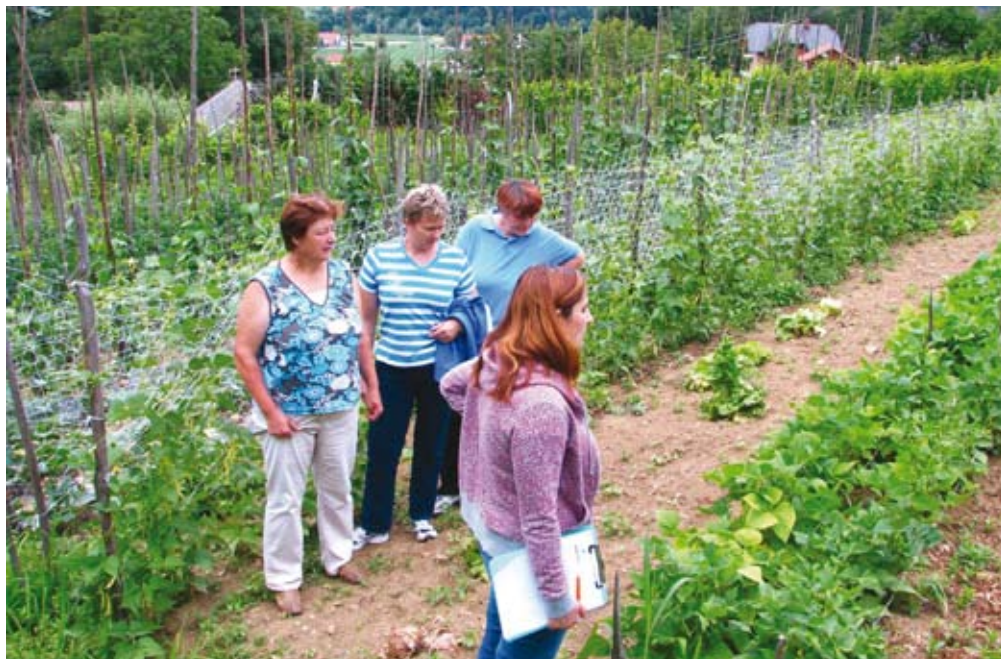
Spoznávali smo pridelavo zelenjave pri članici krožka.

Vsebina srečanj krožka v letu 2011 je bila zelo pestra in aktualna. Z delom v krožku smo pričeli tako, da smo spoznavali vrste zelenjave kot vir za zdrave pomembnih snovi. Na naslednjih srečanjih smo se spoznavali z osnovami pridelova-