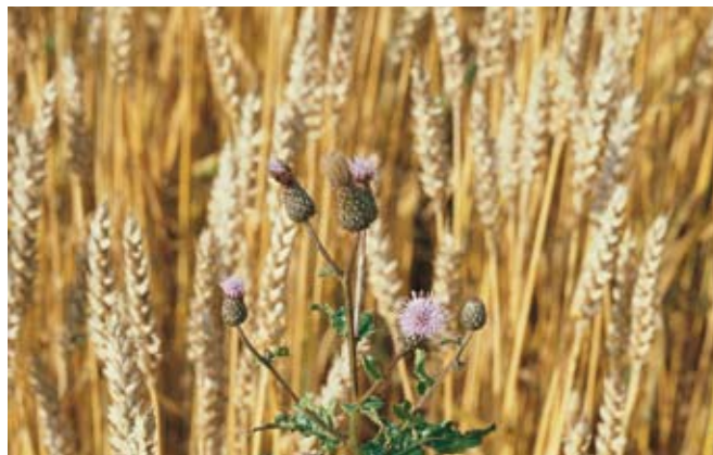
Njivski osat ( Cirsium arvense )