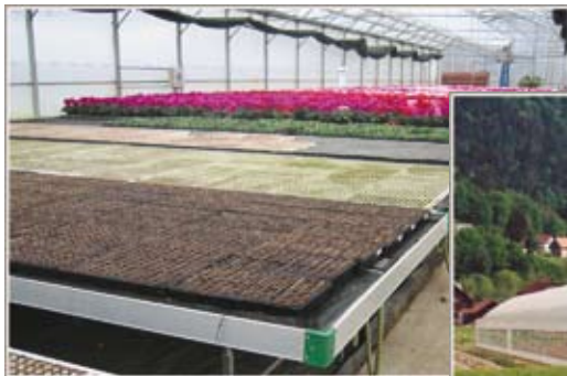
MIZE ZA RASTLINJAKE