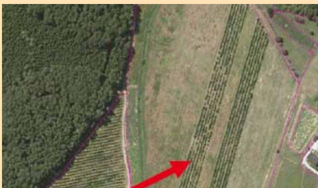
Nepravilno vrisan GERK (trajni nasad mora biti ločen GERK in ne del travniškega GERK-a)