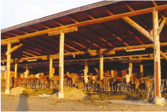
Svetel zračen hlev

mo pristojno veterinarsko službo. Pomembno je zdravstveno stanje kože, dlake, morebitna prisotnost zunanjih parazitov in stanje parkljev. Veliko pozornost moramo posvetiti praskam, vnetjem, oteklina skle-pov, šepavosti, poškodbam seskov in repa, ki so pogosto posledica nepravilno urejenih hlevov in slabega ravnanja z živino. Upošteevamo vse z rejo pogojene bolezni, okužbe in poškodbe živali, ki jih z ustrezno oskrbo lahko preprečimo, zlasti vse kriterije reprodukcije in dolgoživosti.