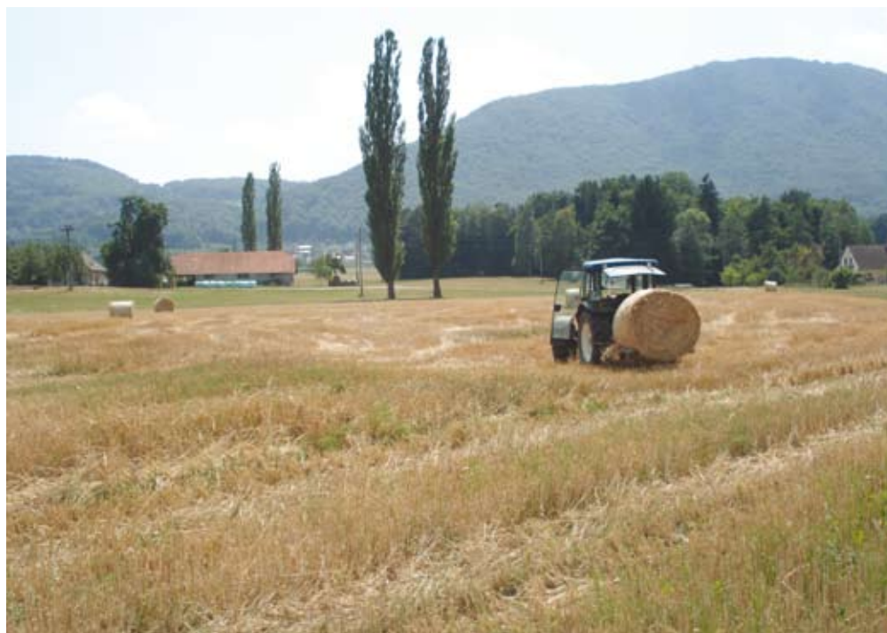
O pogojih pri posameznih ukrepih, rokih, postopkih, urejanju GERK-ov in drugem se pravočasno in čim bolj podrobno pozanimajte!

ja razmerje med variabilnim delom (dodeljene točke) in fiksni delom nespremenjeno v razmerju 45 : 55. Prav tako ostajajo nespremenjeni tudi kriteriji za dodelitev točk na ravni posameznih GERK-ov in kmetijskih gospodarstev.