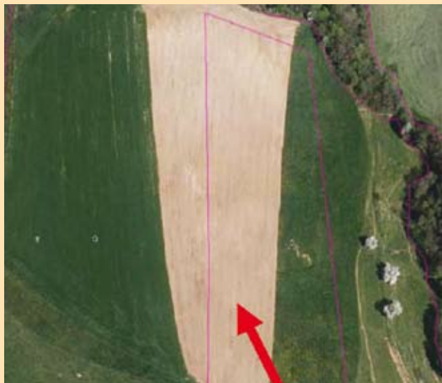
Nepravilno vrisan GERK (meje njive so nepravilno vrisane)