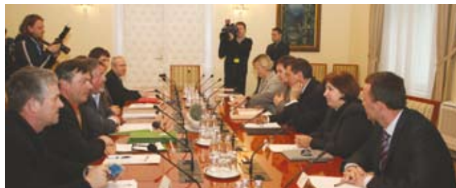
Predstavniki nevladnih kmetijskih organizacij pri predsedniku Vlade.

Predstavniki nevladnih kmetijskih organizacij so ponovno opozorili na nepravilna razmerja znotraj verige »od kmeta do kupca«. Minister Židan se je strinjal, da ne morejo podpirati netransparentnosti znotraj verige. Pravičnejša razmerja bi se lahko uredila tudi s posebnim kodeksom, ki pa bi moral biti po mnenju ministra obvezujoč in nadzorovan. Ciril Smrkolj je pou-