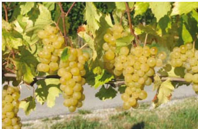
Na Primorskem je grozdje lepo dozorelo.

» TAMARA RUSJAN, » MOJCA MAVRIČ ŠTRUKELJ, » MAJDA BRDNIK KGZS – KGZ Nova Gorica