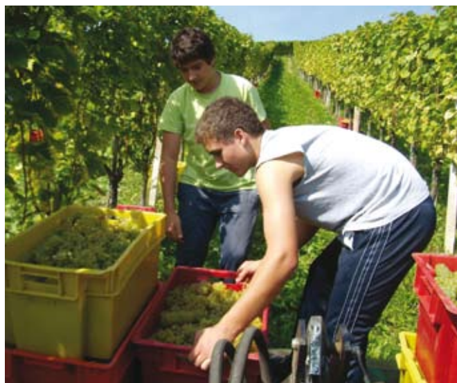
»Mladi veter« na trgatvi

Vinogradnik mora danes biti izredno prilagodljiv, še posebej mora znati prisluhniti potrošnikom, pivcem, njihovim zahtevam ter temu primerno prilagoditi stil vina, tehnologijo in nenazadnje določiti tudi optimalni še posebno neposre-