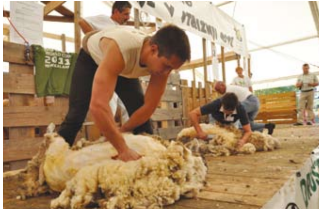
Striženje s škarjami še ni utonilo v pozabo.

Že vrsto let je v vrhu med tekmovalci z električnimi strojčki precejšnja izenače-