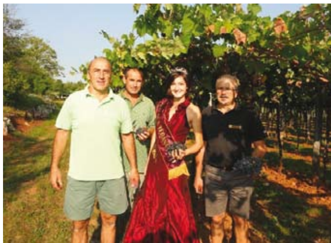
Tudi Kraljica terana je trgala.

kornih stopenj v grozdju, nekatere so se dvignile tudi do 25 brix (alkoholna stopnja v vinu čez 14 vol%). Kisline so nižje v primerjavi z letnikom 2010, vendar še vedno dovolj visoke in bodo skupaj z ostalimi spojinami pozitivno vplivale na harmonijo in bogat okus vina oziroma zelo dobro organoleptično oceno vina. Zdravstveno stanje grozdja je bilo odlično, razen v nekaterih vinogradih, kjer je bila kožica delno ožga-