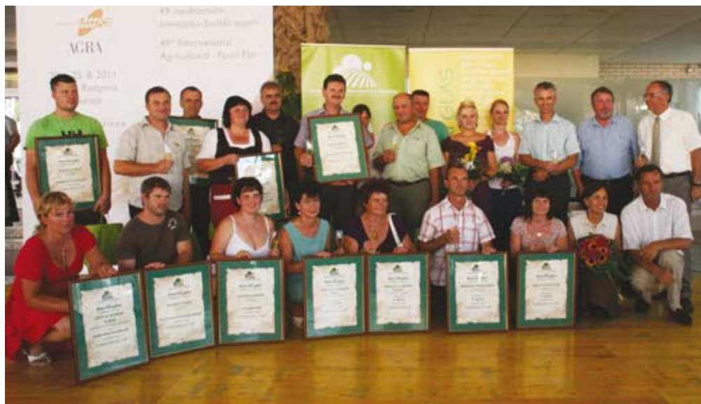
Letos je v akciji S kmetije za vas sodelovalo enajst odličnih kmetij. Akcija ocenjuje uspešnost promocije in domiselnost pri trženju kmetijskih pridelkov, izdelkov in storitev na kmetiji.