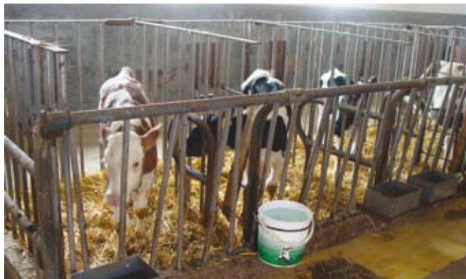
Individualni boksi za teleta, urejeni na opušenih stojiščih za krave

Teleta, starejša od 8 tednov, morajo biti nameščena v skupinah. To ne velja za gospodarstva, ki imajo na dan pregleda do 5 telet in sesna teleta, ki so ob materi. To pomeni, da so na vseh gospodarstvih lahko teleta do starosti 8 tednov v skupinskih ali individualnih boksih. Po tem času pa moramo teleta v rejah s šestimi ali več teleti iz individualnih združiti v skupinske bokse – vsaj dve teleti v