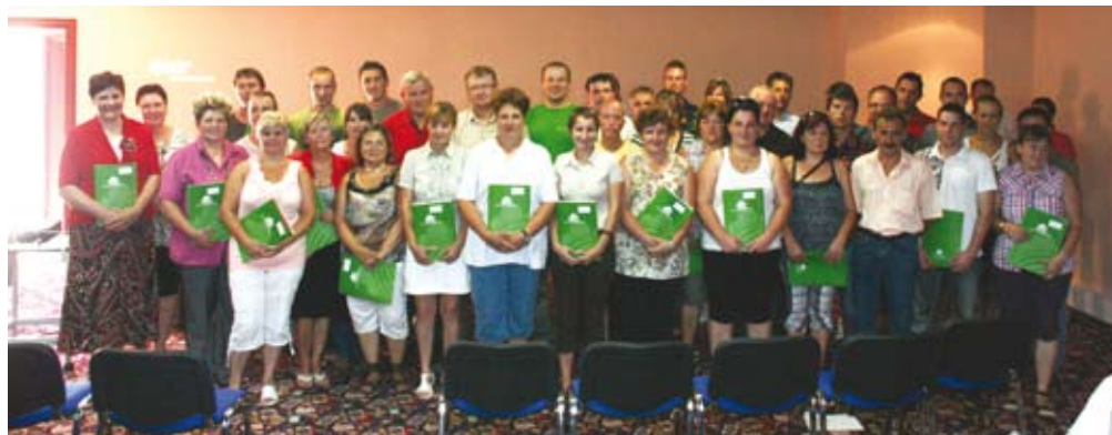
KGZS je na sejmu Agra podelila 153 certifikatov nacionalne poklicne kvalifikacije. Skupno je tako podeljenih že 1.811 certifikatov.