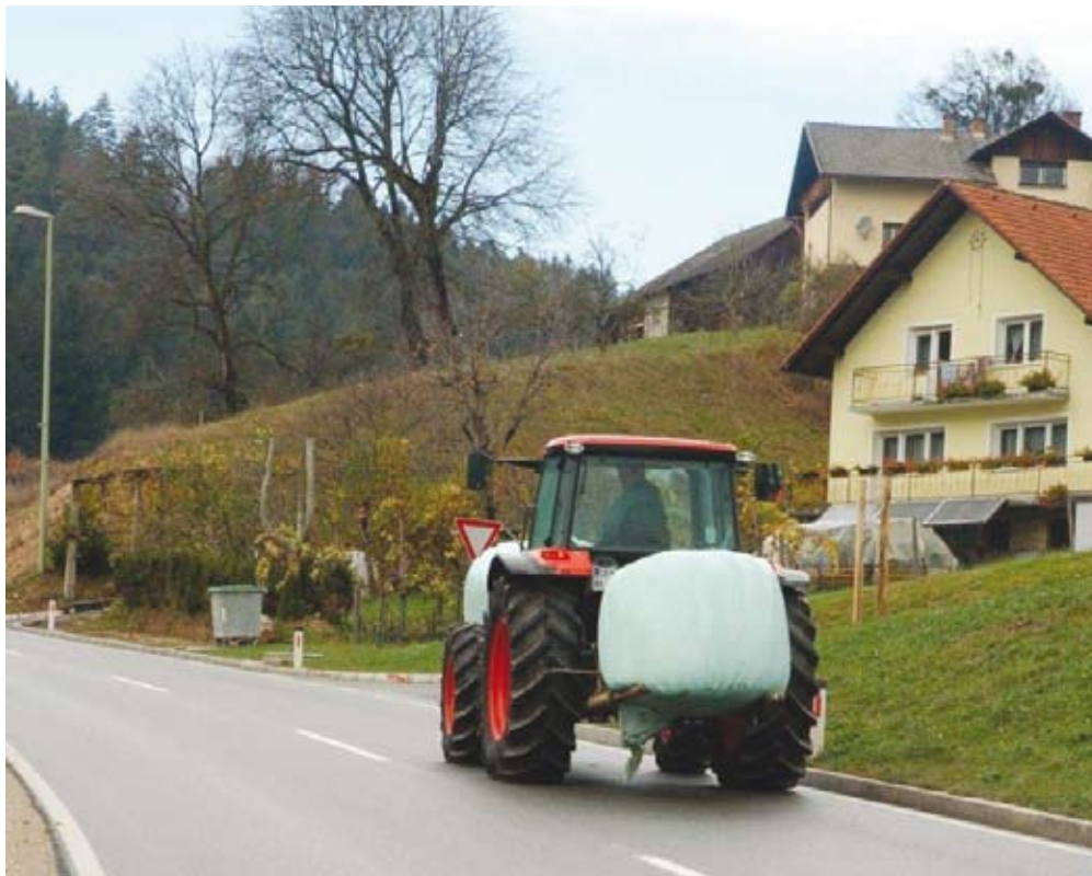
Izpit za kategorijo F je možno pridobiti tudi na podlagi opravljenega izpita za osebni avto, znanje pa se nadgradi s tečajem varnega dela s traktorjem in traktorskimi priključki.

s tečajem varnega dela s traktorjem in traktorskimi priključki (54. člen ZVoz).