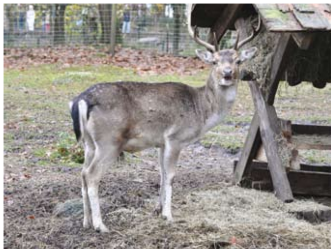
V Uradnem listu RS 71/2010 je bil objavljen Pravilnik o ekološki pridelavi, ki uvaja tudi ekološko rejo divjadi v oborah.

Za ekološko rejo v oborah so primerni damjaki ( Dama dama ), mufloni ( Ovis musimon ) in navadni jeleni ( Cervus elaphus ). Živali za čredo morajo izhajati s kmetij, kjer gospodarijo v skladu z uredbami in pravilnikom, ki urejajo ekološko kmetovanje. Za začetek ekološke reje, v prvem letu preusmeritve ali če ni na voljo zadosti ekološko vzrejenih živali je izjemoma dovoljen nakup živali iz konvencionalne reje. Za nakup neekološko vzrejenih živali mora kmet