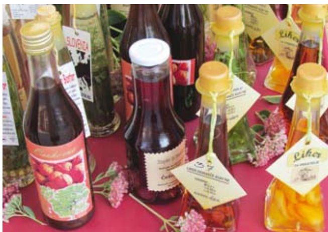
Slovenski kmetje in kmetice so obiskovalcem tudi tokrat ponudili mnogo raznovrstnih izdelkov.