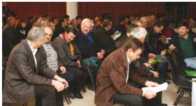
Dan po nujni razpravi, na kateri se je zbralo več kot 170 udeležencev, je bil ustanovljen protestni odbor nevladnih organizacij.

skupne kmetijske politike in državnih pomoči, prenizek. Protestni odbor zahteva, da se prag za vodenje obveznega knjigovodstva na kmetijah zviša na 15.000 evrov. Nevladne kmetijske organizacije ugotavljamo, da je odstotek pripisanih plačil iz naslova ukrepov skupne kmetijske politike v osnovo za odmero dohodnine previsok. Zato zahtevamo, da se s predlaganih 50 odstotkov zniža na 30 odstotkov. Iz Zakona o spremembah