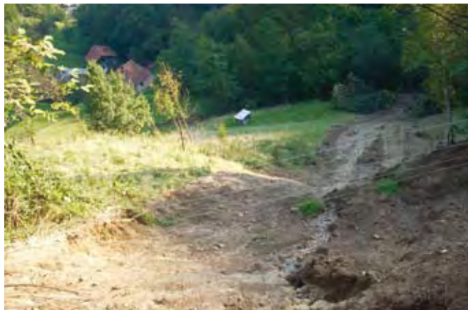
Na območjih, kjer so pojavi plazov pogosti, živi in dela 18 odstotkov slovenskega prebivalstva. Škode zaradi plazov so v letih od 1994 do 2008 dosegle vrednost 99,07 milijona evrov, brez stroškov sanacije.

Poleg sanacij, ki so stroškovno zahtevne in velikokrat težje izvedljive, bi bilo v prihodnje priporočljivo izvajati tudi določene preventivne ukrepe na območjih, kjer je velika verjetnost pojavljanja plazov ter tako doseči zmanjšanje pojavljanja plazov v prihodnje. Priložnost za tovrstno ureditev vidimo ob razpravah o bodočem razvoju kmetijstva v Sloveniji ter pripravah na