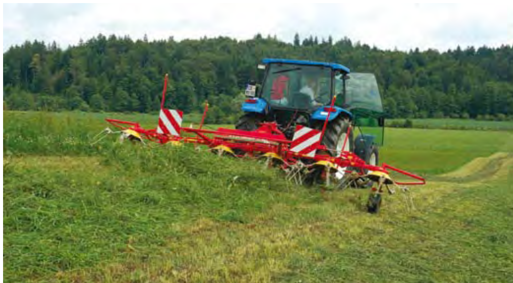
Zaradi sodobne kmetijske mehanizacije mladi z večjim veseljem ostajajo na domači kmetiji.

Lastna kmetija omogoča visoko kakovost življenja. Jest lastno hrano je prestiž. Gibanje na svežem zraku vrednota. Stik z naravo pomeni tudi stik s samim se-