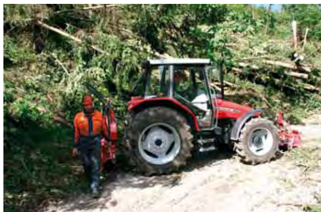
Ocenjujemo, da je v Sloveniji vsaj 10 tisoč kmetij, kjer gozd ima in bo tudi v bodoče imel osrednjo gospodarsko vlogo.

Prav gotovo pa za kritično lahko označimo koliko neposredne razvojne vzpodbude je izplačane kmetom, ki gospodarijo z gozdovi. V okviru državne in skupne evropske politike, kjer so bila sredstva za kmetijstvo in gozdarstvo načrtovana za sedemletno obdobje, lahko na osnovi izplačil vidimo, da je bilo npr. v letu 2009 okrog 300 milijonov evrov namenjenih neposrednim plačilom iz evropskega kmetijskega jamstvenega sklada ter iz evropskega kmetijskega sklada za razvoj podeželja, iz katerega je bilo tudi za edini povsem gozdarski ukrep »Povečanje gospodarske vrednosti gozdov« lani izplačanih 5,4 milijonov. Še nekaj sredstev za gozdarstvo je bilo iz drugih ukrepov, predvsem iz ukrepa »Dodajanje vrednosti kmetijskim in gozdarskim proizvodom«. Upoštevati moramo še sredstva, ki jih gozdovom namenja samo državni proračun za obnovo, nego in varstvo gozdov, vzdrževanje gozdnih cest in drugo, za lansko leto v skupni višini 4 milijone evrov. Enostavna primerjava pokaže na znano dejstvo, da država in Evropska unija prispevata za gozdarstvo le nekaj odstotkov vseh javnih sredstev, ki gredo za kmetijstvo in gozdarstvo v naši državi, čeprav moramo v