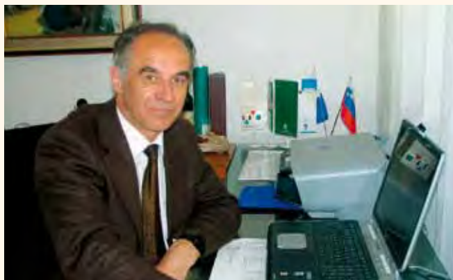
Vabim vas v Gornjo Radgono na 48. Mednarodni kmetijsko-živilski sejem AGRA!

Letošnja prireditve poleg celovite predstavitev bleščečih svetov-