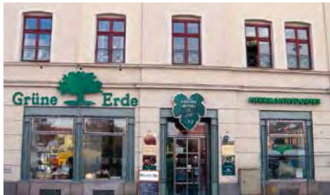
Lična prodajalna kmetije Herrmannsdorf

ostanejo do dve leti. Po stari navadi tudi drugi siri zapustijo zoričnico šele po devetih mescih.