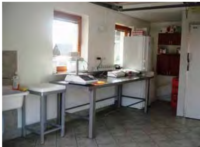
Urejen prostor za prodajo ekološkega surovega mesa na ekološki kmetiji Jenštrle.