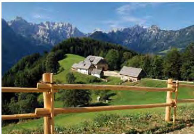
Pravni red določa zelo omejevalna pravila glede razpolaganja s premoženjem zaščitene kmetije.

Zapustnik sme v oporoki nakloniti volilo (= v oporoki zapisano naklonilo osebi, ki ni dedič), katerega predmet je del zaščitene kmetije, če s tem znatno ne prizadene gospodarske sposobnosti zaščitene kmetije.