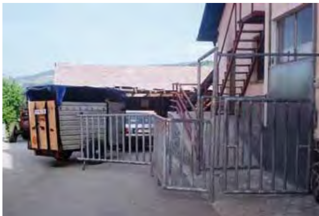
Urejen vhod v klavnico na ekološki kmetiji

tovanju. Natrijev nitrit in kalijev nitrat sta dodatka, ki se sicer smeta uporabljati v omejeni količini do leta 1013, potem pa bo Evropska komisija ponovno preučila in podala mnenje o njuni morebitni nadaljnji uporabi. Glede na dejstvo, da je vedno več ljudi, ki so na dodatke alergični, tradicionalna slovenska predelava mesa pa jih ne pozna in ne uporablja, je mesni izdelek brez aditiva največja priložnost za slovenske kmetije.