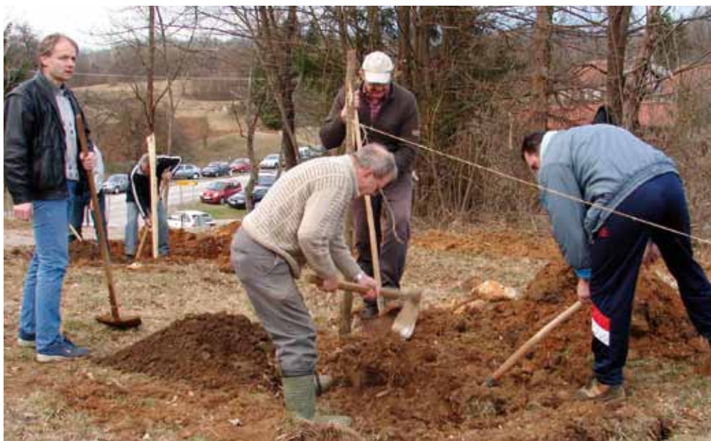
Priprava belokranjske čebelarke učne poti

»Če bi čebela izginila z obličja sveta, človeku ne bi ostalo več kot štiri leta življenja. Nič več čebel,