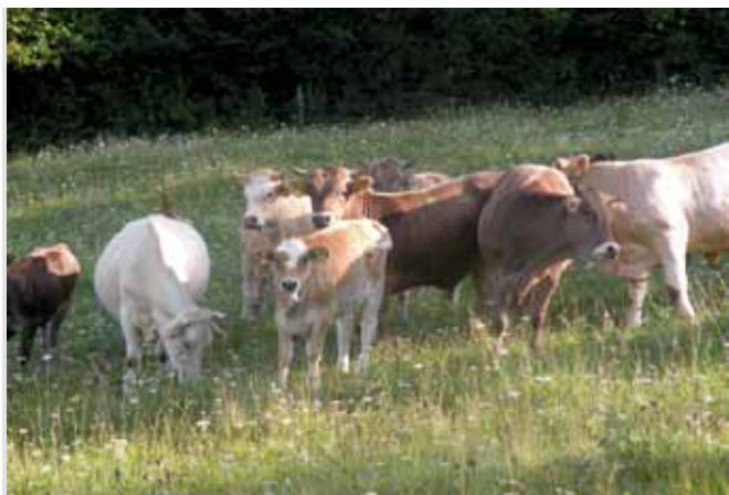
Neustrezno urejena reja govedu je na vrhu seznama neskladij.

ustrezno sankcijo. Kmetovalec mora ugotovljeno neskladje odpraviti v določenem roku.