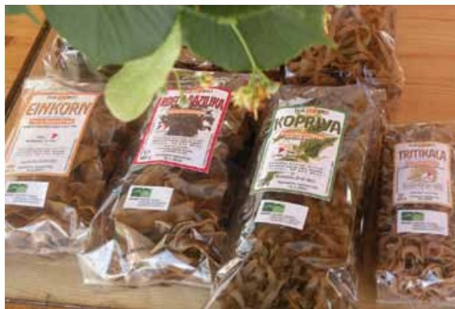
Vsi pridelki in živila z ekoloških kmetij morajo biti ustrezno označeni.

veljavi certifikat za tisto proizvodno serijo, za katero je bilo ugotovljeno neskladje oz. kršitev. V skladu s pravili o ekološki pridelavi in predelavi so razlogi za zavrnitev ali razveljavitve certifikata naslednji: uporaba kemičnih sintetičnih sredstev (za varstvo rastlin, gnojil, krme) in gensko spremenjenih organizmov, neustrezna krma, neustrezna reja živali, preven-