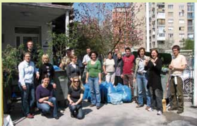
Zaposleni na Zborničnem uradu (KGZS) so vreče in kontejnerje pred svojo stavbo na Celovski 135 napolnili v petek, 16. aprila.