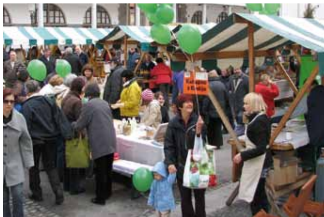
Promocijsko-prodajne prireditve Podeželje v mestu so postale stalnica v življenju naše prestolnice.