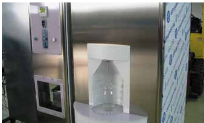
Naši ponudniki mleka lahko izbirajo med uvoženimi ali v Sloveniji izdelanimi mlekomati.

Tehnološko dovršeni sistemi imajo vgrajen sistem, ki ne dovoljuje izdaje mleka, ki je starejše od 24 ur. Če se mleko v roku 24 ur ne zamenja, se delovanje sistema ustavi. Prav tako se delovanje ustavi, če pride do nenadzorovanega dviga temperature mleka. Kmetovalec je o stanju mleka in mlekomata sproti obveščen preko modula GSM, kar mu omogoča pridobitev informacij na telefon. Potrošnik lahko iz sistema odčita temperaturo mleka, datum in uro pripeljanega svežega mleka. Točilni prostor se razkuži po vsakem točenju mleka s pomočjo posebnih UV svetilk, ki delujejo antibakteriološko. V