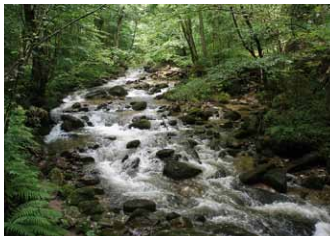
Na podlagi prijave bo Sklad kmetijskih zemljišč in gozdov pripravil razpis za podelitev koncesij za državne gozdove.

kvalifikacije (za gozdarja sekača, gojitelja in traktorista), pri čemer bo sam imel opravljeno vsaj eno nacionalno poklicno kvalifikacijo, ali da bo imel upravičenec do kandidature opravljeno poklicno ali srednjo gozdarsko šolo.