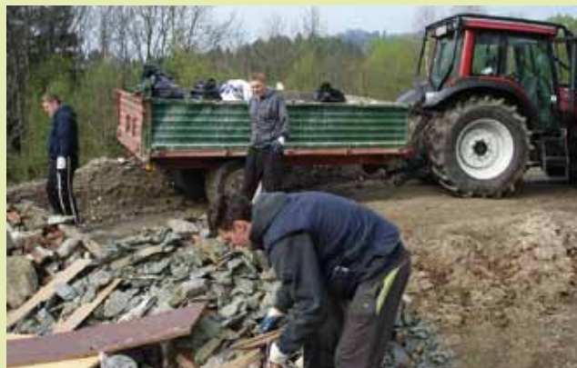
Iz Zveze strojnih krožkov Slovenije so s traktorji in prikolicami sodelovali tudi na Koroškem.