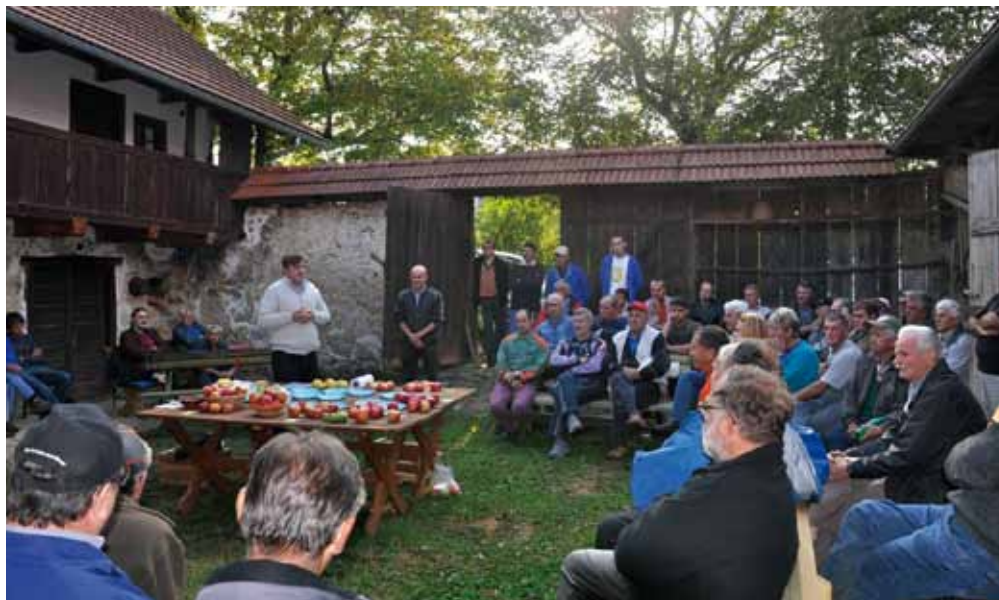
Izobraževanje za čebelarje in sadjarje na belokranjski učni poti v Žuničih (Šobčev dvor)

medsebojno odvisni. V želji po poglobitvi sodelovanja smo prijavi in v letu 2009 začeli izvajati projekt z naslovom: Čebele kot nosilec biotske raznovrstnosti , financiranega s strani programa Finančnega mehanizma EGP in Norveškega finančnega mehanizma, Sklada za nevladne in neprofitne organizacije.