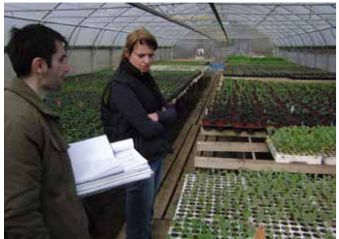
Kontrola ekološke pridelave sadik zelenjadnic in zelišč

be nedovoljenih sredstev lahko kontrolor odvzame vzorce (prisotnost ostankov FFS, težkih kovin in GSO). Kontrolor v zapisnik zapiše morebitne ugotovljene neskladnosti in hkrati vsaki neskladnosti dodeli