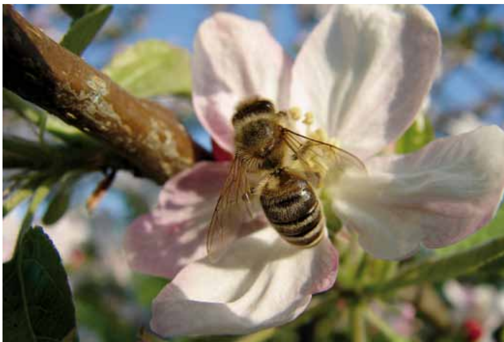
Vrednost oprashavanja je mnogo večja, kot je vrednost čebeljih pridelkov.

Pri ljubiteljski sadjarski pridelavi je potrebno za pravočasno in kakovostno oprashitev 1 hektara sadovnjaka z različnimi sadnimi vrstami imeti dve do tri čebelje družine na hektar, pri intenzivni pridelavi jabolk tri do štiri družine, pri hruškah, višnjah in češnjah pa od šest do osem čebeljih družin na hektar sadovnjaka. Za druge kmetijske kulture, kot so oljna ogrščica, ajda, sončnica, kumarice in podobne, potrebujemo za kakovostno oprashavanje tudi do deset čebeljih družin na hektar. Z organiziranimi prevozi čebel na območja, zasejana s kmetij-