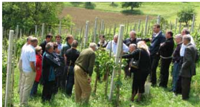
Praktični prikaz rezi

Vinogradništvo in vinarstvo sta pomembni kmetijski panogi, saj sta tesno povezani z drugimi dejavnostmi in imata pomembno vlogo pri ohranjanju kulturne krajine, še posebno na območjih s težjimi pridelovalnimi pogoji.