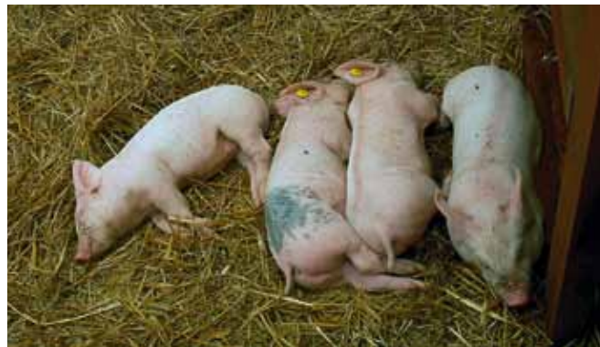
Prašiče je potrebno označiti čim prej po rojstvu.

Imetnik, ki prašiče oddaja, izda spremni list (izpolni in podpiše obrazec). Original in prvo kopijo spremnega lista izroči novemu imetniku ter odhod živali z gospodarstva javi v centralni register prašičev na način, da drugo kopijo spremnega lista »ODHOD« posreduje pristojnemu veterinarju najkasneje v štirih dneh. Prav tako je v RPG potrebno vpisati odhod živali.