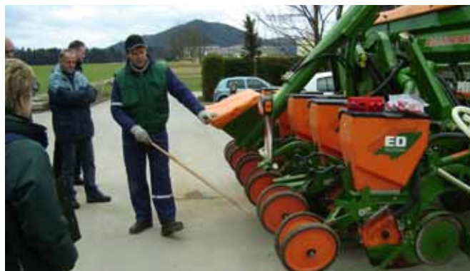
Prikaz preureditve podtlačnih sejalnic za setev tretiranega semena koruze

pridelava hrane za preko 100 soživiljanov, ki lahko zaradi tega delajo kaj drugega in se ne ukvarjajo s pridelavo hrane (kot je še pred 50 leti vsaj 70 % prebivalstva). A ko se kmet odloči za investicijo, se pogosto znajde v nepregledni džungli ponudbe. S spremljanjem razvoja in novosti na trgu smo s pripravo člankov v tiskanih in elektronskih medijih poskušali ločiti zrna od plev in obveščati čim več kmetov. Na predavanjih, delavnicah, predvsem pa z individualnim svetovanjem smo skupaj z bodočimi investitorji iskali prave rešitve za njihove kmetije. A po pravilu smo pred izbiro strojev najprej poiskali odgovor, ali je investicija res potrebna, ali ni mogoče ceneje in udobneje najeti storitev za neko delo preko dopolnilnih dejavnosti ali v okviru strojnih krožkov. Strojnim krožkom smo nudili strokovno svetovanje in pogosto opravljali tudi tajniške in mentorske naloge. Da so stroji nevarni, če z njimi ne delamo varno, čivka že vsak drugi vrabec, a vsi skupaj naredimo bolj malo, da bi zmanjšali