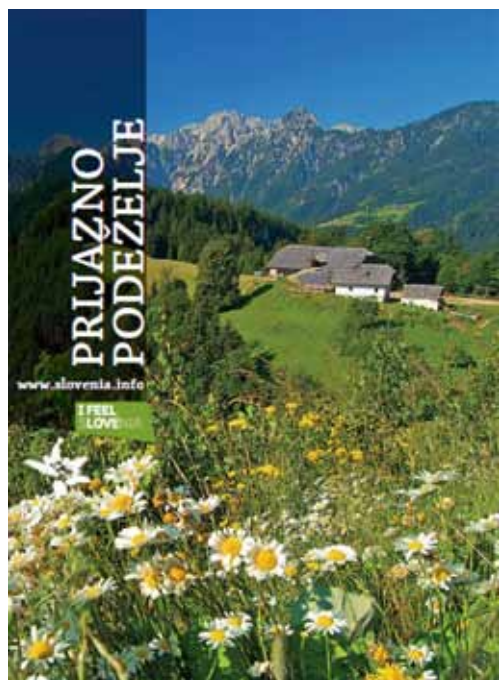
Katalog je zelo pomemben za promocijo turističnih kmetij.