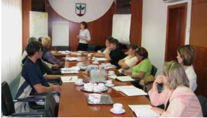
Kmetijsko gozdarski zavod Ljubljana s projektnim delom in partnerji dejavno deluje pri izvajanju lokalnih pobud.

ni in izobraževalni dnevi, Oživitev in promocija blagovne znamke Črni graben, Kvalitetno slovensko meso nastaja že v reji in S srcem pridelujemo kakovostno sadje. Projekt Sadovnjak, travnik in vrt naj bo z zna-