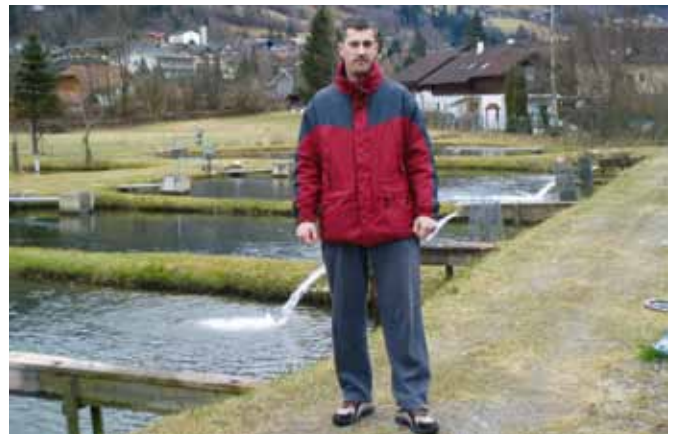
Svetovalec za ribogojstvo dela na območju cele Slovenije.

Na KGZS – Zavodu Kranj deluje specialistična služba za ribogojstvo. Delo svetovalca specialista za ribogojstvo zaradi omejenih naravnih virov in s tem povezanim številom ribogojnih