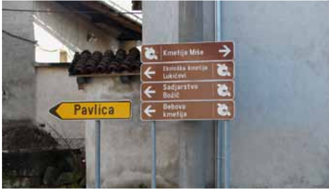
Kažipotji v Brkinih usmerjajo obiskovalce na kmetije, ki prodajajo sadje.

programskem obdobju smo kot partnerji sodelovali v projektu Brkinska sadna cesta in Revitalizacija gojenja fig v Istri.