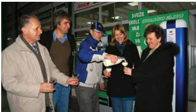
Novi mlekomat v Kopru je izjemen zato, ker prvi v Sloveniji »ponuja« ekološko mleko.