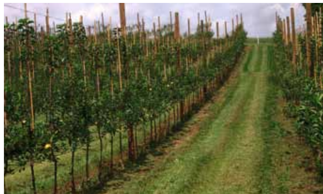
Do gosto sajenih ekoloških nasadov s sodobno tehnologijo.

Obrezovanje sadnega drevesa je tudi eden izmed tistih redkih ukrepov, ki ga imamo sadjarji dobesedno popolnoma v svojih rokah. Z obrezovanjem usmerjamo drevo v rodnost, rast, osvetlujemo, redčimo, popravljamo, vzdržujemo v kondiciji, skratka skrbimo za dobro gospodarjenje drevesa z vsemi resursi. Vsi ukrepi, ki jih opravimo v sadovnjaku, imajo osnovo v fiziologiji dreve-