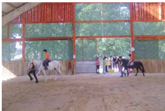
Z investicijo v izgradnjo pokrite jahalnice se je povečal prihodek na kmetijo. Ježa konj je možna preko celega leta.