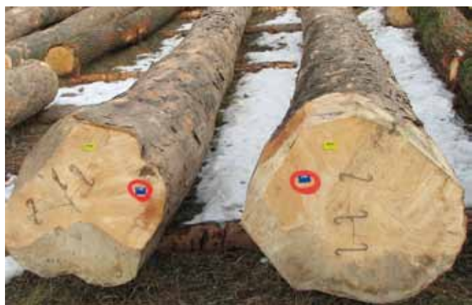
Polnolesna debela debelin do 40 cm pustimo še nekaj časa, ker pridobivajo na vrednosti.

ponudba nižja od lastnikove najnižje določene cene, mora lastnik v roku 3 dni sporočiti, ali bo prodal hlod po nižji ceni ali pa ga bo na svoje stroške odpeljal z mesta licitacije.