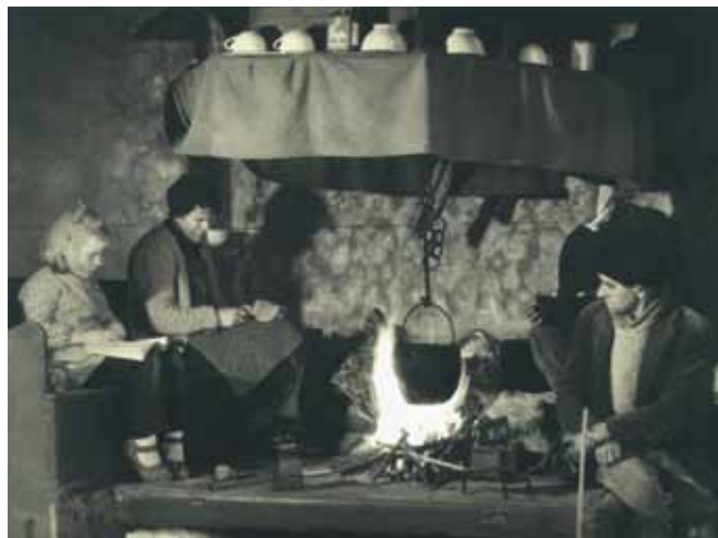
Družina na kmetiji nekoč

Na primerih dobrih praks vidimo, kako lahko nova dejavnost popolnoma spremeni sliko kmetije. Kaj pa je lahko ta nova dejavnost? Na prvem mestu so to dopolnilne dejavnosti, kot jih poznamo v tradicionalnem smislu: od predelave različnih kmetijskih in gozdnih proizvodov, različnih oblik turizma na kmetijah, tradicionalnih znanj, do nekoliko drugačnih možnosti, ki jih odpira Program razvoja podeželja 2007-2013. Odkupa, kot so ga poznale naše kmetije, marsikje ni več. Iskanje novih prodajnih poti odpira nove možnosti: kmečke tržnice, prodaja na kmetiji, avtomati za prodajo mleka, povezovanje s šolami, vrtci, turističnimi centri ... Skrajševanje prodajnih poti pomeni več denarja za kmeta in več zadovoljstva za kupca. Nekaj kmetij lahko uspe z novo, na trgu ne tako običajno ponudbo: pašna prireja mesa, jajca pašnih kokoši, reja pegatk, gosi, kuncev, sušenje kakija, pridelava bio so-