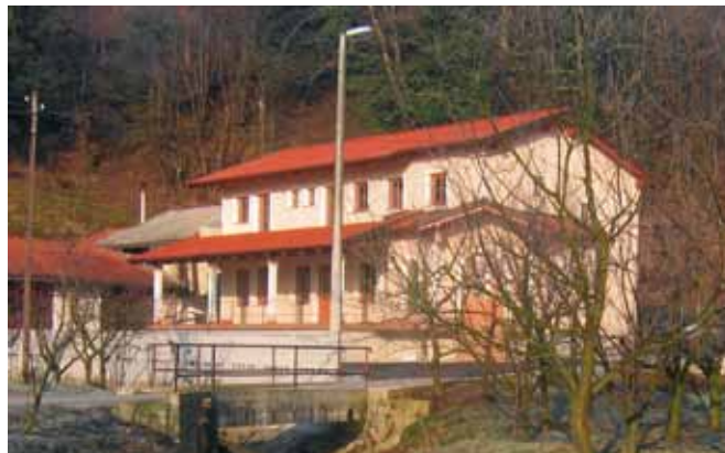
Izletniški turizem na kmetiji Ivankotovi pod Premom