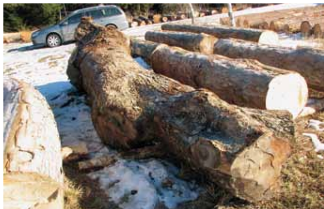
Hlodi morajo biti pravilno krojeni. Drva pustite doma!