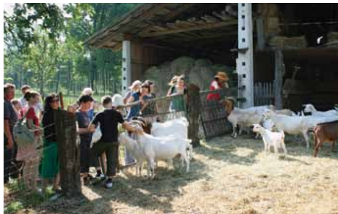
Za zainteresirane je bil organiziran dan s kontrolorjem.

bavo ekoloških živil. Predstavitev nim prikazom kuharskega mojstra in poskušajo.