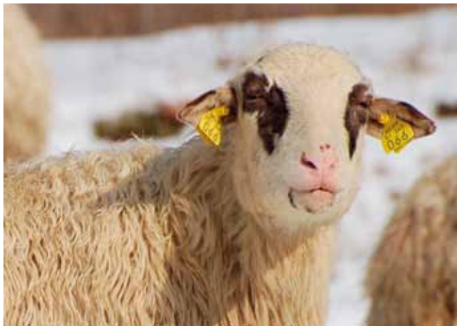
V letu 2010 bo prišlo do sprememb pri vodenju registra drobnice.