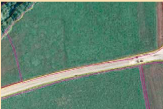
Prikaz nenatančno vrisanih mej GERK-a ob cesti

V letu 2005 je Slovenija za namene uveljavljanja ukrepov kmetijske politike vzpostavila tako imenovani sistem GERK-ov (Grafična Enota Rabe Kmetijskih gospodarstev), s katerim lahko zelo natančno določa upravičene površine za izplačila sredstev. Ker se stanje v naravi ves čas nekoliko spreminja, v preteklih letih pa so bili kot podlaga za vrisovanje GERK-ov narejeni tudi novi letalski posnetki, je potrebno stalno posodabljeni vris GERK-ov.