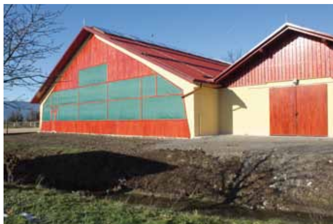
Le en zahtevek za dodelitev sredstev ob dokončani investiciji je za kmetijo predstavljal zelo veliko težavo.

Investiciji sedaj služita namenu. Z investicijo v izgradnjo pokrite jahalnice se je povečal dohodek od dopolnilne dejavnosti na kmetiji ježa konj, saj je ježa konj možna preko celega leta. Posledično se je ohranilo delovno mesto nosilca kmetijskega gospodarstva. Z investicijo v izgradnjo hleva pa so se izboljšali pogoji reje konj.