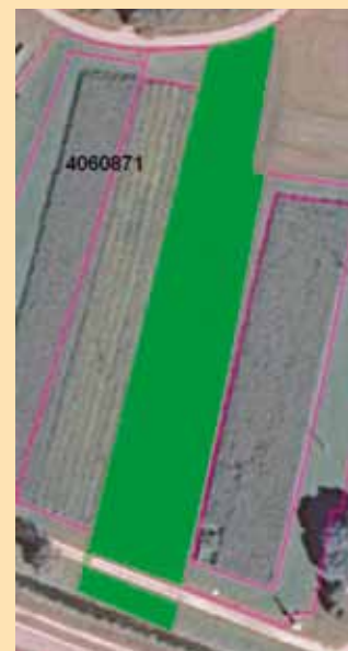
»Mostiček« - povezovanje manjših kmetijskih zemljišč z isto dejansko rabo v eno parcelo preko ceste

Za reševanje teh neskladij se je Ministrstvo za kmetijstvo, gozdarstvo in prehrano (Ministrstvo) odločilo za posodobitev GERK-ov še pred kampanjo za oddajo zahtevkov v letu 2010.