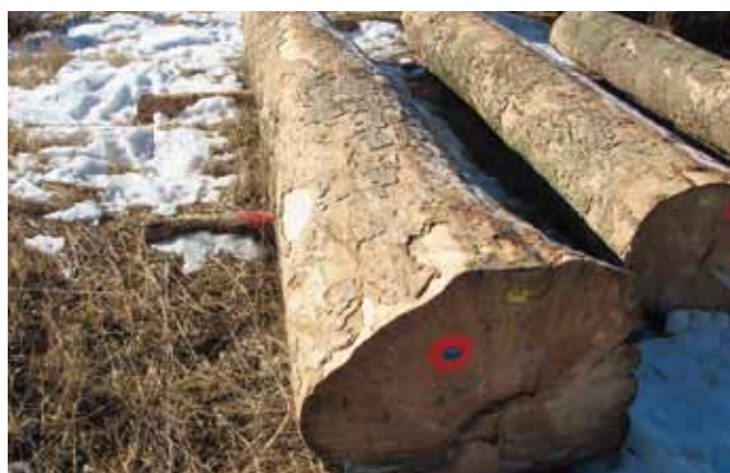
Listavce krojimo do prve napake. Najkrajša dolžina je 2,5 m.