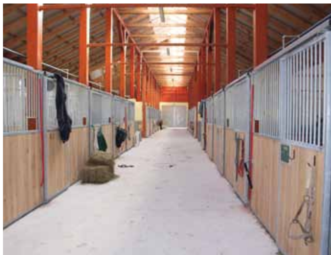
Nov hlev zagotavlja dobro počutje konj.