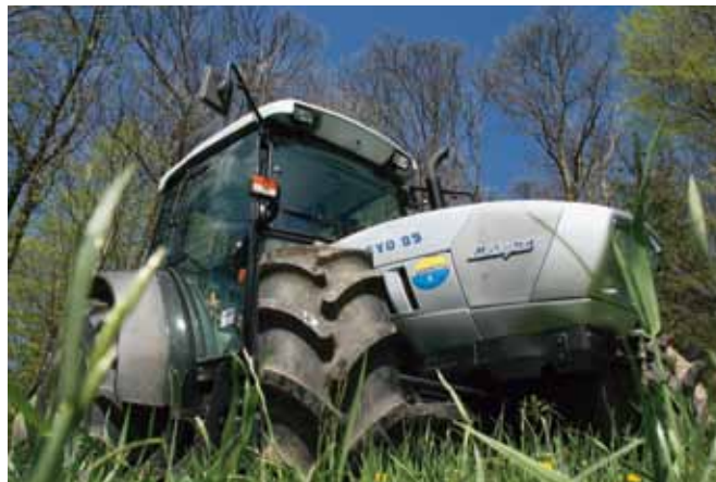
Prepogosto odločitev za investicijo v novo in drago mehanizacijo ni ekonomično upravičena.

tako zelo različna in se giblje med 14 in 40 ha kmetijskih zemljišč v uporabi. Odvisna je od več različnih dejavnikov, še zlasti pa od: