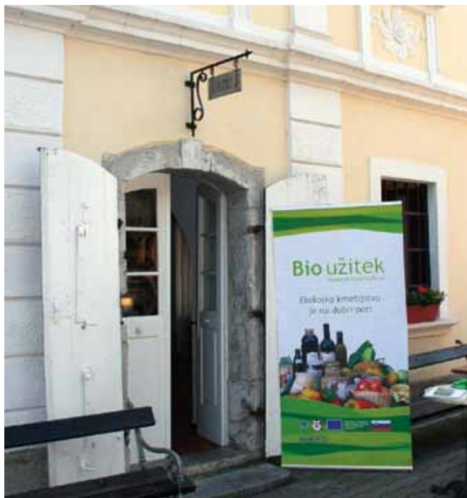
Promocija ekološkega kmetijstva

Samo v tem letu so delno že izvedli ali pa še načrtujejo 39 različnih akcij – promocijskih dogodkov po celi Sloveniji. Paleta dogodkov sega od strokovnih srečanj v obliki seminarjev, preko predstavitev v medijih do organiziranja srečanj s potrošniki in predstavitev ekoloških izdelkov.