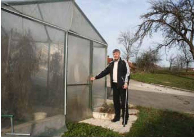
V domačem rastlinjaku pridelajo kar nekaj zelenjave, ki jo poleg domačega jabolčnega soka in kisa ponudijo gostom na turistični kmetiji in v gostišču.

gozda z njimi niti ni več povezan, zato je takšnega lastnika težje prepričati v nujnost posega v gozd oziroma v gradnjo gozdnih prometnic. Prav tu bi morala društva lastnikov gozdov v sodelovanju s Kmetijsko gozdarsko zbornico Slovenije in Zavod za gozdove Slovenije odigrati pomembno vlogo pri izobraževanju lastnikov gozdov. Ta izobraževanja bi morala biti vsem dostopna, na njih pa bi se lastniki gozdov lahko poučili o nujnih vzdrževalnih delih v gozdu in varnosti pri delu v gozdu.