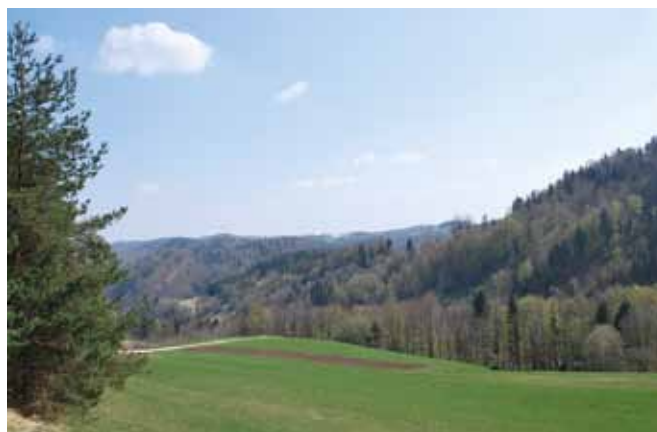
Plačilne pravice se lahko prenašajo trajno kot prodaja plačilnih pravic z zemljiščem ali brez in začasno kot zakup plačilnih pravic z zemljiščem.

Za prenos plačilnih pravic morajo upravičenci uporabiti obrazce, ki so dostopni na internetnih straneh Agencije za kmetijske trge in razvoj podeželja (v nadaljevanju ARSKTRP) ( http://www.arsktrp.gov.si ) ali na izpostavah kmetijske svetovalne službe. Zaradi enostavnejšega izpolnjevanja so obrazci razdeljeni na vrsto prenosa, zato morajo biti vlagatelji pozorni pri izbiri obrazca, katerega izpolnijo glede na vrsto prenosa plačilnih pravic. Za lažje izpolnjevanje obrazcev je ARSKTRP pripravila tudi navodila za izpolnjevanje. Pomembno je, da se pri izpolnjevanju obrazcev izpolnijo vse potrebne rubrike v posameznem obrazcu in se tako izognete najpogostejšim nepravilnostim, ki jih je ARSKTRP zaznala v preteklih letih pri prenosu plačilnih pravic.