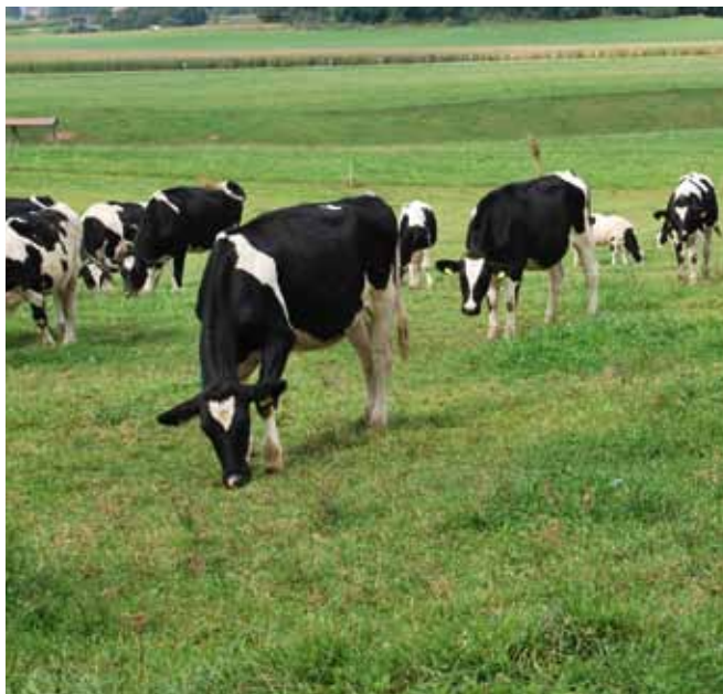
Prepozna registracija in sporočanje premikov govedu je lahko vzrok za zavrnitev zahtevkov za posebne premije!

Pravočasnost registracije govedu in sporočanja premikov se v celotnem življenju živali kontrolira v okviru navzkrižne skladnosti. Za namen izvajanja zahtev za dodatno plačilo za ekstenzivno rejo ženskih govedu in posebno premijo za bike in vole se na podlagi sodbe evropskega sodišča in spremembe Uredbe Sveta 1782/2003 oz. 73/2009 pravo-