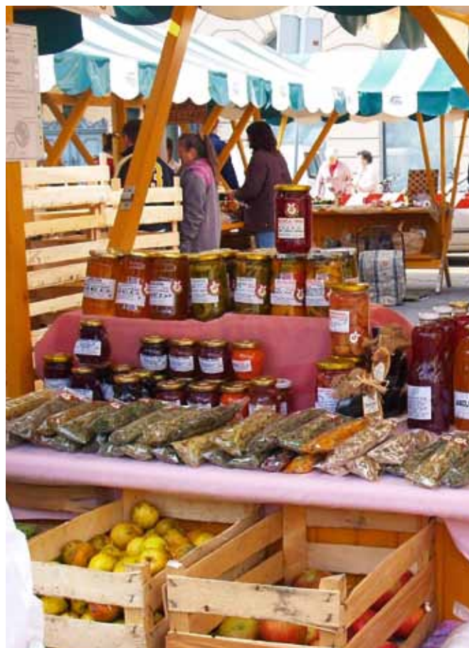
Odzivi kupcev na ekoloških tržnicah so obetavni!