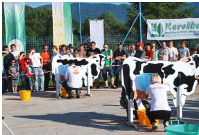
Molža fantomske krave je pritegnila veliko pozornosti.