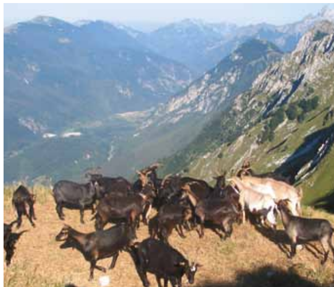
Tudi drobnica ima pomembno vlogo pri kroženju snovi na ekoloških kmetijah.