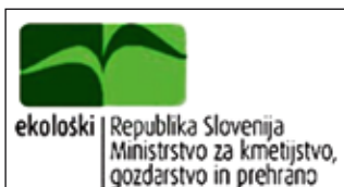
Slovenski nacionalni zaščitni znak