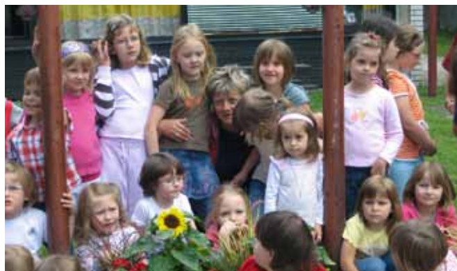
Aktivnosti s predšolskimi otroci v okviru projekta Leader

*KGZS - Zavod Ljubljana je upravljevec LAS Društvo za razvoj podeželja Zasavje