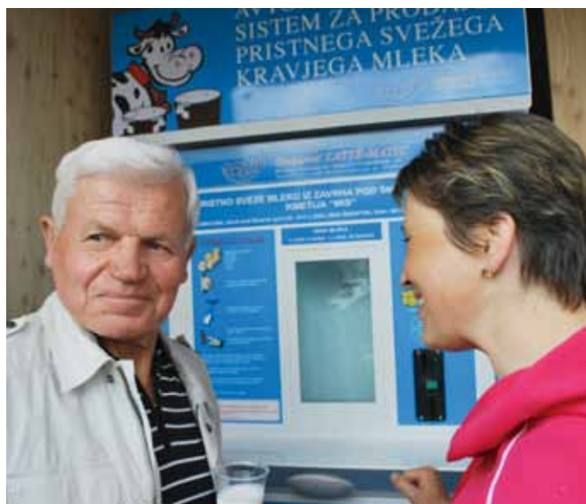
Prodaja svežega surovega mleka s t.i. mlekomati je v sosednji Avstriji pogosta, pri nas pa si še vtira pot.