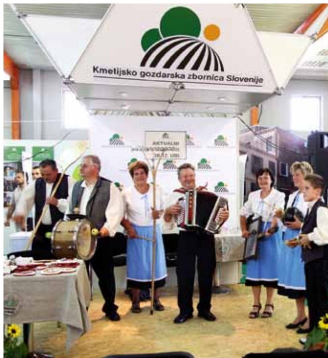
Veseli utrinek z lanskoletne predstavitve KGZS na sejmu.

Vabljeni na razstavni prostor KGZS na prizorišču Svetovnega prvenstva v oranju v Tešanovcih pri Moravskih Toplicah!