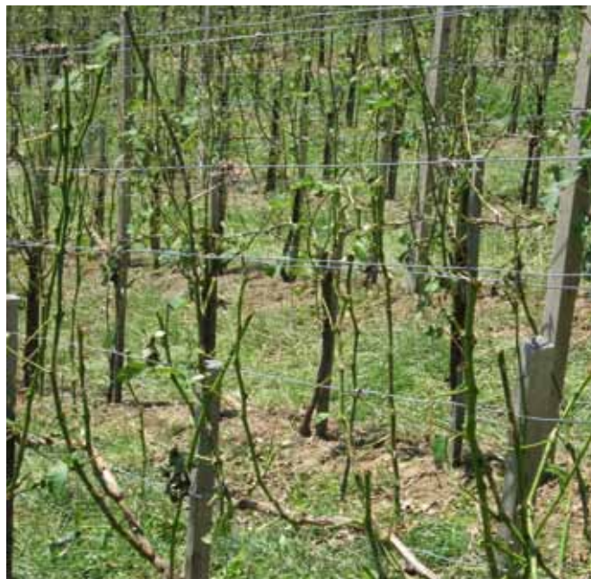
Vinograd v Svečini po neurju 16. junija

in da se pri tem uporabijo izkušnje ter načini, ki jih uporabljajo v naši neposredni sosesčini. Eden od načinov zadovoljive obrambe so tudi zaščitne mreže proti toči, zato bi bilo prav, da ministrstvo temu načinu zaščiti nameni več sredstev.