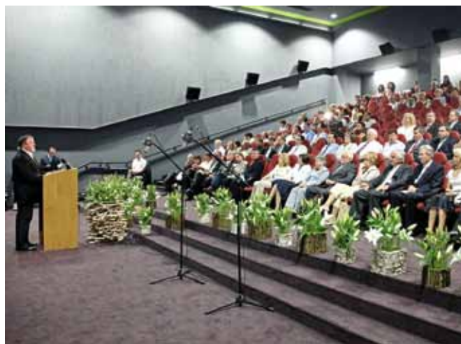
Tokrat je slovesnost ob obletnici ustanovitve KGZS potekala v Prekmurju. Nov datum je spomin na uspešno izpeljane proteste kmetov leta 1993.

se je zbornica oblikovala v strokovno institucijo, ki zastopa interese kmetijstva. Danes smo imeli priložnost slišati, v katerih segmentih reševanja problematike kmetijstva je imela zbornica pomembno vlogo.