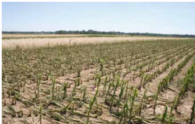
Popolnoma uničena koruza v Prekmurju