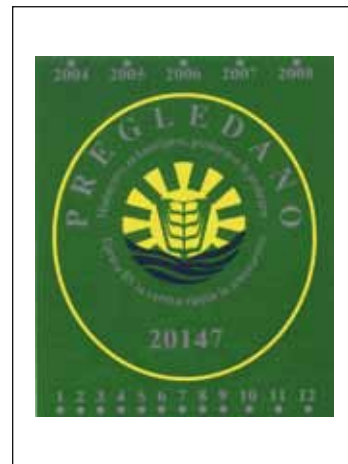
Nalepka kot potrdilo o opravljenem pregledu