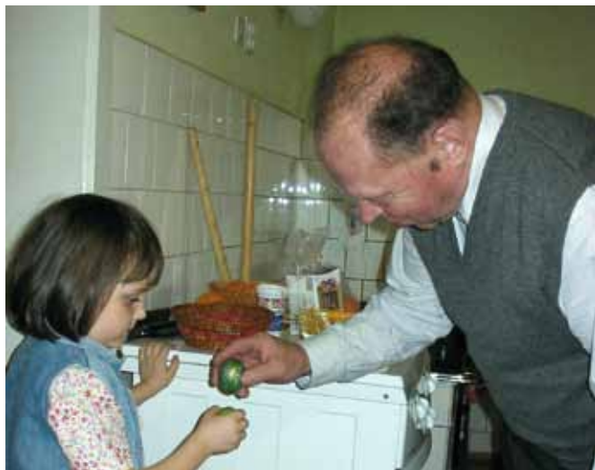
Ponekod je še vedno živ star običaj, ki mu rečejo trkanje: zmagovalc od poraženca dobi »hruško« - pirh, ki ima strto peto in spico. (Tekst in foto: Marjana Cvirn)

Na veliko soboto dopoldne je bil pred cerkvijo pripravljen kup lesa, ki so ga otroci nabirali po hišah – za straženje Boga. Zjutraj so otroci tekli v cerkev po ogenj. Pograbili so vsak svojo lesno gobo in z žeganim ognjem tekli domov. Popoldne je bil v cerkvi blagoslov jedi – blagoslov žegna. Dobrote, ki jih je gospodinja položila v košaro, so bile