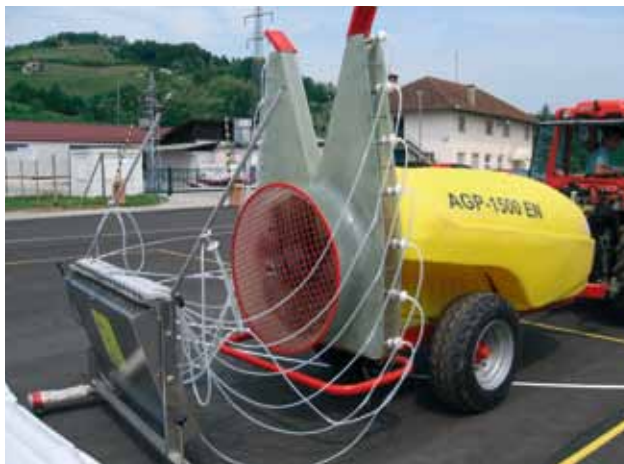
Lastniki škropilnic in pršilnikov so dolžni vsaki dve leti opraviti pregled pri pooblaščenem nadzornem organu.

Pravilnik o spremembah in dopolnitvi Pravilnika o pogojih in postopkih, ki jih morajo izpolnjevati in izvajati pooblaščen nadzorni organi za redno pregledovanje naprav za nanašanje fitofarmaceutskih sredstev (U.l. RS, št. 97/05), pravi, da je potrebno redne preglede opraviti na napravah za površinsko nanašanje fitofarmaceutskih sredstev na traktorski ali samohodni motorni pogon in na napravah za prostorsko nanašanje fitofarma-