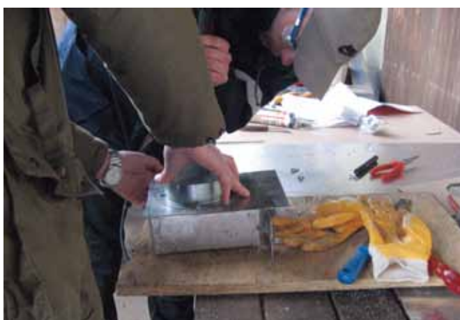
Slika 3. Na osnovi kartonskega modela izdelamo nastavek (škaflo) iz pločevine (dele zlepimo in zatesnimo s silikonskim kitom), ki ima na eni strani izrezano odprtino in pritrđeno rozeto za namestitve plastične cevi.