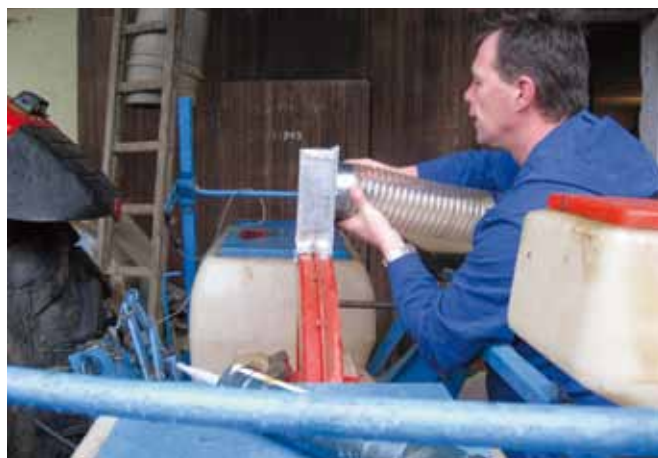
Slika 5. Na rozeto pritrđimo fleksibilno plastično cev, ki mora segati do tal. Stabiliziramo jo s kovinsko objemko na ohišje rozete in dodatnimi plastičnimi objemkami na ohišje sejalnice.