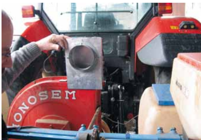
Slika 4. Nastavek pritrđimo na odprtino za iztok zraka na ohišju sejalnice in zatesnimo.