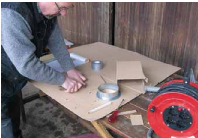
Slika 2. Mere prenesemo na karton in izrežemo najprej model za nastavek iz kartona.