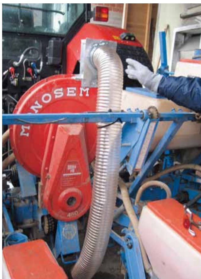
Slika 6. Končni izgled pravilno predelane podtlačne sejalnice za setev tretiranega semena koruze.