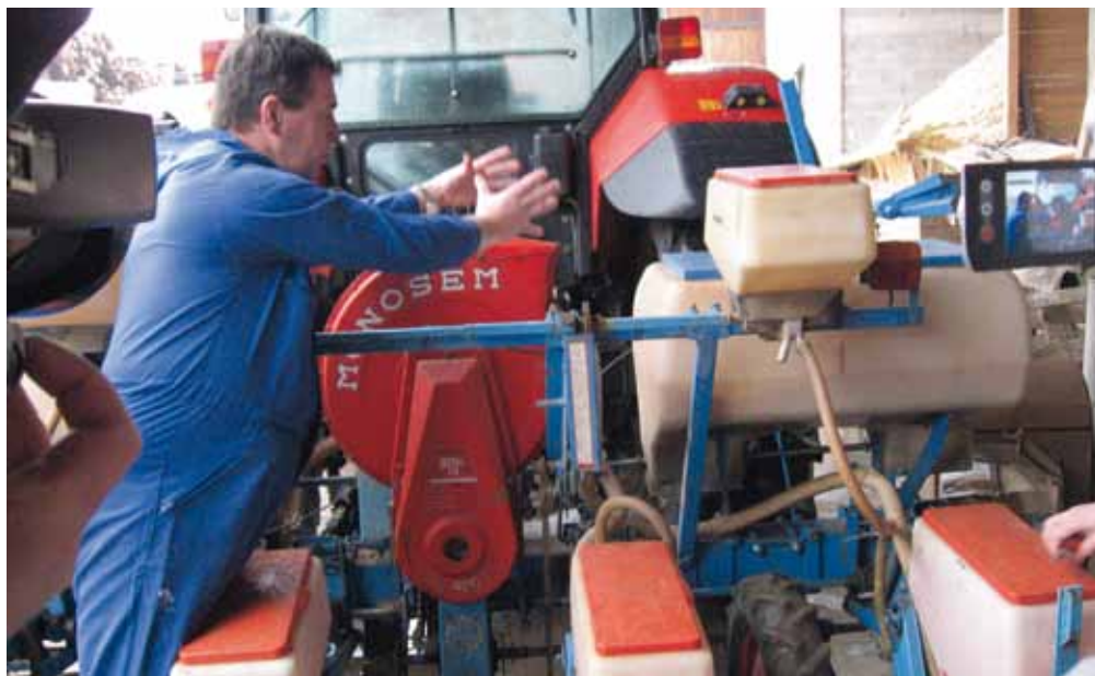
Slika 1. Z izstopne odprtine ventilatorja odstranimo usmerjevalno loputo in izmerimo odprtino za iztok zraka.

Prvi so sejalnico predelali doma na kmetiji Štebe v Komendi. Poglejmo postopek predelave: