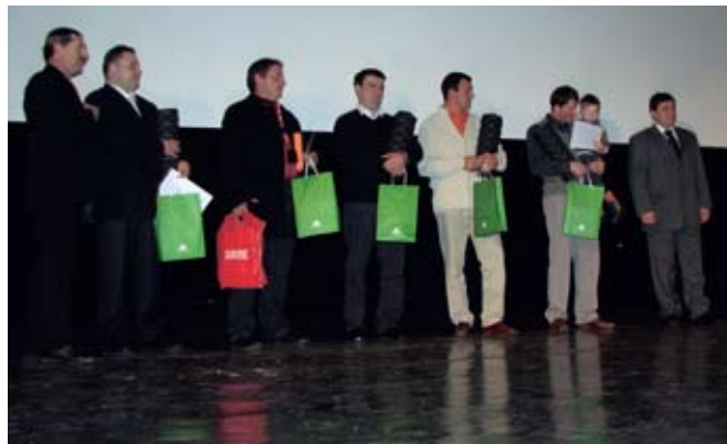
Namen izbora Inovativni mladi kmet je vzpodbuditi mlade, da pokažejo svojo inovativnost in pozitiven vpliv njihovih zamisli na razvoj in zaščito okolja. Letos je svoje inovativne projekte prijavilo pet mladih gospodarjev.

»Mladi so nosilci razvoja podeželja. Odlikujejo jih številne ideje, ki so osnova za razvoj. Izbor Inovativnega mladega kmeta je korak v pravo smer. V imenu Kmetijsko gozdarske zbornice Slovenije čestitam Zvezi slovenske podeželske mladine za 15. let njenega uspešnega delovanja in si želim, da bi tudi v bodoče dobro sodelovali. Saj veste – v slogi je moč!«