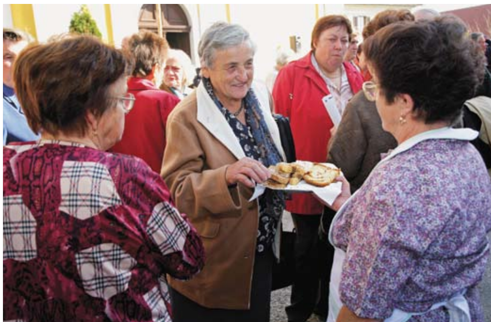
Za pogostitev po maši so poskrbele podeželske žene z območja Kmetijsko gozdarskega zavoda Celje.