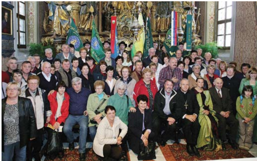
Že po tradiciji so najštevilčnejši obiskovalci shoda z območja Ilirske Bistrice, ki so se jim na skupinski fotografiji pridružili še konjeniški, hmeljarski in čebelarški praporščaki.