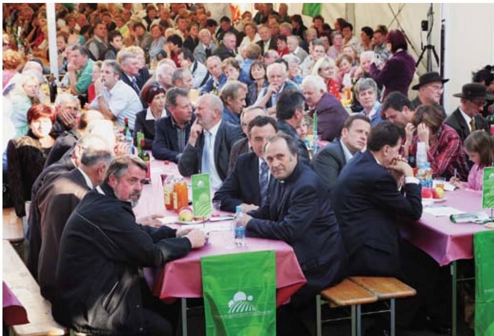
Prizorišče shoda na Slomu je bilo napolnjeno do zadnjega kottička.

Ves svet je lepo, bogato polje, na katerem lahko vsi za dolgo večnost žanjemo.