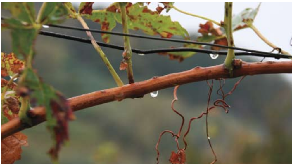
Glavna dejavnost na kmetiji je vinogradništvo.

Od Kmetijsko gozdarskega zavoda Nova Gorica pričakujem zmerne cene za storitve ter bolj aktiven pristop pri seznanjanju javnosti o storitvah, ki jih nudi. Potem je tu še svetovalna služba, kjer bo potrebno več dela na terenu ter sistemsko zmanjšanje administrativnih del.