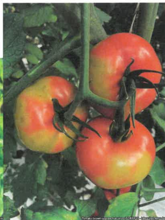
Slika 2: Rumene in rjave lise na zrelih plodovih okuženega paradižnika