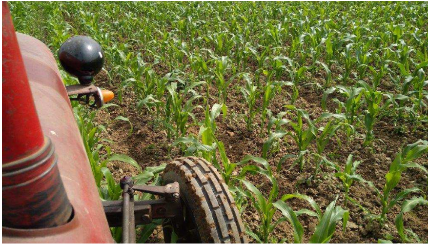
Slika 1: Koruza je najbolj razširjena okopavina tudi na njivah z ekološko pridelavo

Vegetacija, odvisno od zrelostnega razreda hibridov in okoljskih pogojev, traja v naših razmerah med 115 in 170 dni, zato lahko koruzo v kolobar vključimo kot glavni in ali naknadni posevek.