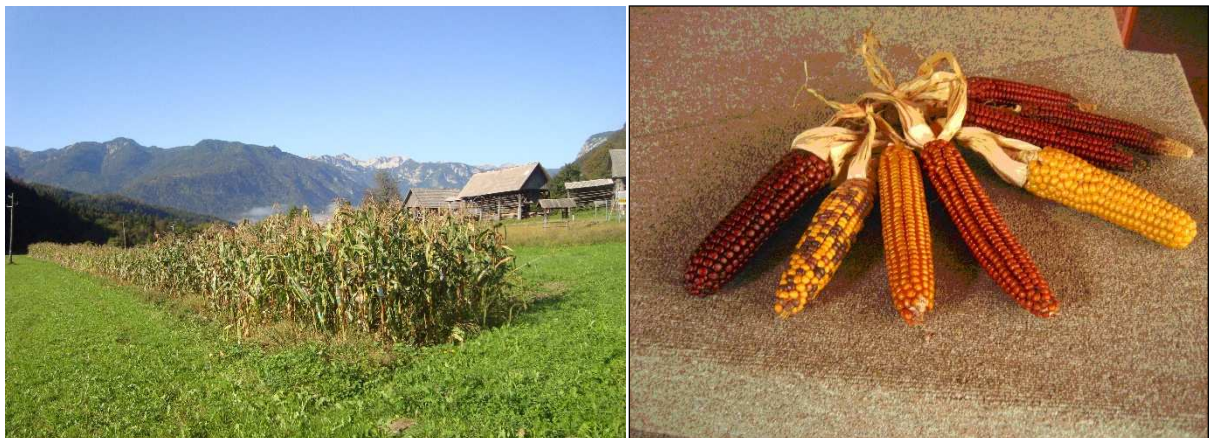
Slika 3: Lokalna sorta bohinjaška trdinka na njivi v vasi Studor in njeni storži

Glede na rezultate večletnih uradnih poskusov, ki jih izvaja KIS, v naših rastnih razmerah za ekološko pridelavo lahko priporočamo tudi spodaj naštetih hibridov koruze, ki imajo ekološki certifikat ali ustrezajo izjemam. Za dobavo ustreznega semena se je potrebno predhodno dogovoriti pri semenarskih hišah ali vzdrževalcih starih sort.