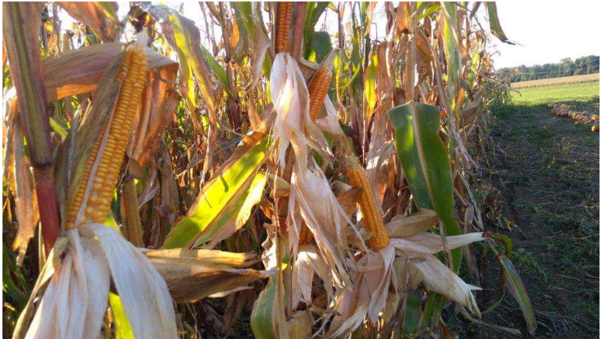
Slika 2: Lokalne sorte koruze se v skromnih rastnih razmerah bolje obnesejo