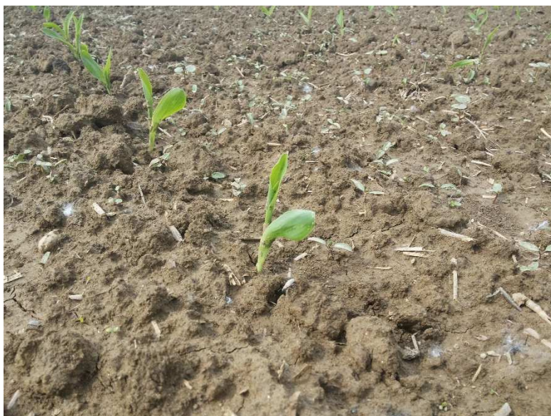
Slika 4: Mehansko zatiranje plevelov se nadaljuje od faze 2. lista koruze dalje, s ciljem čim manj plevelov, ki zmanjšujejo pridelok

Idealno je, če uspemo ohraniti večletno negovano ledino iz trav in detelj, v katero vsako pomlad posadimo nov glavni posevek. Priporoča se direktna setev koruze v pokošene posevke, ki jih zmanjšamo tako, da jih mehansko ali z ognjem uničimo v pasovih v širini 10–15 cm, kamor se poseje koruza. Za zastirko lahko izberemo tudi rastline, ki bodo po setvi koruze same zaključile razvoj, npr. mešanico mnogocvetne ljujke in inkarnatke ali mnogocvetne ljujke in bele gorjušice (SV1). Že omenjen način, kjer s posebnim valjarjem (angl. Roller crimper ) polomijo stebela rastlin za zastirko, nato pa s posebno sejalnico vsejejo glavni posevek, povzroča, da polomljene rastline počasi propadajo, obenem pa zastirajo tla in s preprečevanjem dostopa svetlobe značilno ovirajo razvoj plevelov v posevkih. Težave, ki se pri tem lahko pojavljajo, so razvoj dovolj velike zelene mase pred valjanjem, ponovna rast rastlin, namenjenih za zastirko, imobilizacija N, težave z dodajanjem N zaradi zastirke in slaba kakovost setve v zastirko (SV6). Prikaz takega načina setve si lahko ogledate na povezavi: https://www.youtube.com/watch?v=TFxNdCZes60